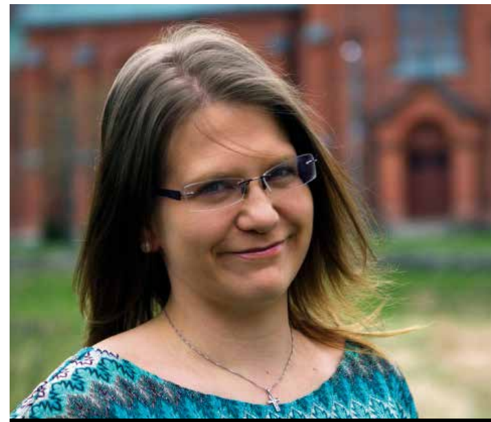
KOLUMNEN: SARA GEORGE