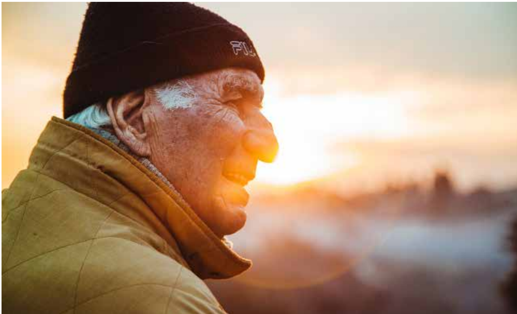
Det är viktigt att få träffas och utbyta tankar med jämnåriga.