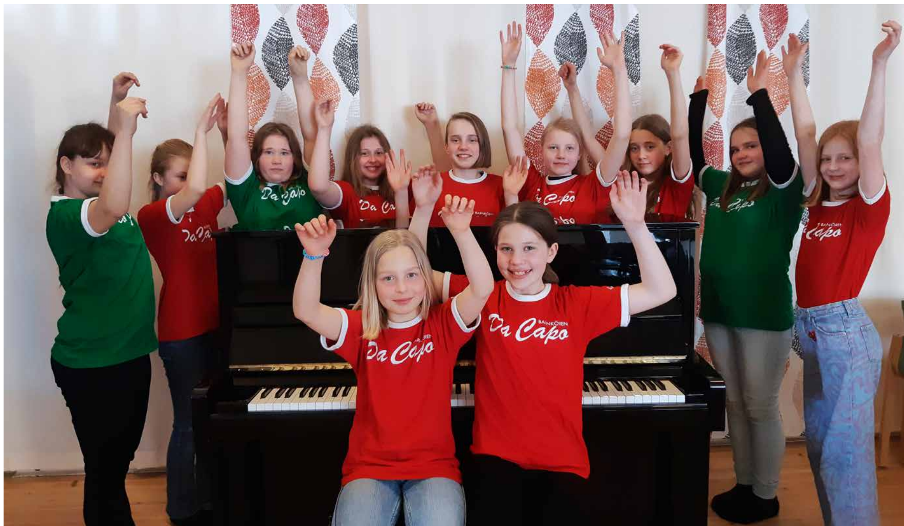
Da Capo-gänget har roligt på tisdagens körövning.