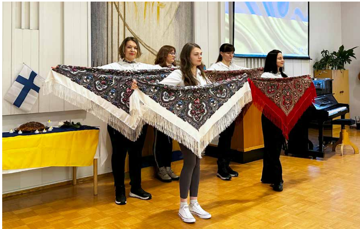
Traditionell dans med sjalar.