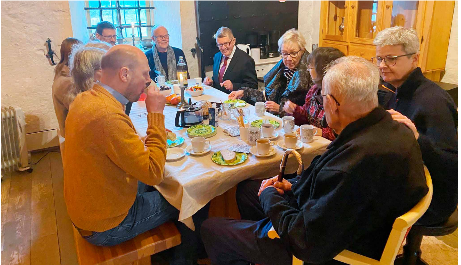
Det blir alltid fullt runt bordet efter gudstjänsten – ibland är deltagarna så många att man måste ta kaffe med dopp i kyrksalen.

Lokalsidorna för de svenska församlingarna i Åboland-Åland utkommer i varje nummer av Kyrkpressen. Redaktör: Sofia Torvalds, sofia.torvalds@kyrkpressen.fi, tfn 040 831 6748. Dessa sidor görs i samarbete med församlingarna och materialet är beställt av dem.