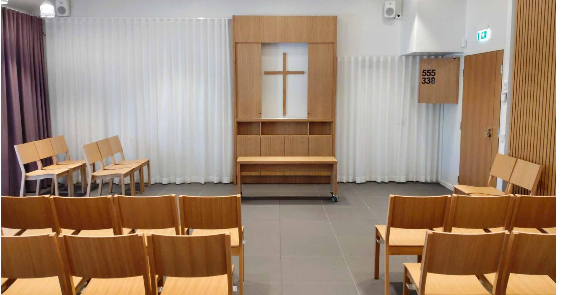
Inredning i ek och textilier i vitt, grönt och lila. Den nya kapellsalen Aeternitas ger ett lugnt intryck.

De lokala sidorna i Borgå, Sibbo och Vanda utkommer i varje nummer av Kyrkpressen. Redaktör: Rebecca Pettersson, rebecca.pettersson@kyrkpressen.fi, tfn 040 831 6788. Dessa sidor görs i samarbete med församlingarna och materialet är beställt av dem.