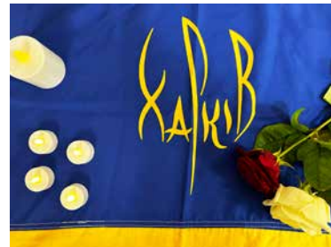
Det bjöds både på borsjtj och varenyky – den ukrainska varianten av klimp – samt dessert. På den ukrainska flaggan står staden Charkivs namn.