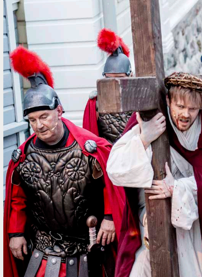
Scen ut Via Crucis 2019.

Arrangör: Via Crucis Tuki rf i samarbete med lokala församlingar, företag och föreningar. Producent: Esa Valkeajärvi.