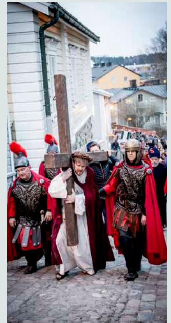
Scen ut Via Crucis 2019.

Trots det dramatiska slutet ger pjäsen en hoppfull känsla inför påskdagen och uppståndelsen. Via Crucis samlar hundratals medverkande och publikdeltagande och förenar konst, gemenskap och tradition. Evenemanget är gratis och öppet för alla. Föreställningen direktsänds på Yle Arenan och kan ses där en vecka efteråt.