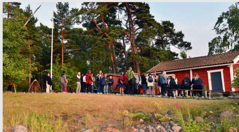
I augusti ordnas det familjeläger på Lekholmen.