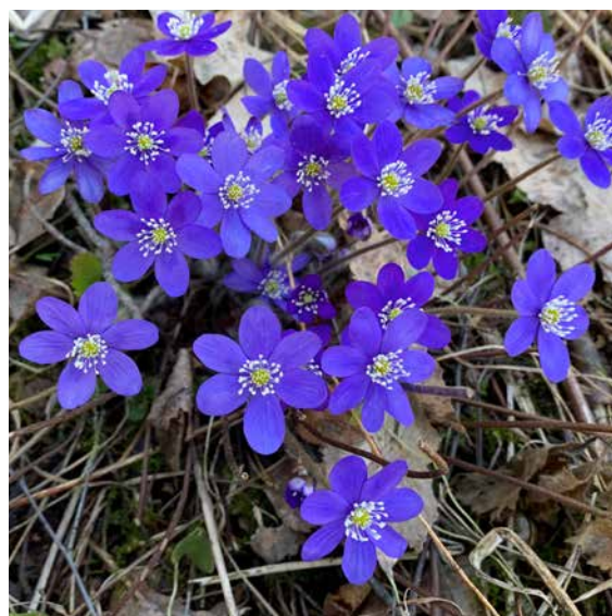
”Er far vet vad ni behöver, innan ni ber honom om det”, sa Jesus.

Han känner mig. Han vet när jag bubblar av lycka över blåsipporna. Han vet hur mitt hjärta ropar på hjälp, när jag träffar invandrarkvinnan som inte vågar möta framtiden. Han vet vad jag menar, fast jag inte kan sätta ord på mina känslor.