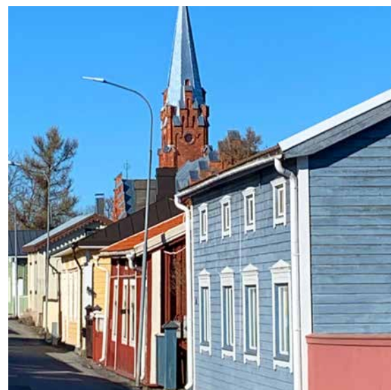
Vären skärper färgerna. Ljuset gör att vi ser längre.

”Låt oss lära känna honom, låt oss sträva efter kunskap om Herren. Så visst som gryningen skall han träda fram, han skall komma till oss som ett regn, som ett vårregn som vattnar jorden.”