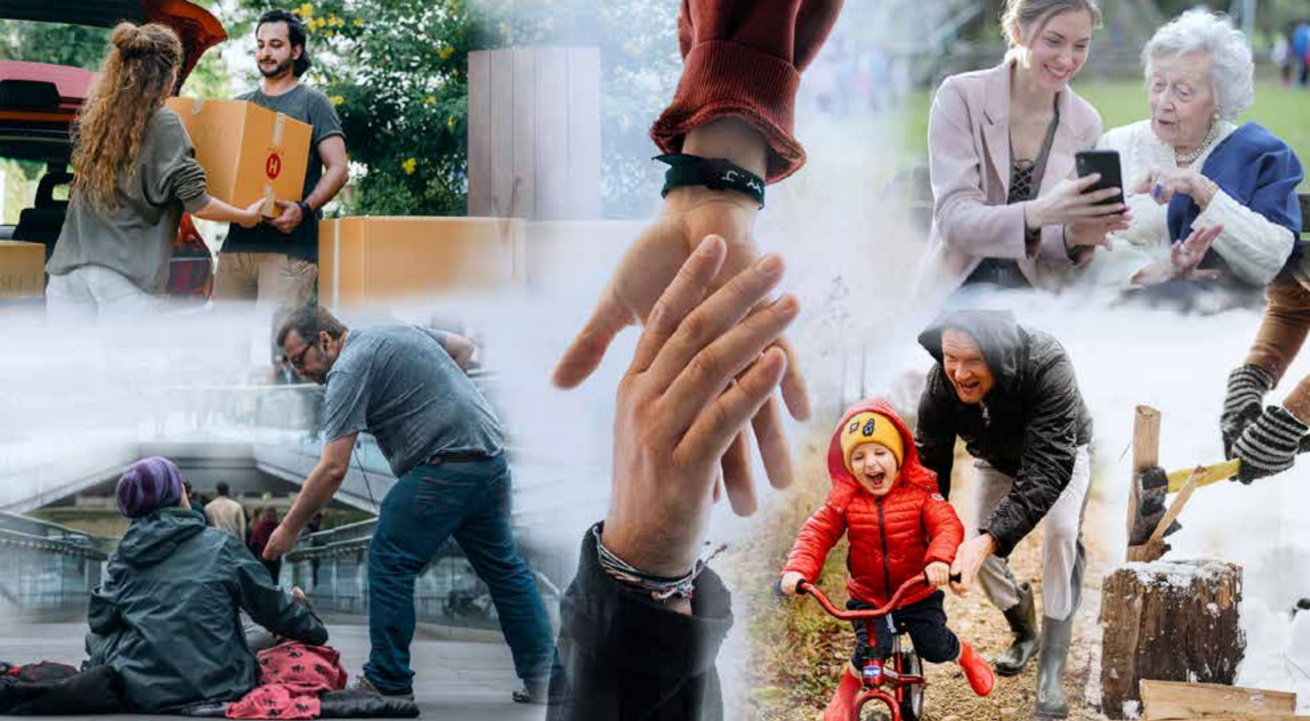
FOTON: PEXELS OCH PIXABAY COLLAGE: MALIN AHO