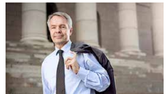
Utrikesminister Pekka Haavisto.

– Jag bad: Jesus här är Benazir, tag emot henne, förlåt henne hennes synder, var med henne varje dag och ta henne hem till dig den dag hennes liv på jorden är slut. Jag välsignade henne med Herrens välsignelse och kors-tecknet. Hon återvände till Pakistan, ställde upp i valet och mördades 2007.