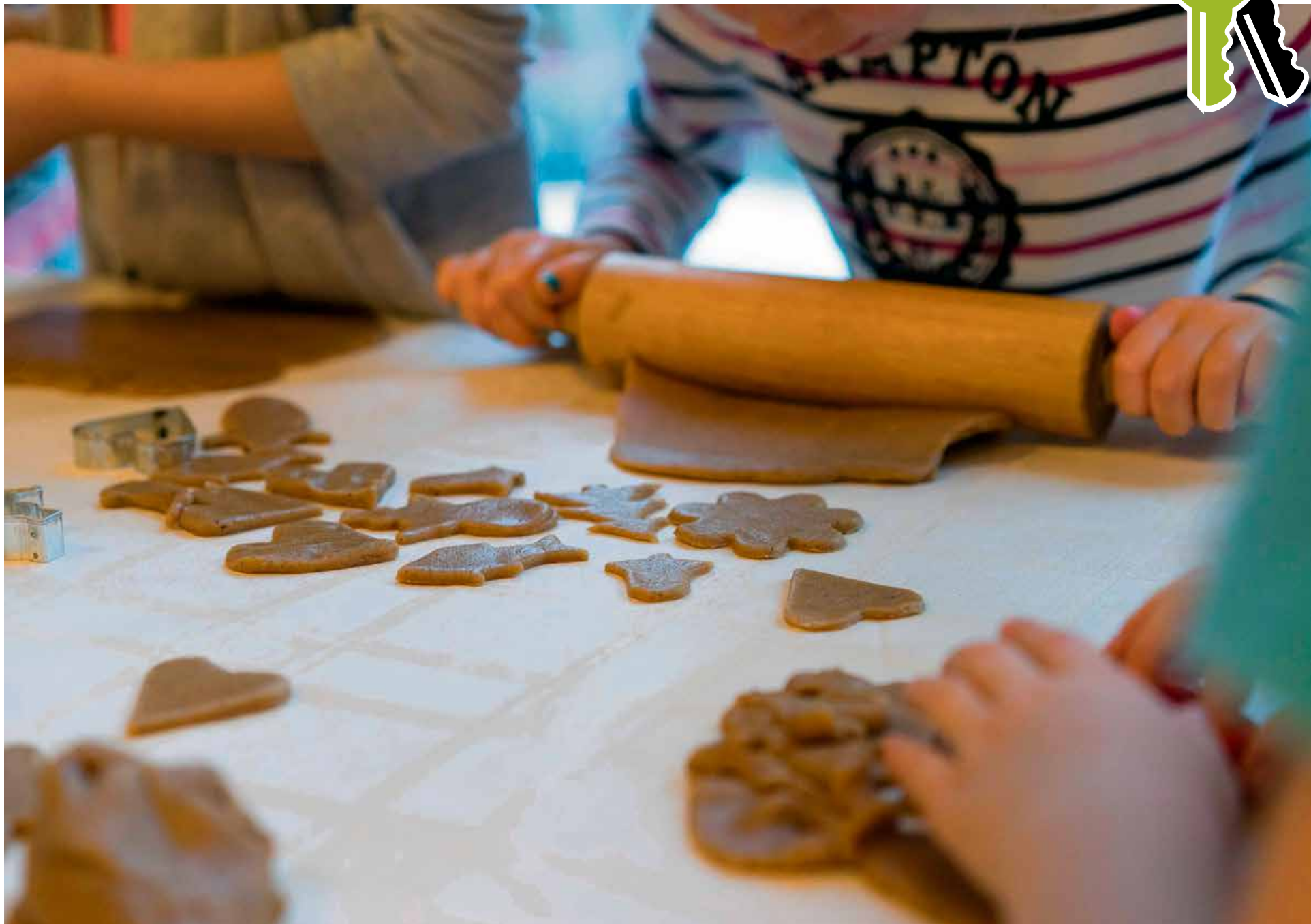
Här bakas – och smakas – det på pepparkakor! Stämningen var hög när de sjungande små bagarna fyllde plåt efter plåt med grisar och stjärnor och favoriten för i år: granen.