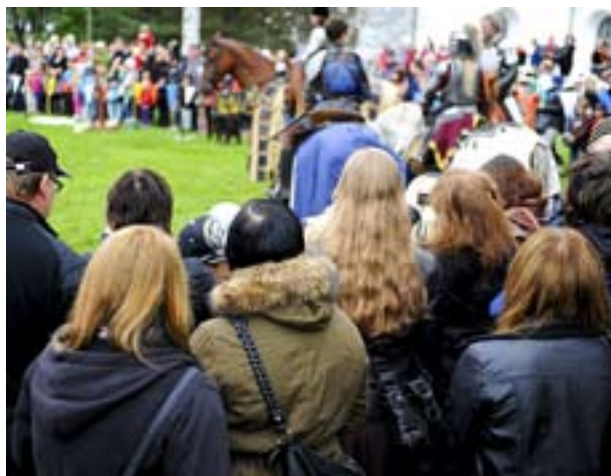
Den medeltida turneringen lockade många åskådare.