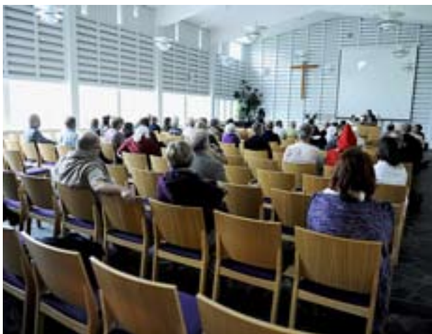
Under lördagen hölls flera föreläsningar med medeltidstema.

Den tredje september år 1511 skrev påven under ett dokument om grundandet av Karleby församling. Karleby firade i lördags sina 500 år genom att ordna en medeltidsdag. Kyrkbacken förvandlades till marknadsplats och när det ordnades en gammalkyrklig mässa i Karleby sockenkyrka skulle kvinnorna täcka huvudet.