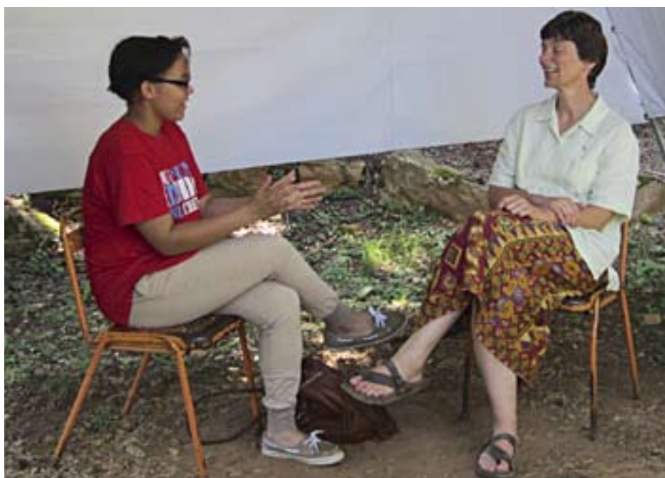
Självvård är en viktig del av syster Kois (t.h.) och de andra nunnornas arbetsuppgifter i Taizé.

– Det kändes inte rätt. Ibland tar det tid att hitta sin