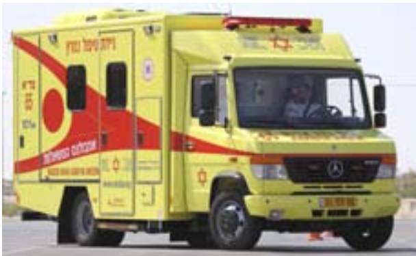
Önskeambulansen har en speciell hissanordning för att flytta de svårt sjuka patienterna.