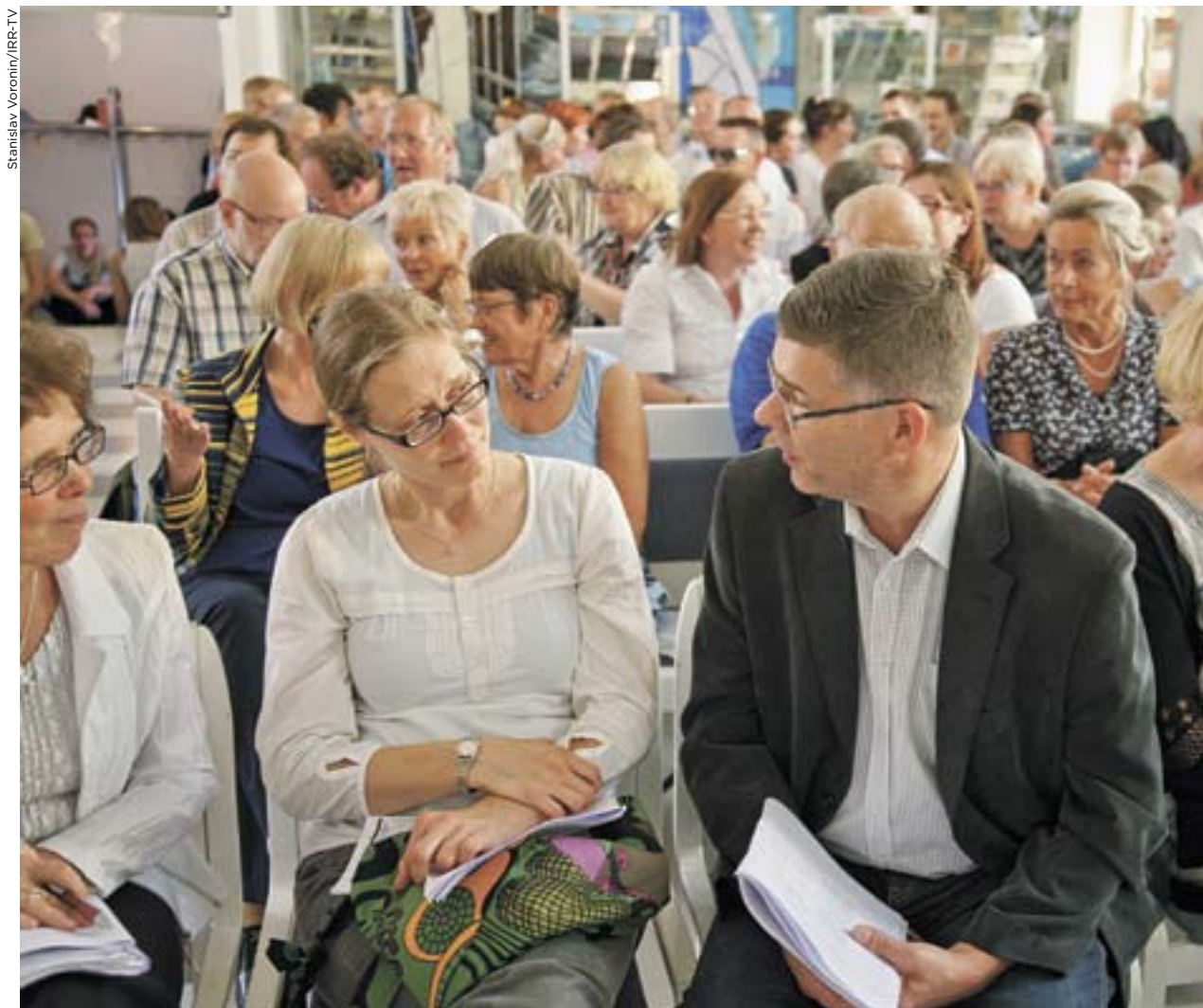
Alla rymdes inte in på utbildningen inför den kristna mediakampanjen "Livets chans" som genomförs i Storhelsingfors.

– Vi vill poängtera vikten av lagligt bindande förpliktelser för att ta itu med krisen, skrev KV i ett meddelande till FN:s klimatförändringskonferens i Köpenhamn 2009. (MW)