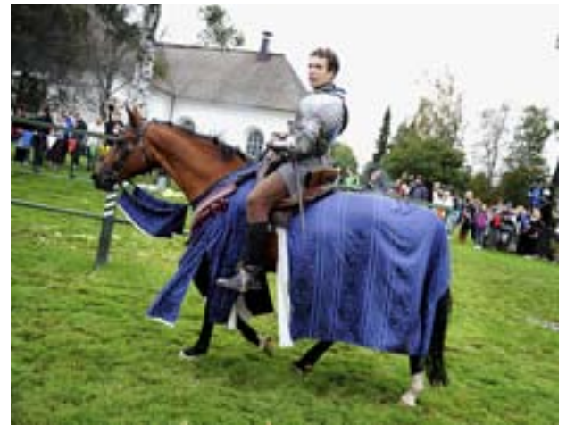
Ryttare från Rohan-stallet bjöd på en medeltida turnering.