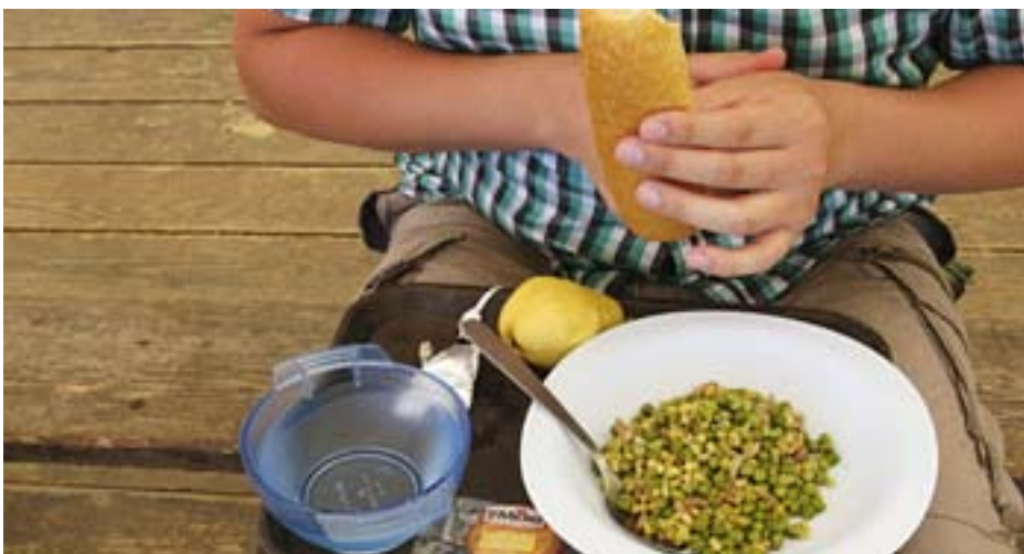
Maten i Taizé är enkel men mättande.

– Jag anländer en timme före de andra, sätter vatten på kokning och väljer red-