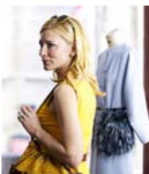
CATE BLANCHETTS rollfigur Jasmine är inlåst i sitt eget öde.

Cate Blanchett spelar filmens huvudroll som Jeannette "Jasmine" Francis. Hon har vant sig vid ett liv i överdådig lyx som hustru till Harold "Hal" Francis, spelad