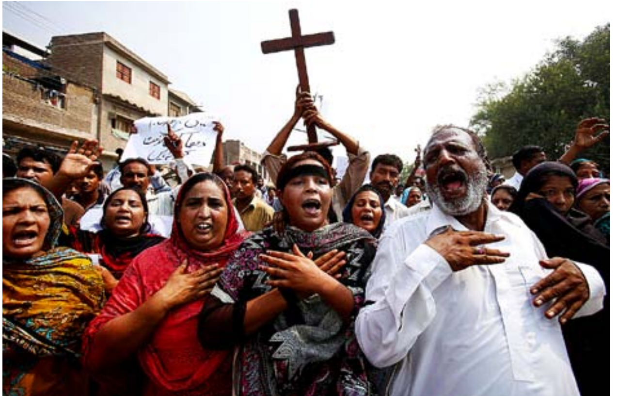
KRISTNA PAKISTANIER demonstrerar efter attacken i Peshawar.

– Att skjuta upp starten är osolidariskt mot de samfälligheter som kämpat med att komma till rätta med barnsjukdomarna. Ju fler som kommer med, desto bättre möjligheter har vi att kräva att servicen förbättras samt att programmens alla delar översätts till svenska.