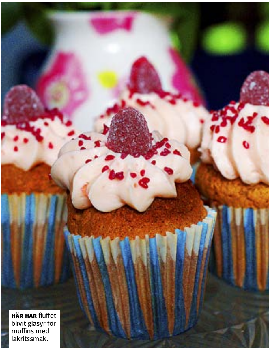
HÄR HAR fluffet blivit glasyr för muffins med lakritssmak.

Lakritspulver finns numera i de flesta butiker, ofta vid strössel- och sockerhyllan.