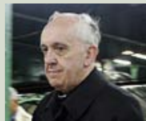
PÅVEN FRANCISKUS har gett en intervju.

Samtidigt menar en del katolska kommentatorer att påven blivit missför-