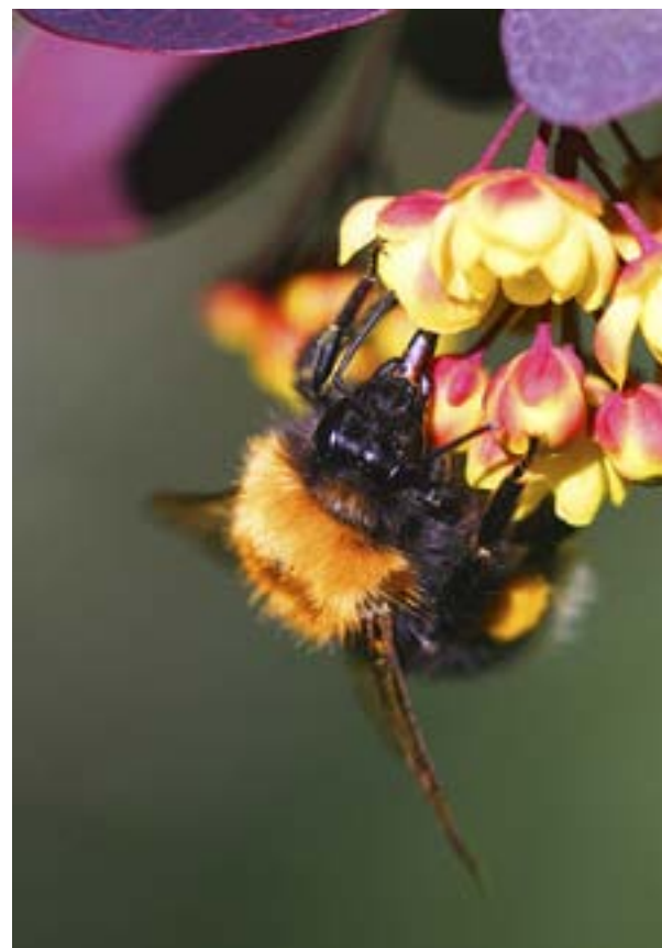
MAKROBILD AV en humla. Fotografier visar detaljer i omgivningen som annars är svåra att se.

– Man måste orka vänta på den rätta situationen och veta hur fåglar och djur uppför sig. Då är det betydligt lättare att få en bra bild. Gärna ska man också använda ett teleobjektiv.