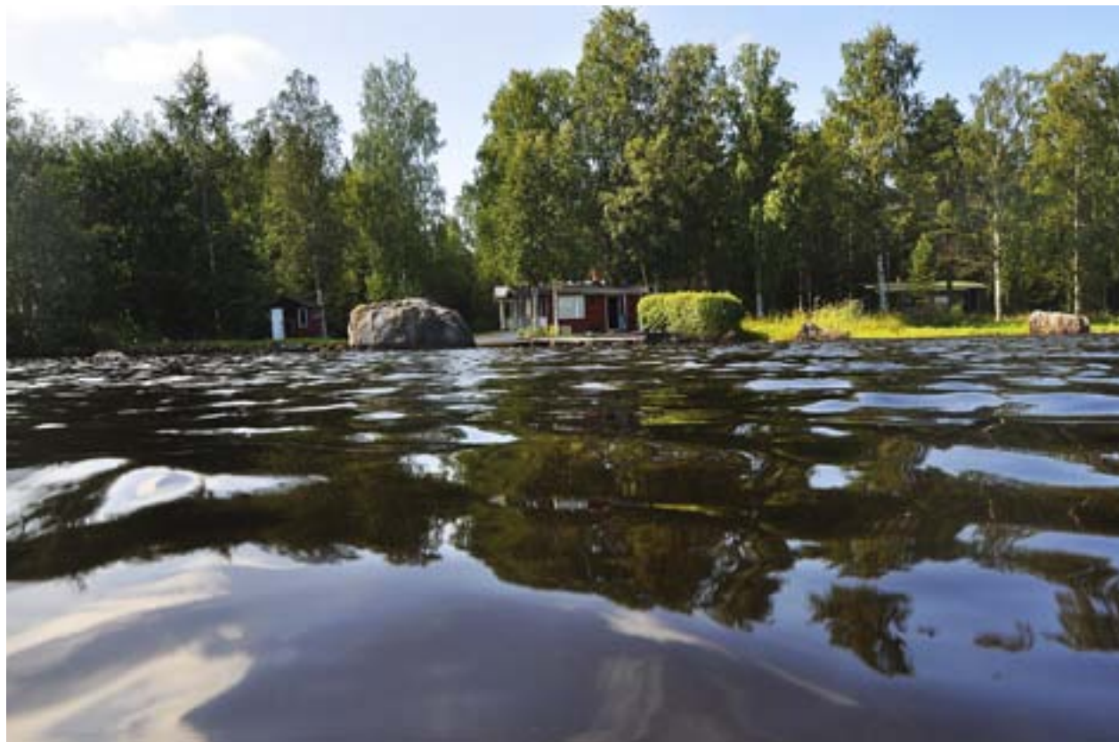
SOMMARSTUGESTRANDEN UR simfågeln perspektiv med sjöns och himlens speglingar. – Bilden är tagen med vattenända upp till halsen.

Staffan Söderlunds naturfilmer finns att se på Youtube under namnet StaffanLena.