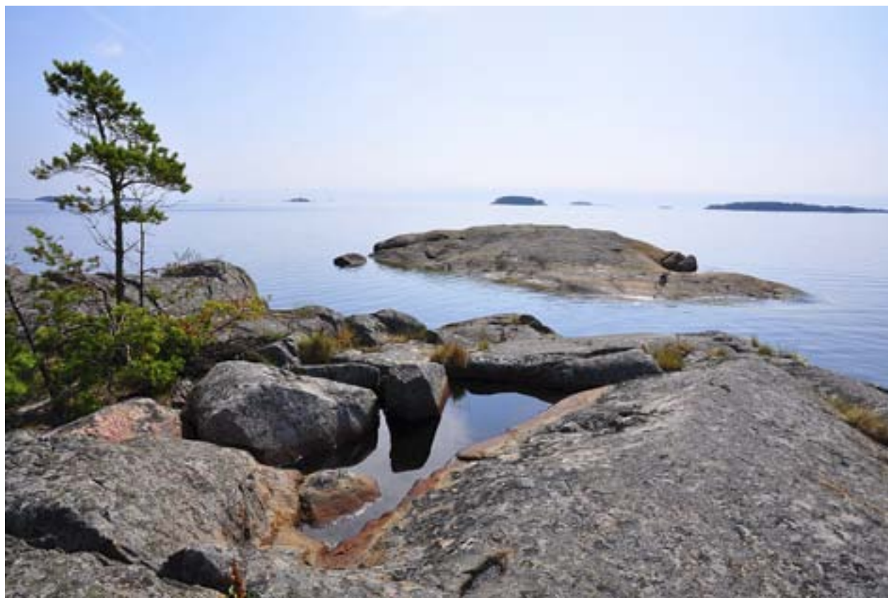
VARMA KLIPPOR , svalt vatten, strålade sol utanför Sarvsalö i Pernå skärgård under en av sommarens finaste dagar.