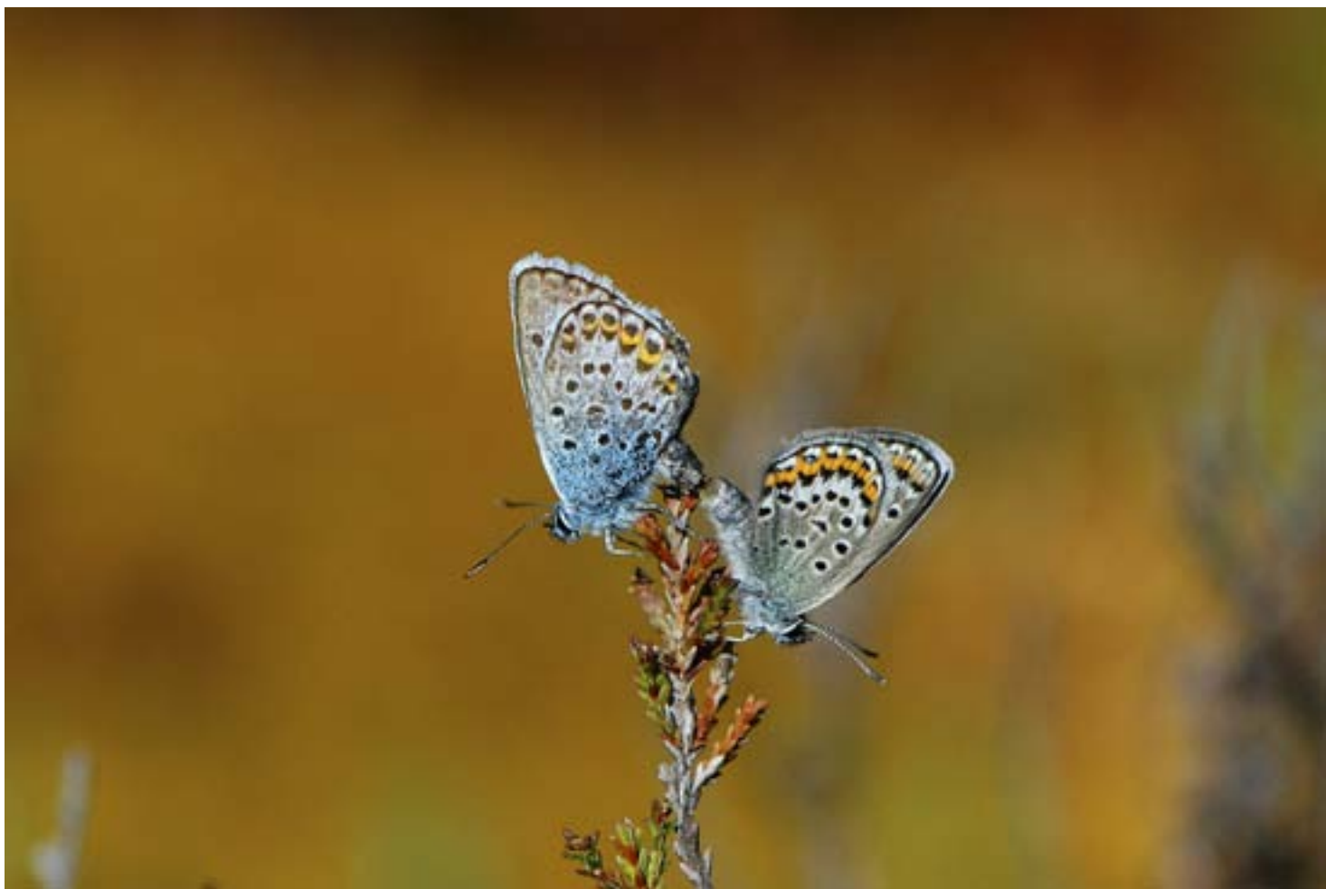
LJUNGBLÅVINGAR UNDER parningsakten på myren Kaakkurilammit i Karleby i slutet av juli.

– Som ung fotograferade jag ganska mycket och arbetade i mörkrum. När digitalkamerorna kom föll jag av kär-