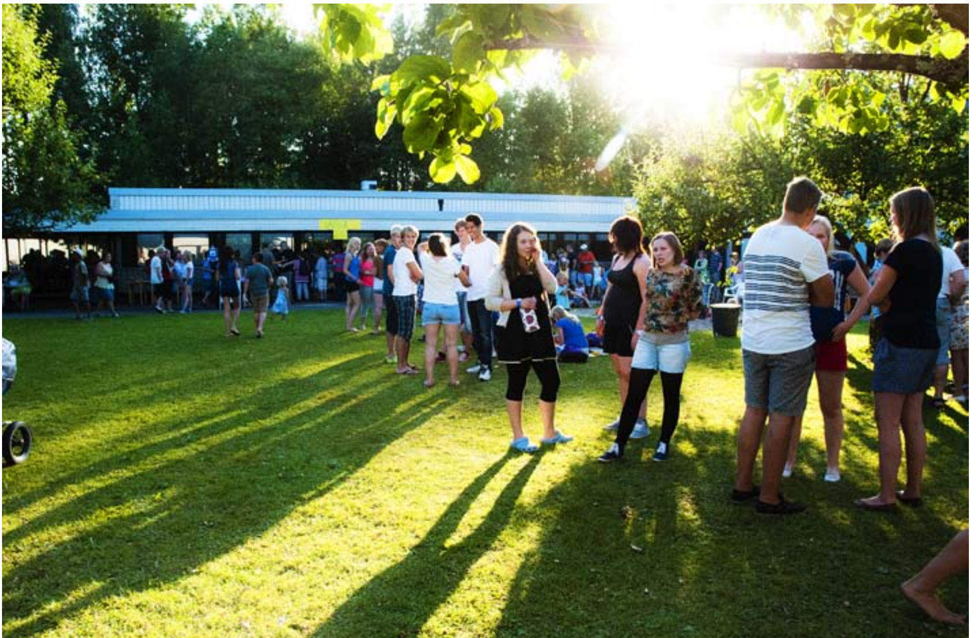
MISSIONSKVÄLLEN BJÖD på både information om finska missionssällskapets verksamhet samt korvgrillning och väffelkalas.