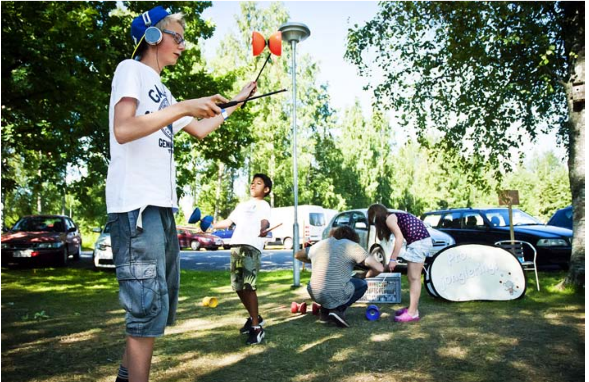
TVILLINGARNA SJÖNNEBYS cirkuskurs var populär såväl kurstid som under fritiden. – Vi vill gärna att ni ska vara här och prova grejerna, säger de.