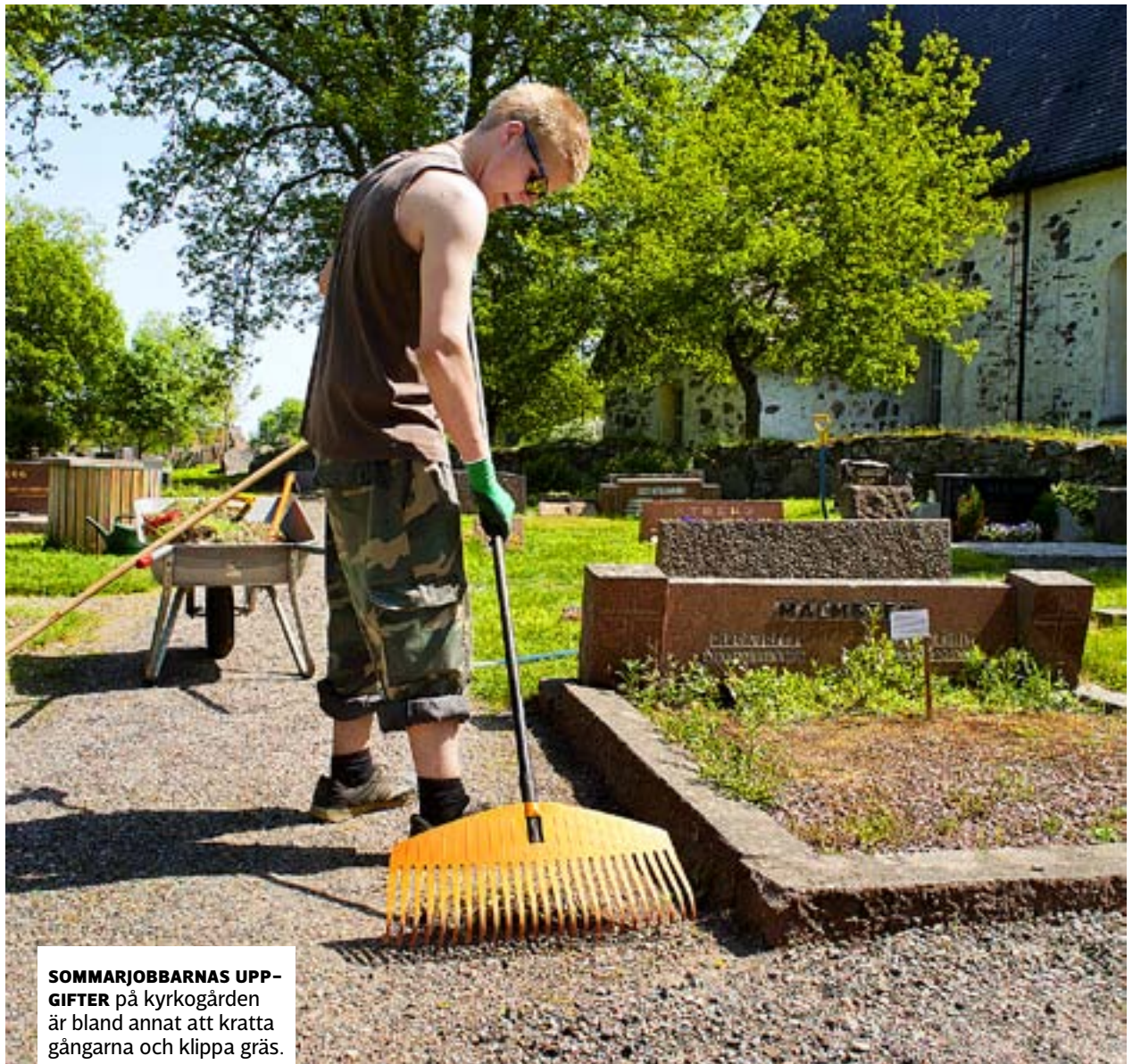
SOMMARJOBBARNAS UPPGIFTER på kyrkogården är bland annat att kratta gångarna och klippa gräs.