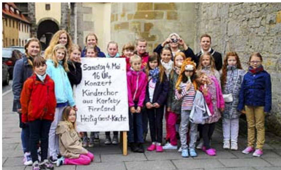
KARLEBY SVENSKA församlings barnkör besökte den tyska staden Rothenburg ob der Tauber och sjöng i Heilig Geist-Kirche.

Åländsk familj i Milwaukee, Wisconsin, USA söker svenskspråkig au pair från ca. sept 2013-juni 2014. 1-årig pojke + 6-årig flicka (i skola). Du får eget rum i villa, egen bil, mat, bensin och lön. Körkort behövs. Maila Katja: kkvovic@mcw.edu