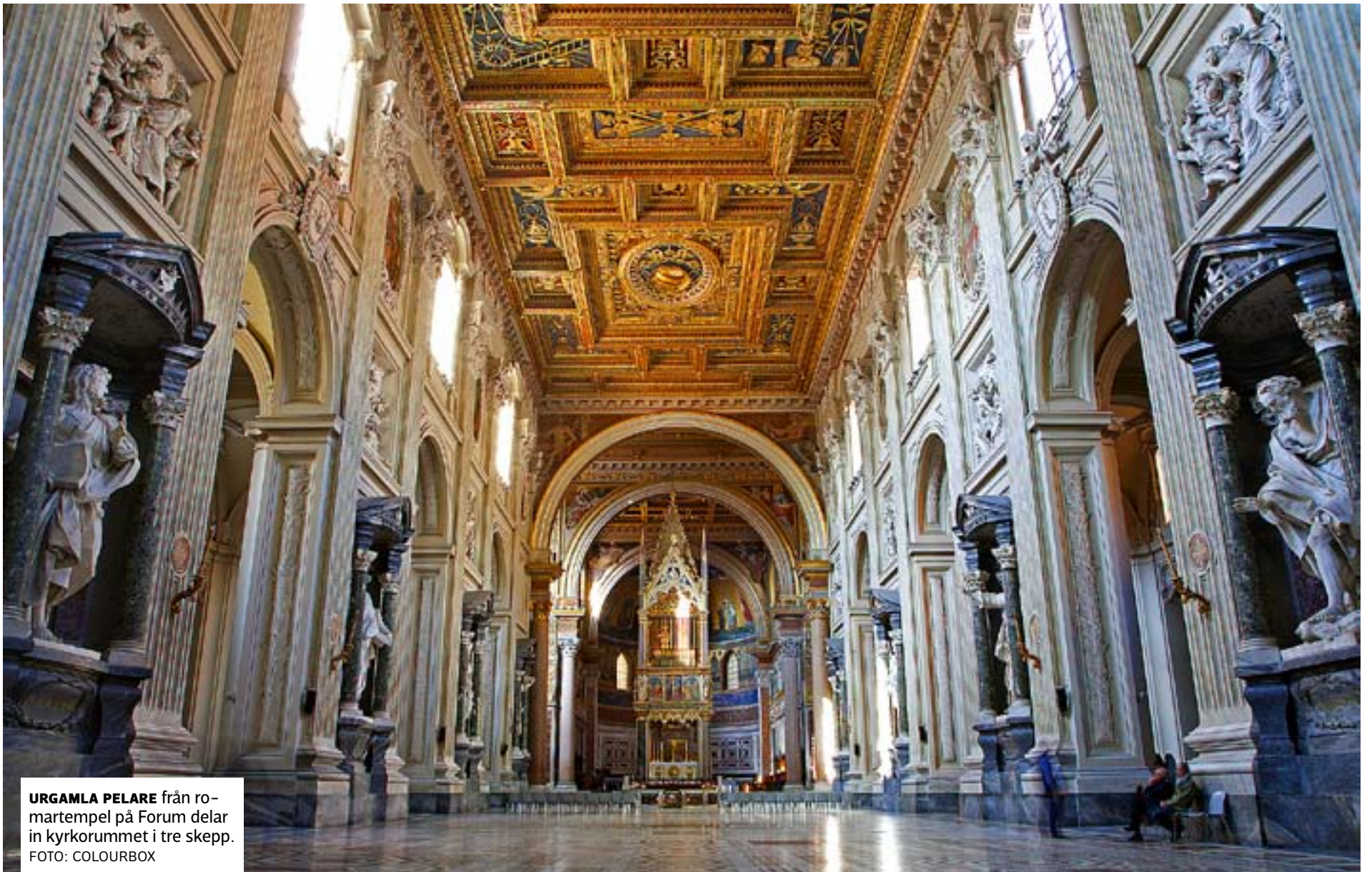
URGAMLA PELARE från romartempel på Forum delar in kyrkorummet i tre skepp.