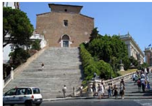
TRAPPAN UPP till kyrkan Sankta Maria Aracaeli är brant och lång. Men det finns också en kortare trappa. Nedanför trappan dominerar det moderna Roms trafikmyller.

Om den påminner om tidiga kristna sekler vittnar själva byggnaden om förkristna tider. Bokstavligen urgamla pelare delar upp kyrkorummet i tre skepp – de har släpats hit från gamla romartempel på Forum. Det som i vår tid snarast betecknas som kulturellt bari var i många sekler fullt