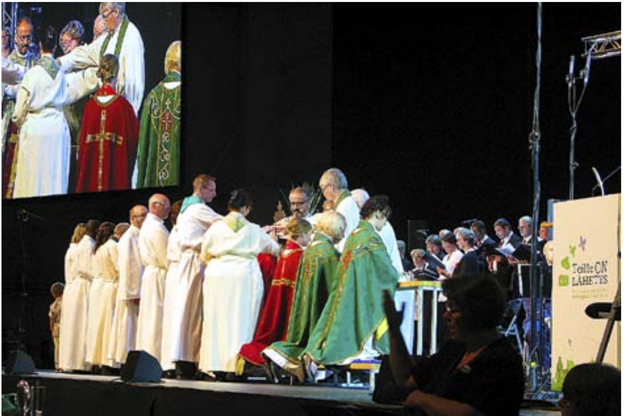
BLAND DE sex missionärer som välsignades till tjänst för FMS i söndags fanns ett par i registrerat parförhållande.