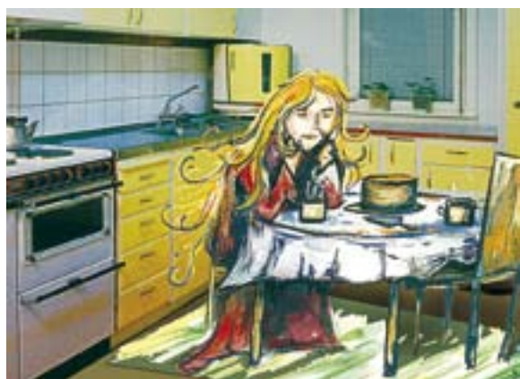
ILLUSTRATION: SONJA BACKLUND