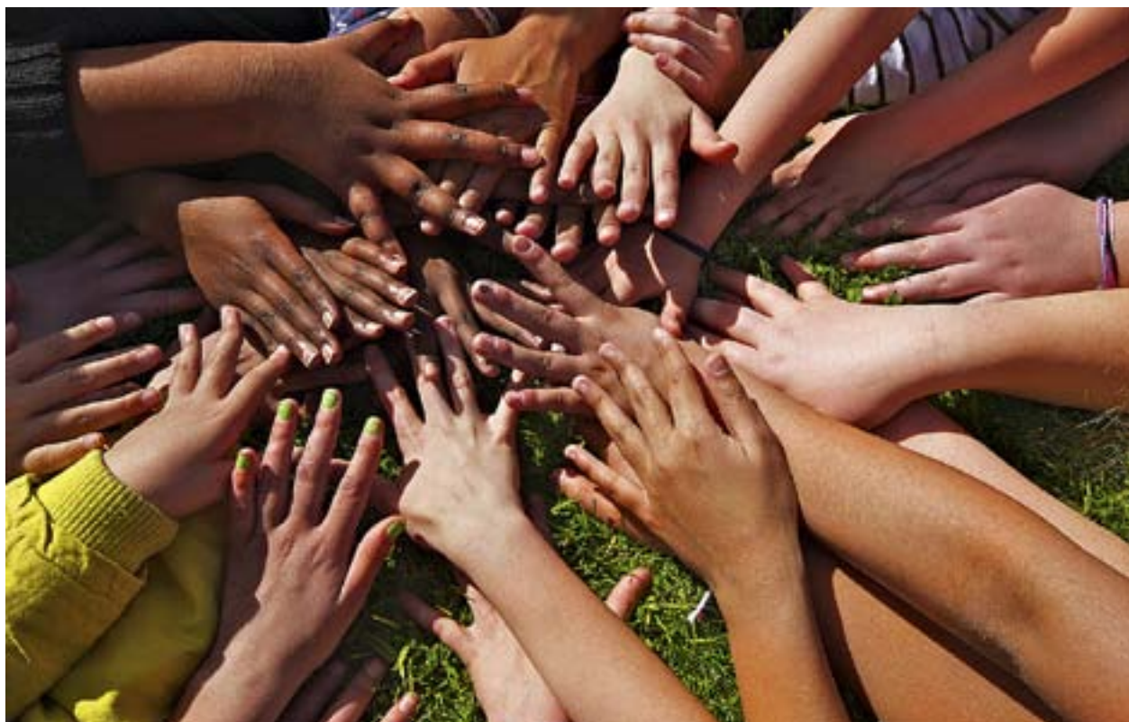
FÖR FÖRÄLDRARNA är det tacksamt att barnen kan vara på läger på sommaren då de själva jobbar.

Teologerna tycker också att en präst måste vara social och intresserad av andra människor.