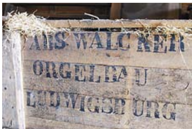
WALCKERORGELN ÄR fortfarande delvis inpackad i sin originalåda.

Kantorena efterlyser också gamla fotografier på orglarna. Delar av den vackra Normannorgelns fasad finns nämligen bevarad.