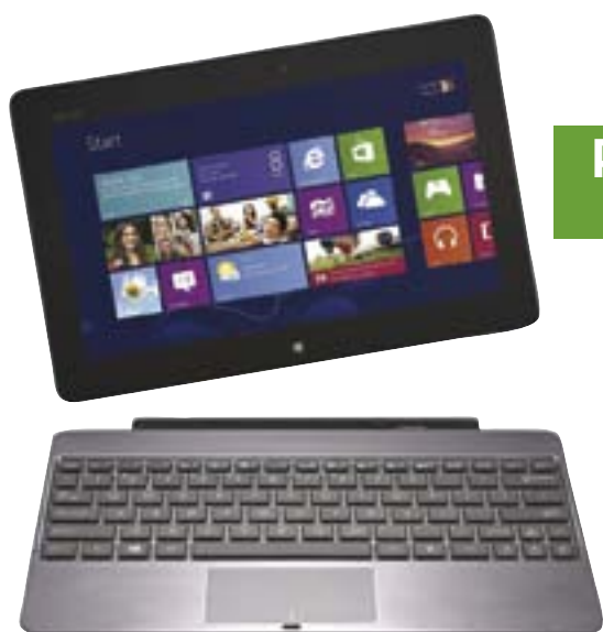
ASUS VivoTab TF600T 64GB WiFi

VivoTab är ultratunn (8,7 mm) och ultralätt (675 g) och passar perfekt för underhållning. Den ljusstarka 1080p Full HD Super IPS+-skärmen på 11,6 tum ger levande färger och en betraktningvinkel som gör den perfekt för mobil filmvisning.