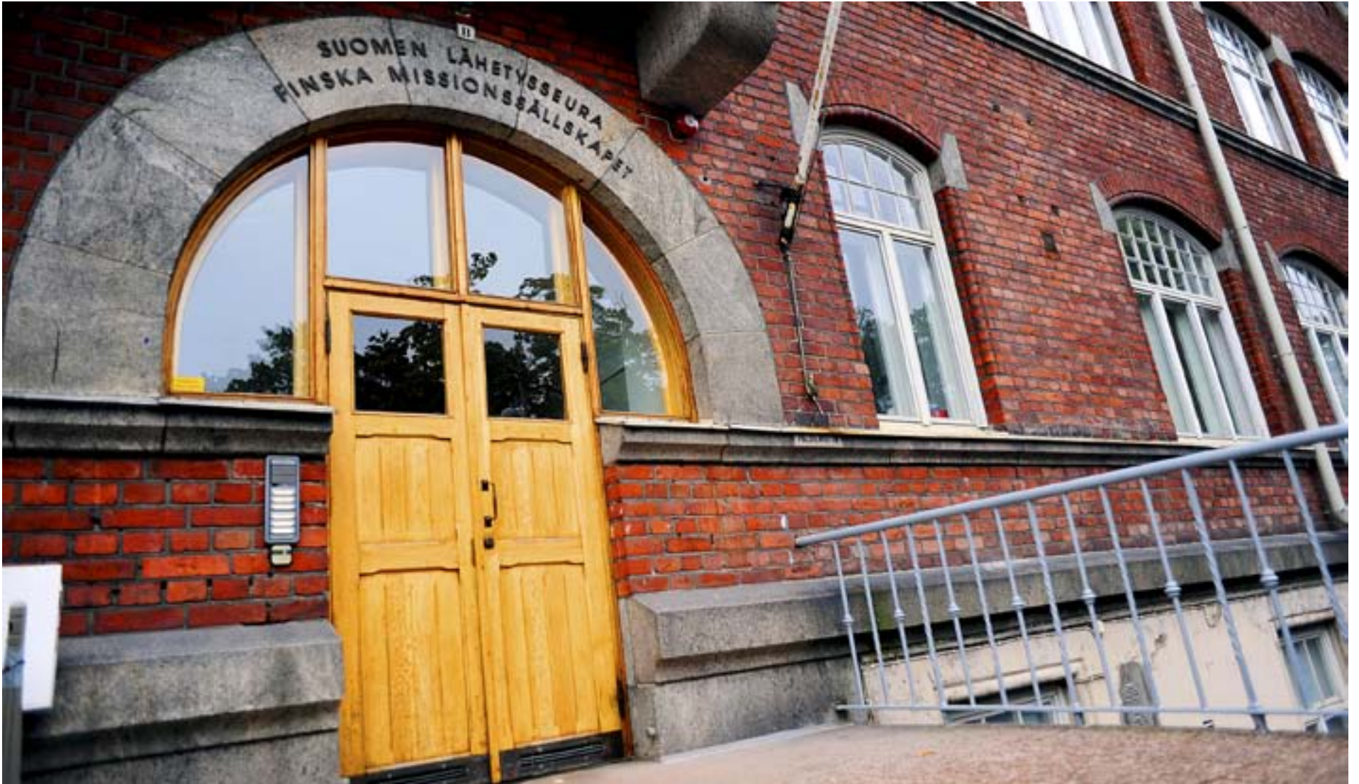
EN STIFTSSEKRETERARE för internationella ärenden ska anställas vid varje stift från och med år 2014. Beslutet innebär organisatoriska förändringar för FMS.