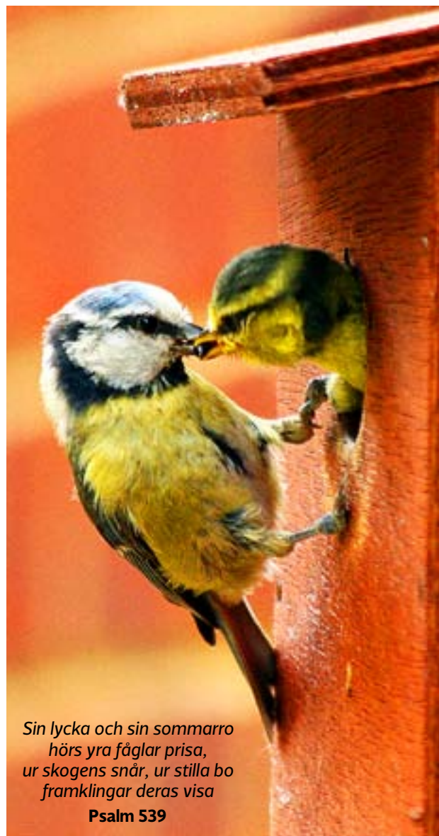
Sin lycka och sin sommarro hörs yra fåglar prisa, ur skogens snår, ur stilla bo framklingar deras visa Psalm 539

Allt är gratis och det finns inget krav på att själv ta med sig saker för att få ta med sig något hem. Bytesloppet är till för privatpersoner, inte för återförsäljare.