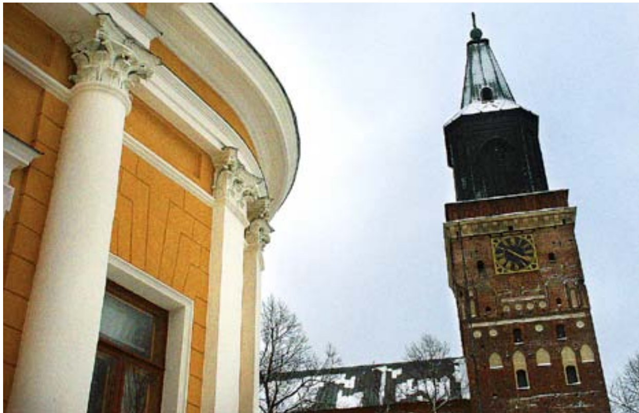
KOPPLINGEN MELLAN teologiska fakulteten och kyrkan kräver att undervisningen i teologi fyller kyrkans kvalitetskrav.