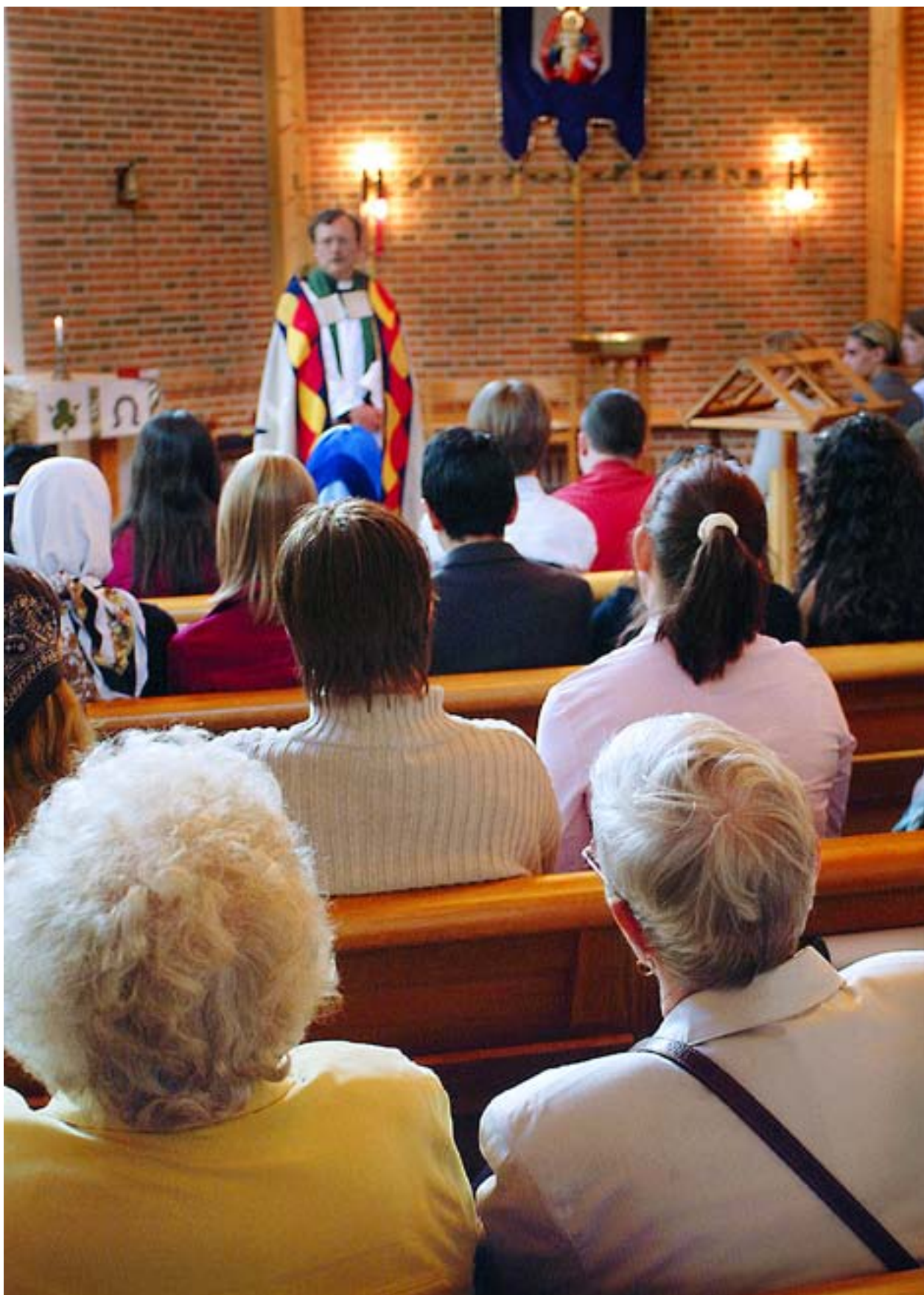
GUDSTJÄNSTEN ÄR ett heligt och mytiskt skådespel som vi förstår intuitivt – om vi har vant oss vid symbolerna och språket.

– Största delen av dem jag intervjuade hade fyllt sextio och hade gått i kyrkan sedan de var barn. De tolkade gudstjänsten på ett helt annat sätt än dagens unga gör. För en ung människa i dag