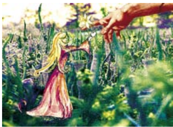
ILLUSTRATION: SONJA BACKLUND