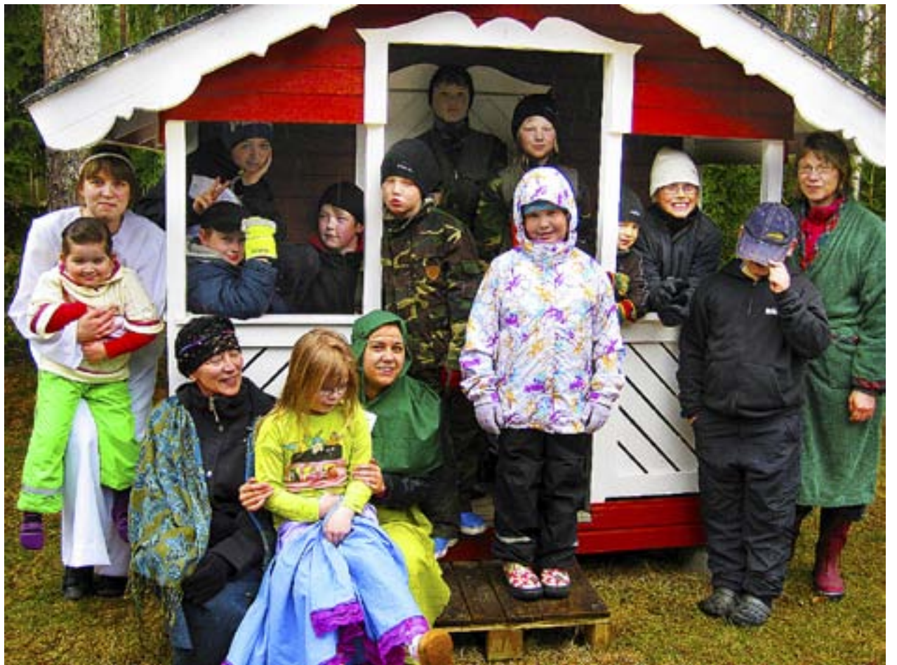
JEPPO SÖNDAGSSKOLA höll avslutningsfest i varmt men regnigt vårväder.