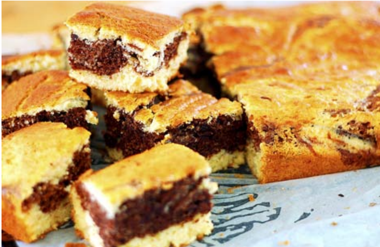
TIGERKAKAN BLIR bara saftigare av att göras ett par dagar på förhand.