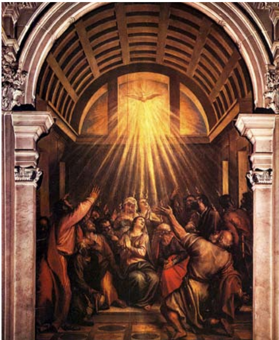
NÅDEGÅVOR och den heliga Anden borde få rum i församlingarna också i dag. Här en vision av pingsten enligt Tizian (Tiziano Vecellio).

Då det handlar om nådegåvor och andlighet i allmänhet betonar Patric Sjölander vikten av att den bibliska grun-