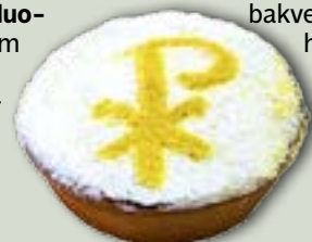
PÅSKBAKELSEN SER ut så här.

ken visar också upp biblisk matkultur och ingredienser samt en kristen bakverkstradition och helgssymbolik.