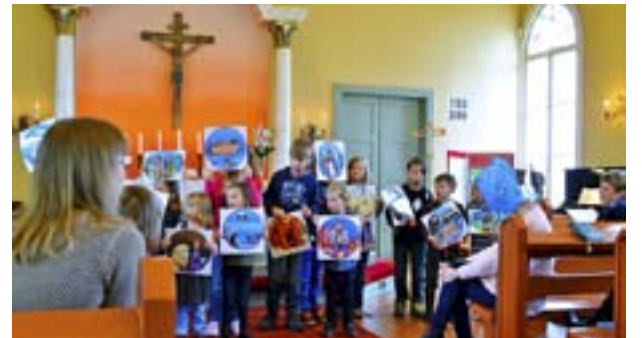
BARNEN HÅLLER upp bilder på händelser ur Gamla testamentet som ska sättas i rätt ordning.

Vi bad för fattiga, gamla och sjuka, de som var ledsna med flera och avslutade med att be bönen Fader vår . Som sista sång sjöng vi Jag går på livets väg och om det var några barn som ville fick de komma fram och sjunga igen. Det sista vi gjorde var att de barn som varit med i söndagsskolan fick komma fram och ha avslutning. Sedan var det frivilligt att komma till prästgården