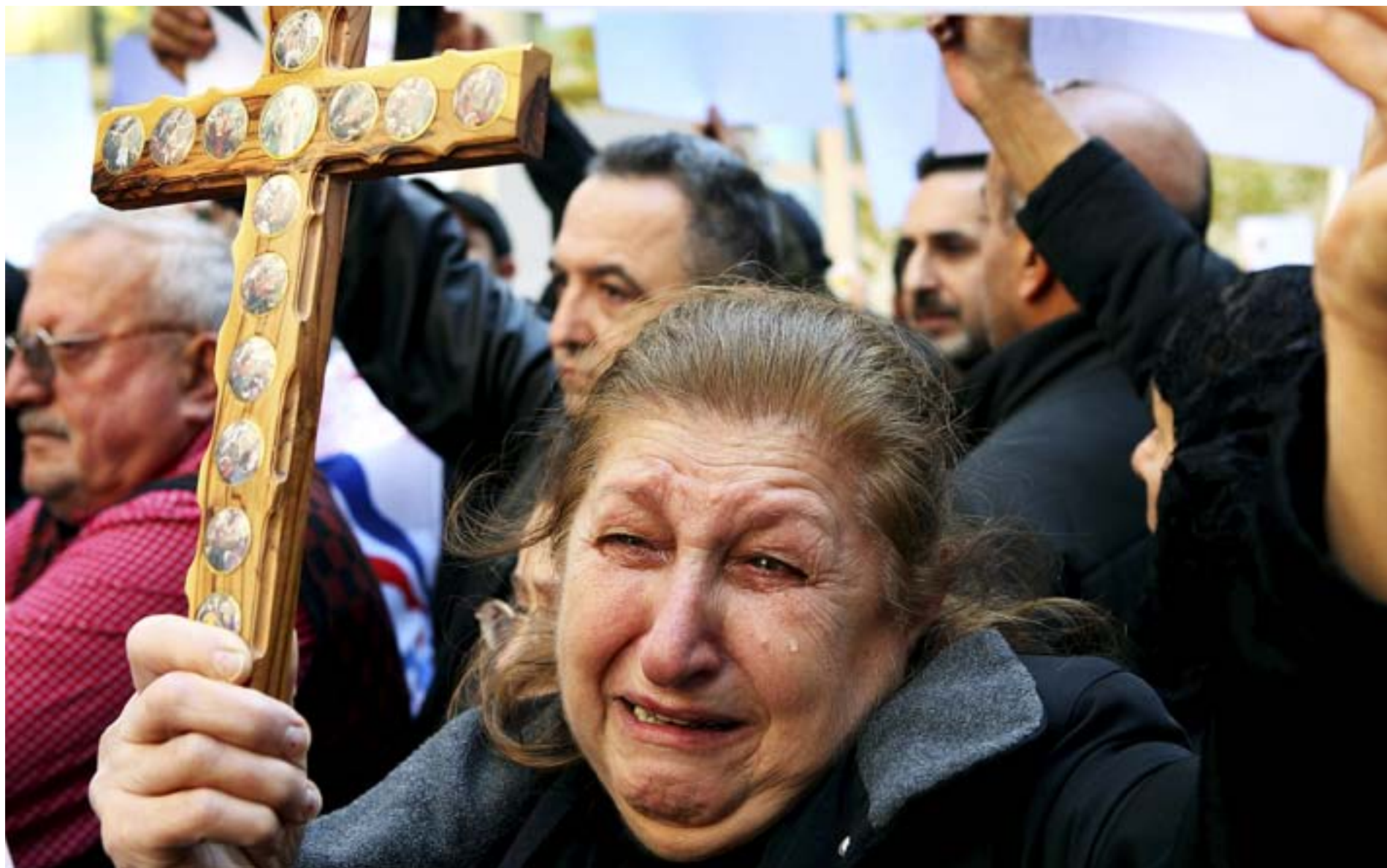
EN KVINNA brister ut i gråt under en demonstration i Chicago i november 2010. Demonstranterna vill att myndigheterna i USA och Irak ska uppmärksamma förföljelsen av assyriska kristna i Irak.