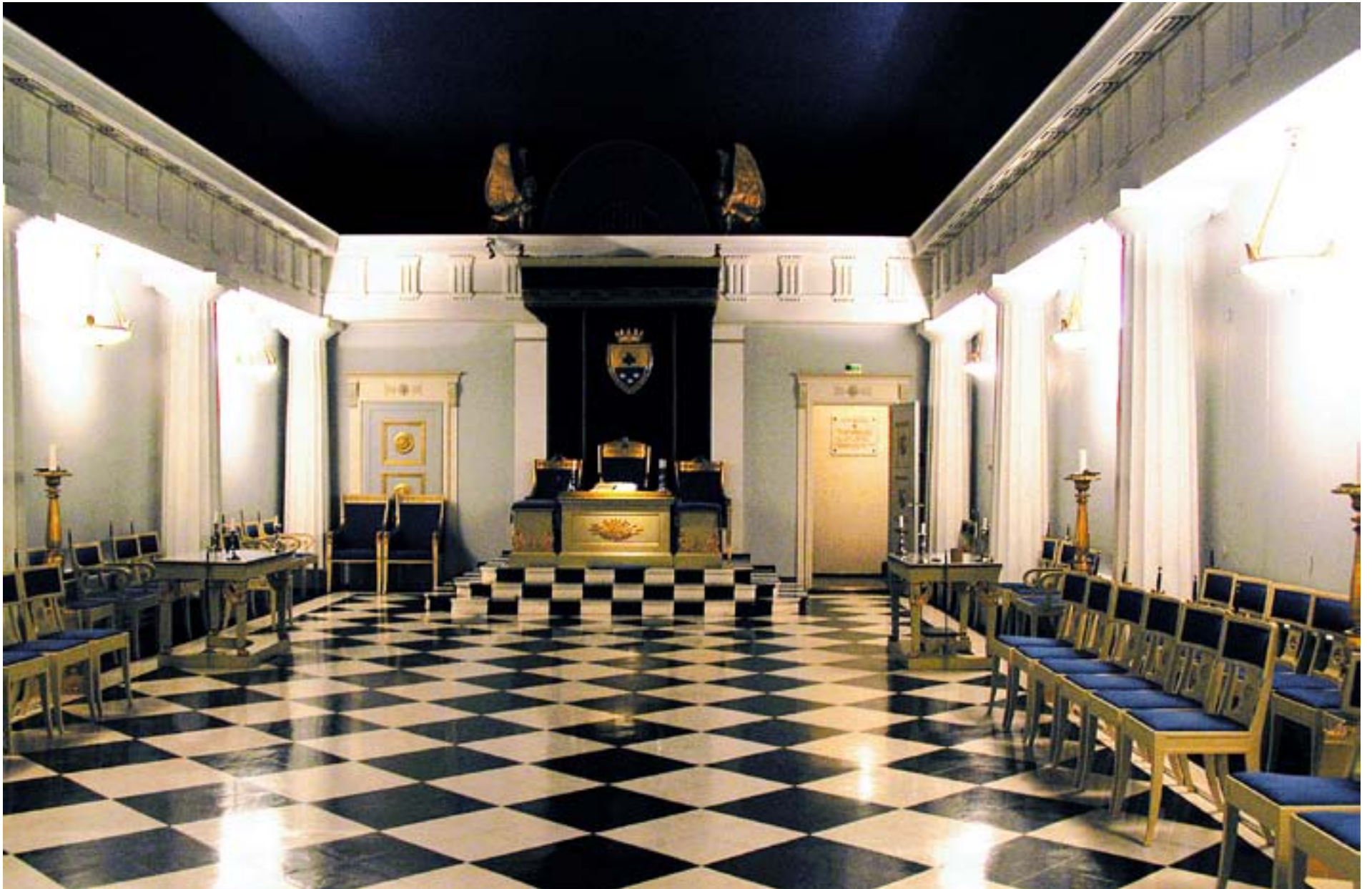
JOHANNESALEN I ordenshuset vid Nylandsgränd är Helsingforsfrimurarnas festsal. I dag, torsdag, delar frimurarna ut ett antal stipendier för medicinsk forskning i den här salen.