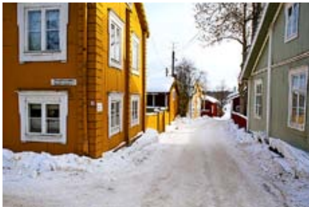
DET FINNS fortfarande många trähus kvar i Lovisa gamla stadsdel.