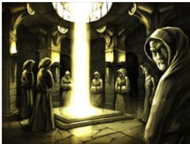
KONSPIRATIONSTEORIER OM hemliga sällskap blandar fakta och fiktion med frimurarsymbolik.

– Gjordes det inte redan på 30-talet förslag i den finska kyrkan om att präster inte skulle få vara frimurare? frågar Önerfors.