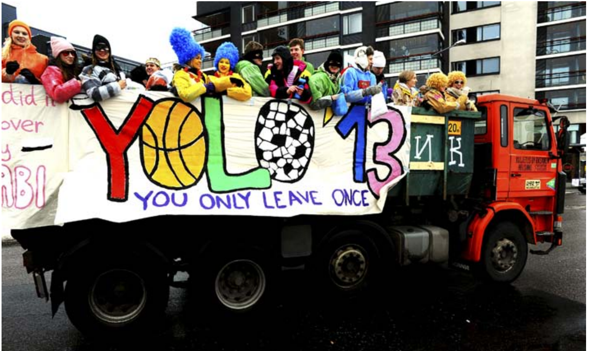
Hur får man in fyra biskopar i en flat? Man tar av dem mittrorna.

BÄNKSKUDDARDAGEN ELLER penkis är den avslutande festen för abiturienterna innan studentexamen kör igång på allvar.