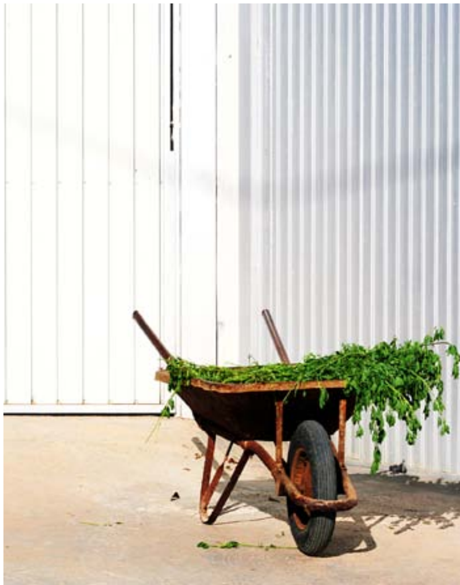
PRAKTISKT TRÄDGÅRDSARBETE på begravningsplatserna lockar många sökande.

Förutom arbetare på begravningsplatser är sommarteoologer, sommarkantorer, hjälpledare och sommarungdomsarbetare andra