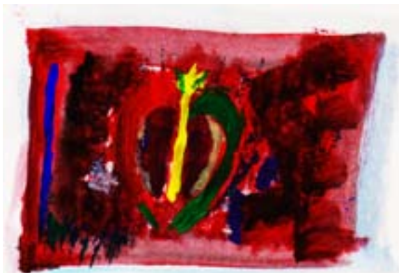
ILLUSTRATION: CLAUS TERLINDEN