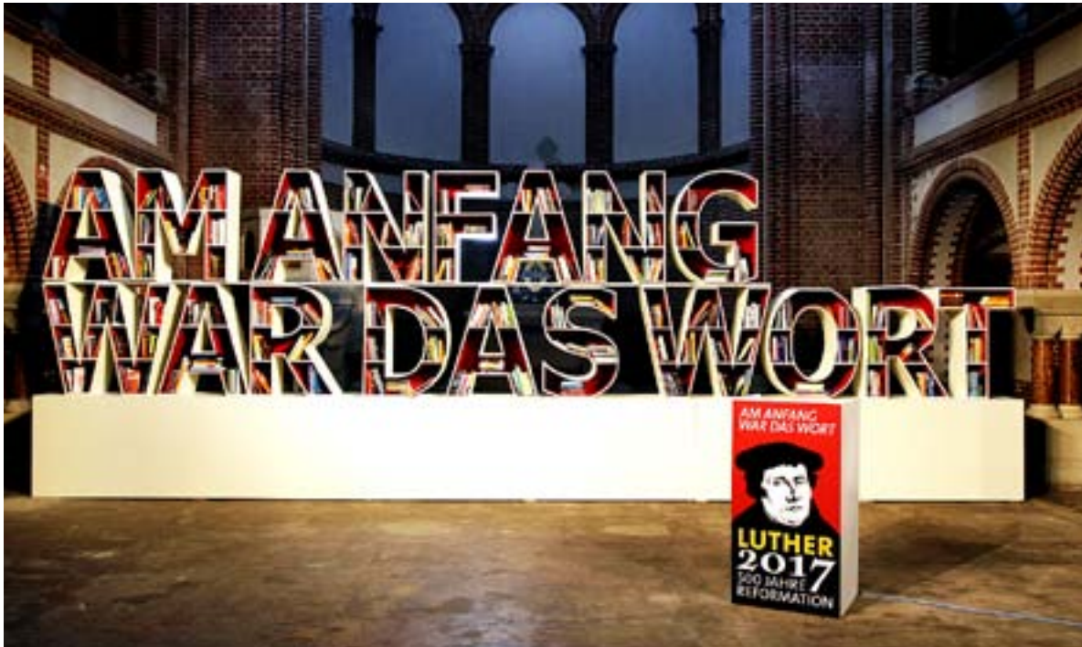
”I BEGYNNELSEN FANNS ORDET” – det är mottot för Lutherårtiondet i Tyskland. De här bokhyllorna med 500 böcker kring temat har placerats på olika orter över hela landet.