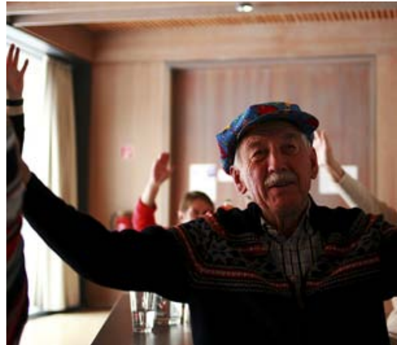
DANS I SITTANDE ställning står på programmet under en ekumenisk seniorträff.