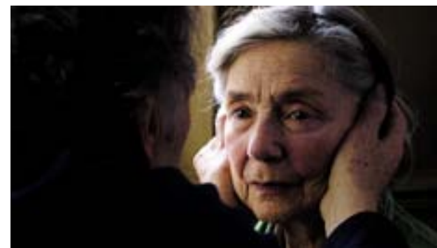
FILMEN AMOUR kan med fördel ses som ett inlägg i debatten om åldringsvården.

minner alla våra tre skivor om varandra. De är melodiska och gitarrdrivna. Det finns både lugnare och rockigare bidrag.