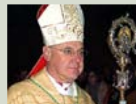
ÄRKEBISKOP GERHARD Ludwig Müller.