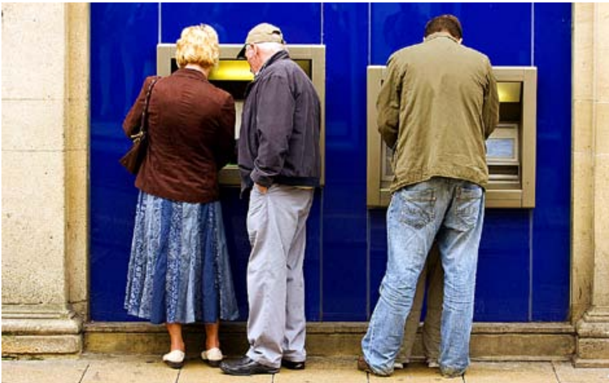
EN BANKAUTOMAT är en billig lösning för bankerna och de flesta bankkunder. Men i takt med att allt fler ärenden flyttas till nätet marginaliseras allt flere personer, främst äldre. Digitaliseringen kan hota deras mänskliga rättigheter.