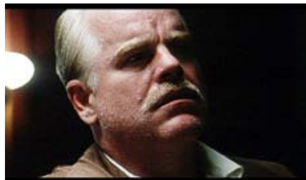
PHILIP SEYMOUR Hoffman gör en strålande insats som den karismatiska sektledaren Lancaster Dodd.

The Master visas på filmfestivalen EXIST i Kristinestad 8–10 februari.