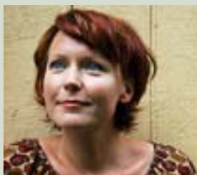
JENNI HAUKIO.