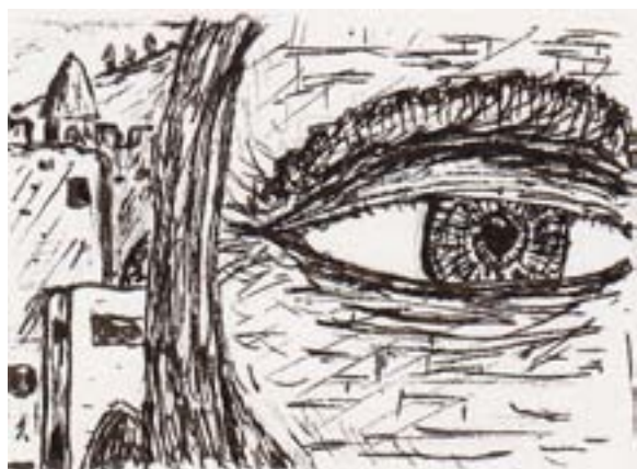
ILLUSTRATION: CLAUS TERLINDEN