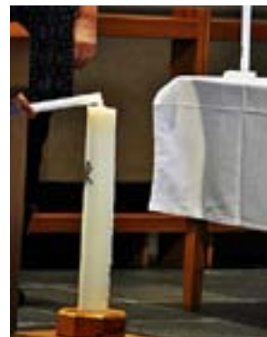
ETT DOPLJUS tänds från Kristusljuset.

I år skickade Vasa svenska församling ut 149 inbjudningar till barn som döpts år 2012. Vi inbjöd till två babykyrkor – en i Trefaldighetskyrkan den 20 januari och en i Sundom kyrka den 3 februari. Man kan själv välja vilket datum, tid och plats som bäst passar familjen. Babyn får gärna ta med sin egen skullra som rytminstrument till sångerna, men det som är ännu viktigare att komma ihåg är dopljuset. Under Babykyrkan tänds barnets dopljus från det stora Kristusljuset av antingen förälder, fadder, syskon eller far- och morförälder. Sedan brinner alla barns dopljus framme i kyrkan under fortsättningen av gudstjänsten som en påminnelse om