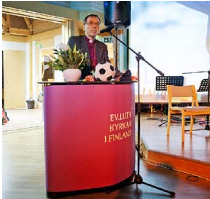
BISKOP BJÖRN Vikström höll några andakter.