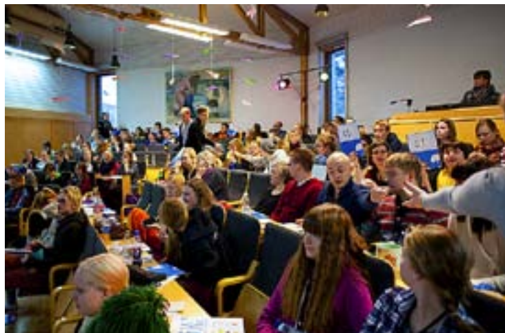
RUNT 160 ungdomar från Borgå stift deltog på UK.