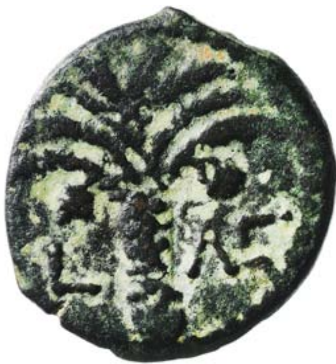
BRONSMYNT SLAGET för prokurator Coponius, 6 f.Kr. – 66 e.Kr. (Kgl Myntkabinettet)