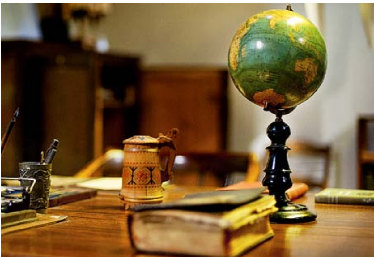
UNGEFÄR SÅ här såg den legendariska Namibiamissionären Martti Rautanens arbetsrum ut då han arbetade bland Ovambofolket i norra Namibia i slutet av 1800-talet.