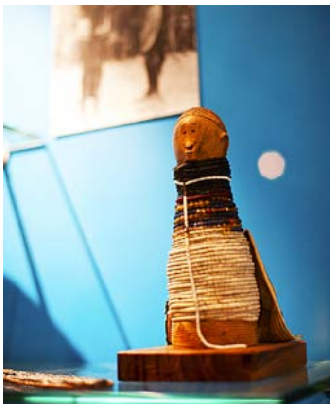
EN SÅDAN docka fick kvinnorna i norra Namibia av män som ville ha dem som hustrur.