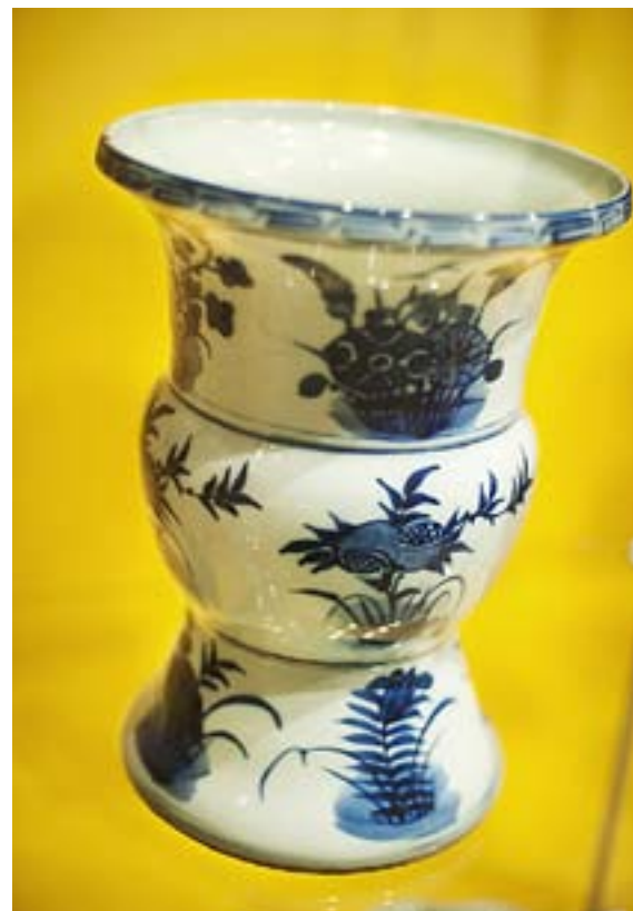
DYRBAR GÅVA: vas från Ming-dynastin.