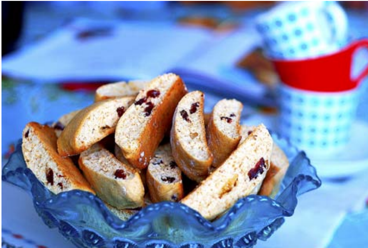
SKORPOR TILL kaffet kan man göra själv genom att torka gamla bullar.