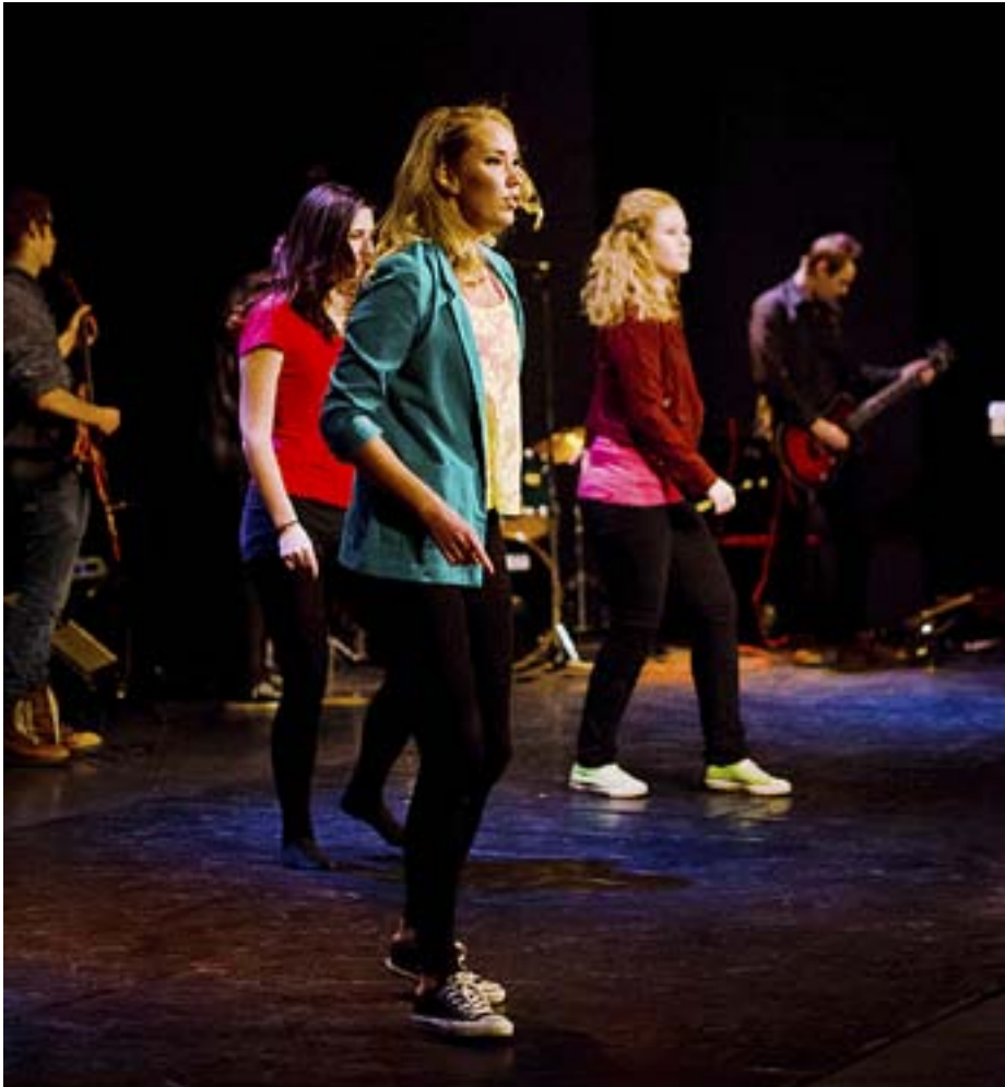
ELEVER FRÅN Katedralskolan i Åbo uppträder med dans och musik.