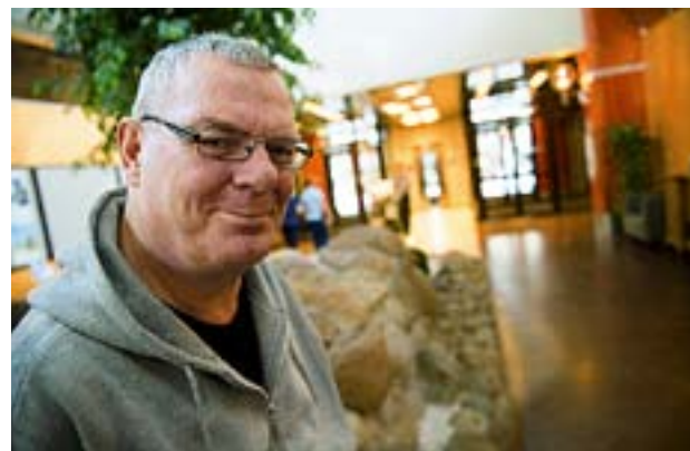
I SIN färsk bok skriver Göran Skytte om sitt liv före och efter en livshotande stroke.