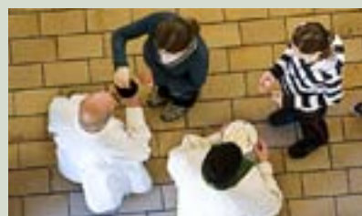
NATTVARDSGEMENSKAP MED katoliker diskuteras.

det finns lutheraner som hoppas på nattvardsgemenskap med Rom och att den katolska kyrkan borde vara redo att välkomna dem. Dessa lutheraner kunde bevara de ”rättmätiga traditioner de utvecklat” och samtidigt bli medlemmar av den katolska kyrkan. Biskopen påpekar också att