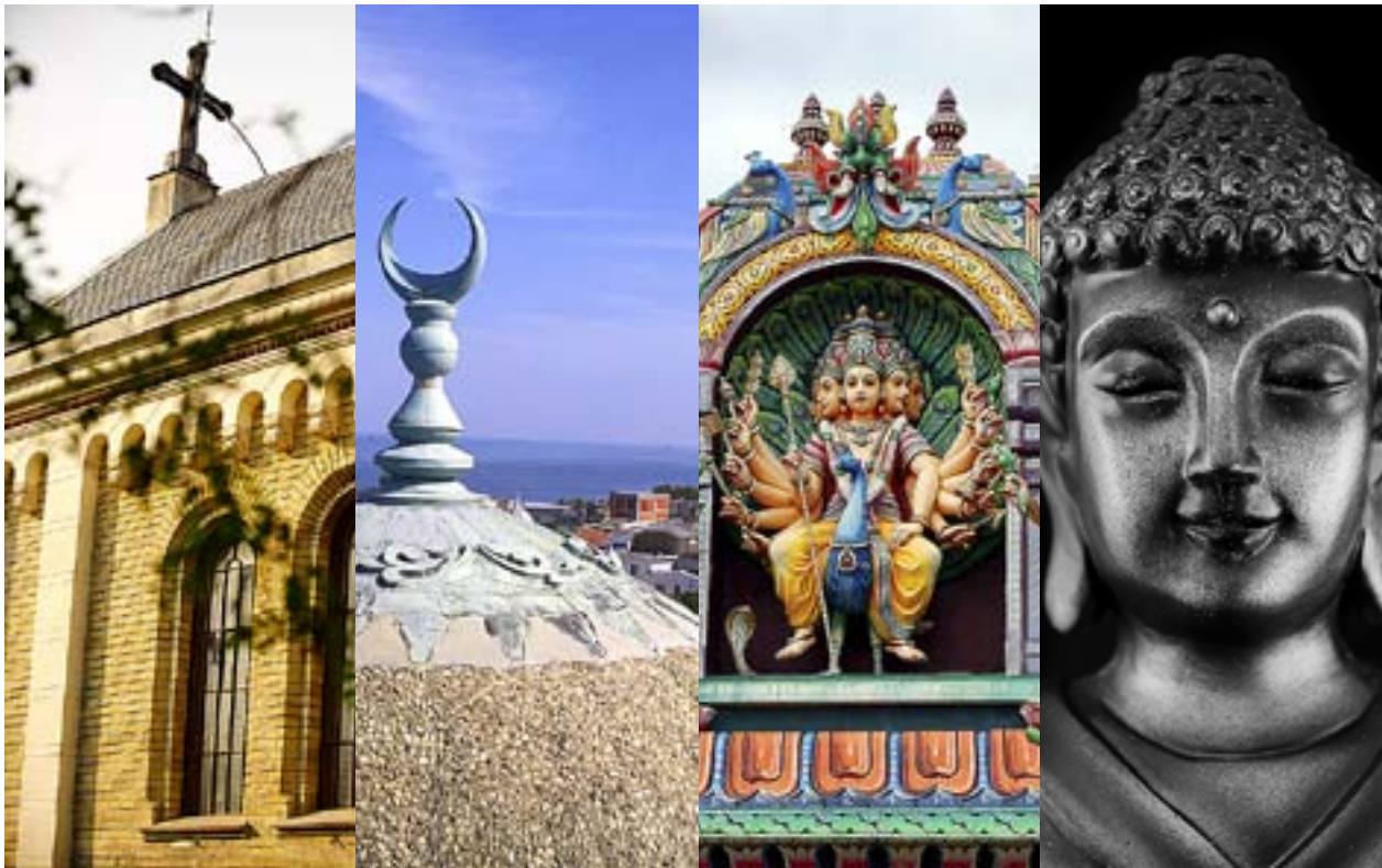
KRISTENDOM, ISLAM, hinduism och buddhism är de fyra största religionerna i världen. De religionslösa är fler till antalet än buddisterna.