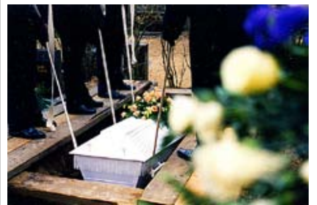
AVGIFTERNA FÖR begravningskostnader borde täcka 20–25 procent av de totala kostnaderna, menar Kyrkostyrelsen.

– Men de ekonomiska utmaningarna skiljer inte så mycket mellan små och stora församlingar. Samma problem kämpar vi alla med.