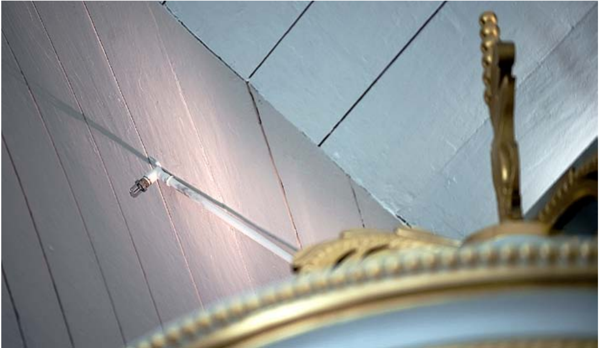
SPRINKLERSYSTEM I gamla kyrkor innebär att man på vissa ställen tvingas dra vattenledningarna på putsen. I Malax kyrka installerades sprinklers 2010.