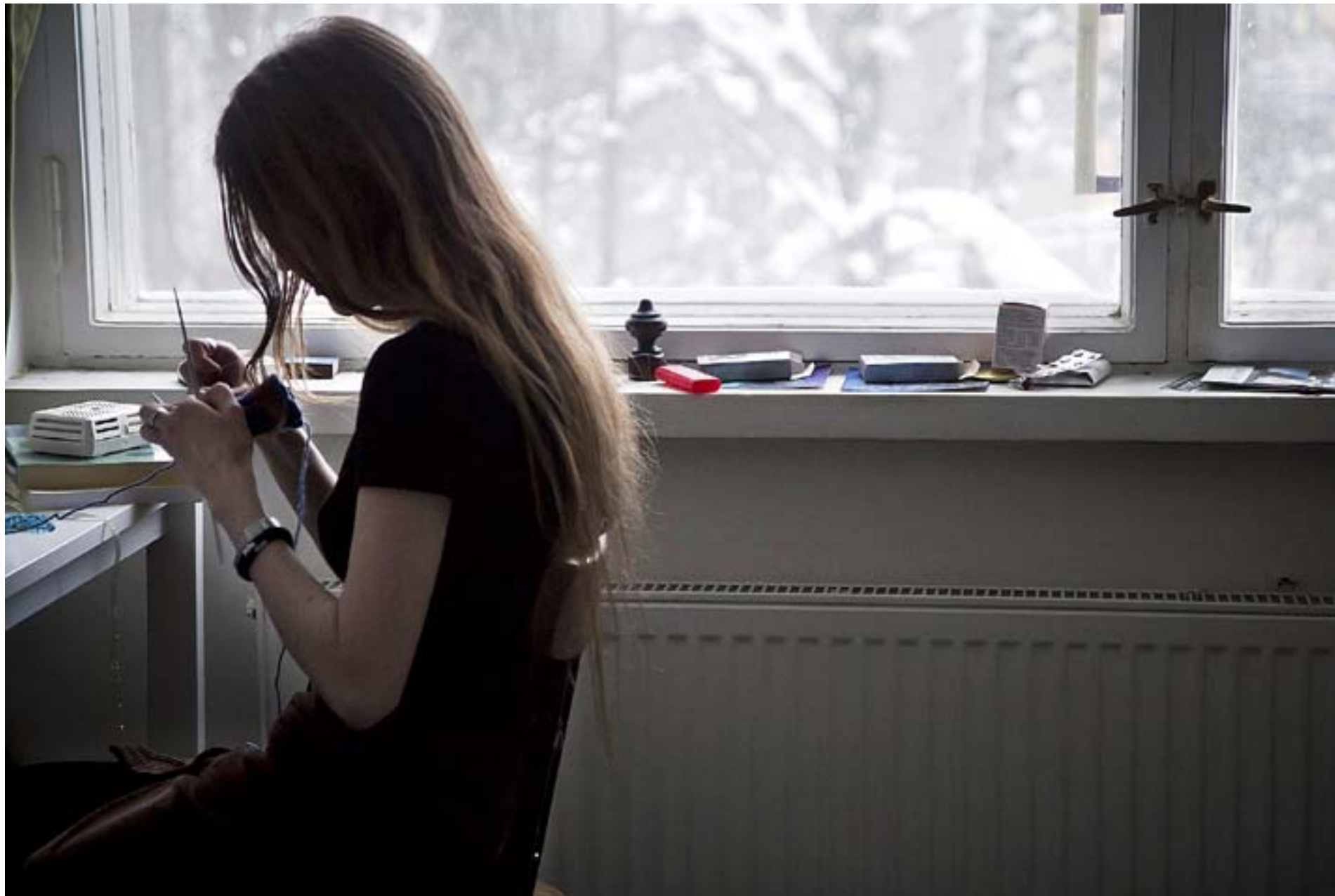
SYSSLOLÖSHETEN OCH ensamheten breder ut sig allt mer bland dagens unga.

UTSLAGENHET. Många ungdomar är ensamma och har psykiska problem. Utslagenheten har många ansikten. Arbetslöshet, social inkompetens och depression.