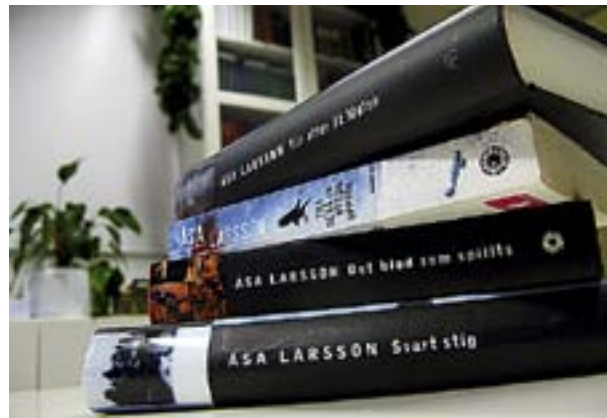
EN SJÄTTE och sista bok i serien med Rebecka Martinsson i huvudrollen har utlovats av författaren.

Händelserna i Åsa Larssons böcker utspelar sig i huvudsak i Kiruna som