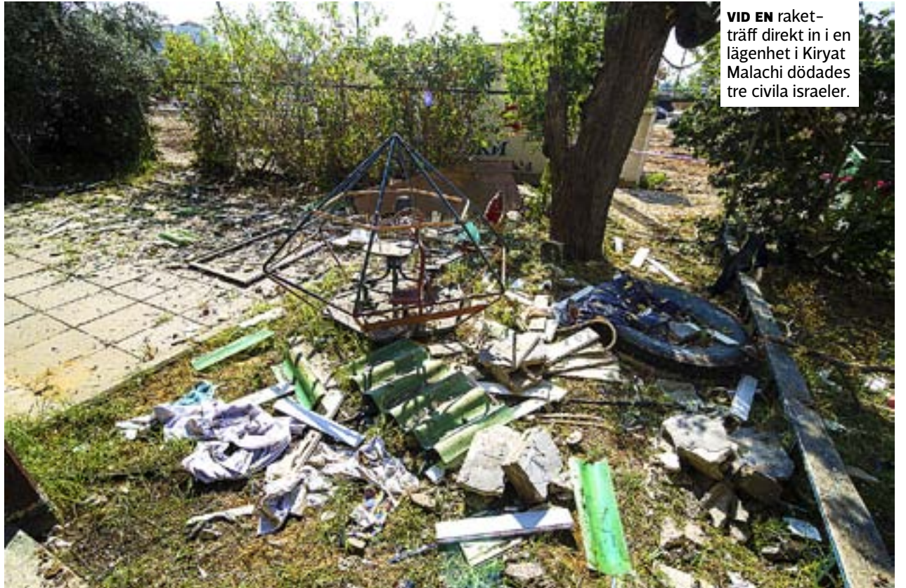
VID EN raketträff direkt in i en lägenhet i Kiryat Malachi dödades tre civila israeler.