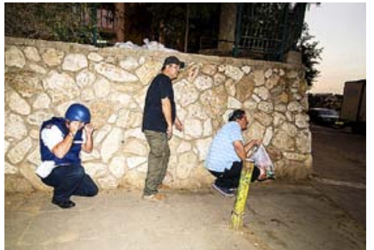
Staden Sderot under en av de många raketattacker.

timme, även nattetid. Till en början försökte vi få våra barn att tro att det var en lek. Vi tävlade om att komma in i skyddsrummet så fort som möjligt och väl där sjöng vi och lekte tillsammans.