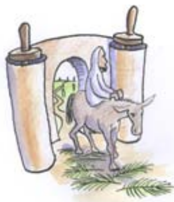
ILLUSTRATION: RABBE TIAINEN