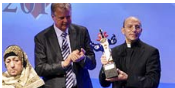
PRISBELÖNTA RAHEB ser det palestinska folket som konfliktens största förlorare.

– En del prisade Hamas seger över Israel, andra sade