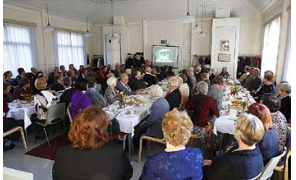
MÅNGA SAMLADES till fest i Norra Paipis bykyrka för att fira 90-årsringen med en historik.