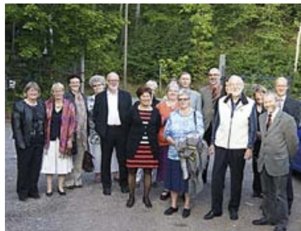
DELTAGARNA SAMLADE till gruppfoto.