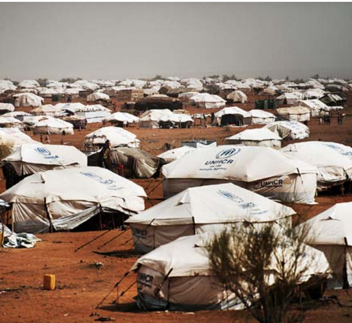
FLYKINGLÄGRET MBERE i sydöstra Mauretanien nära gränsen till Mali. På några månader har en tältstad vuxit fram mitt i öknen.