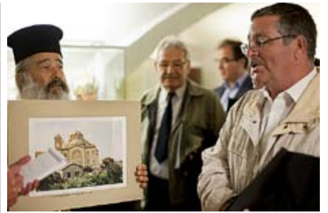
ANDRA SIDAN Den delade ön Cypern är resultatet av en av världens längsta frysta konflikter. Kyrkoförslaget på den turkiskokuperade norra delen är en annan följd.

Ett resultat av projektet är att två nya grupper för stöd i kris har grundats i Lappo stift och att mängden utbildning har ökat. De kyrkligt anställda som jobbar med studerande har fått en viktigare roll.