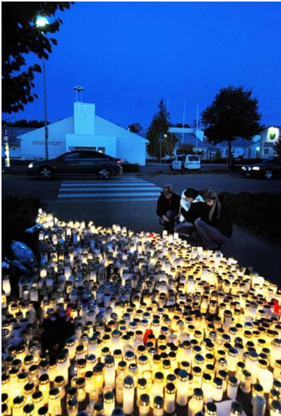
Den 23 september har det gått fyra år sedan skolskjutningarna i Kauhajoki. Kyrkans rapport om sitt Kauhajoki-projekt finns nu på svenska.