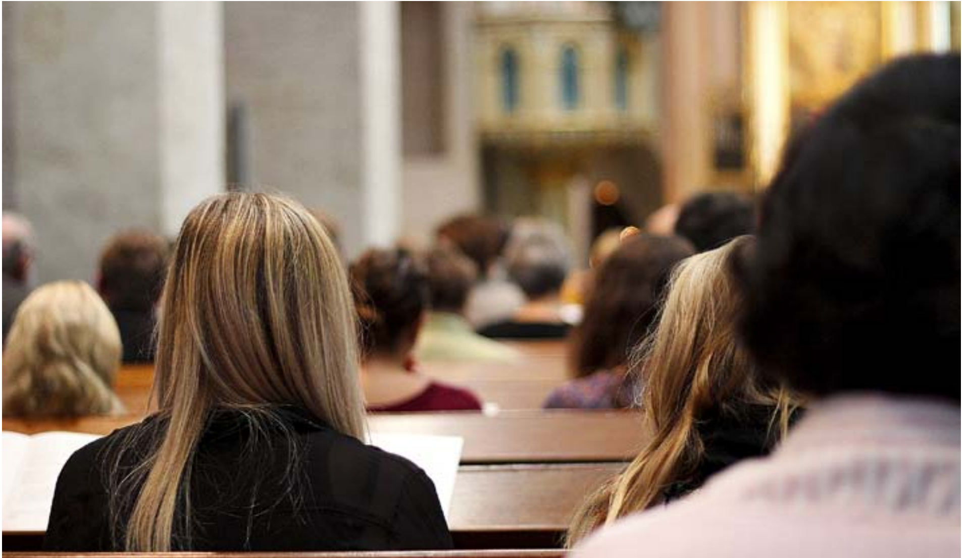
INSKRPTION MED gudstjänst leder till exkludering av dem som inte är troende lutheraner, hävdas i ett debattinlägg.