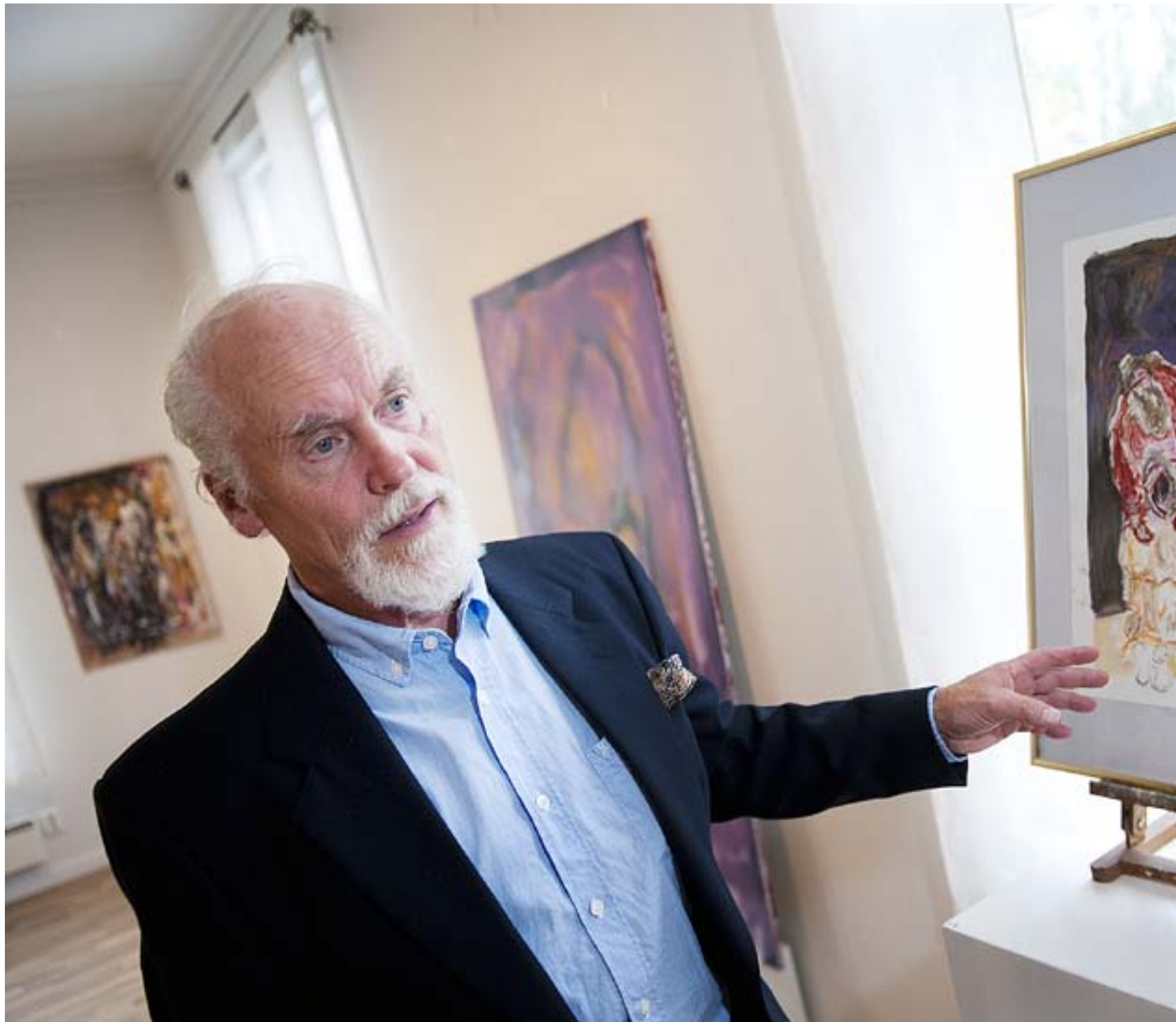
DEN FÖRLORADE sonen och Rembrandts tavla om sonens hemkomst är en av de berättelser som inspirerat Håkan Ahlnäs i utställningen Livet som pågår under september.