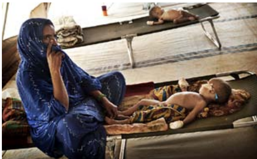
I TÄLTEN i flyktinglägret Mberé vakar mödrar över sina fågelungar till barn med slangar genom näsan, groteskt grova i förhållande till deras små kroppar.