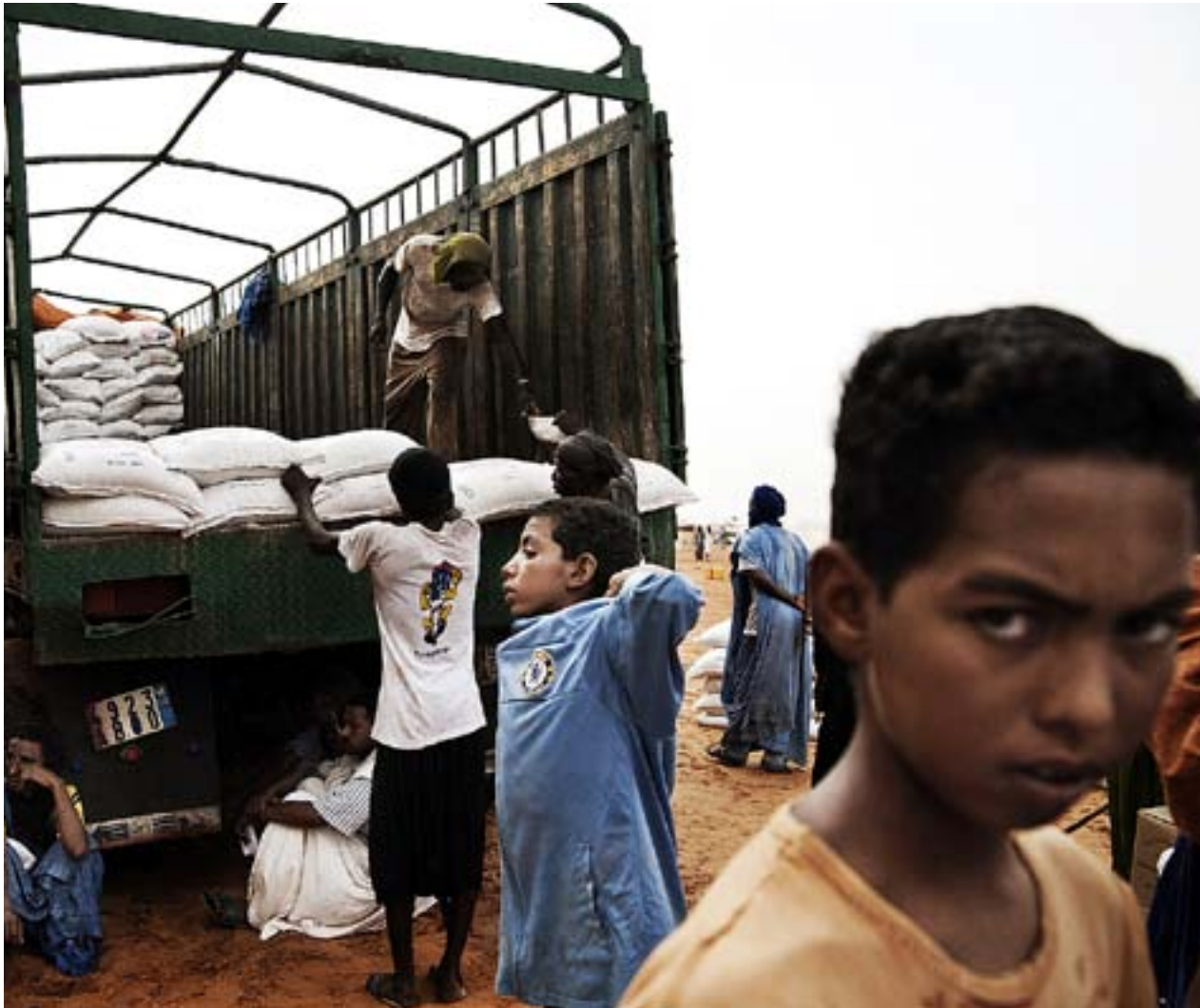
OM DET kommer fler till flyktinglägret Mbere kommer maten att ta slut.