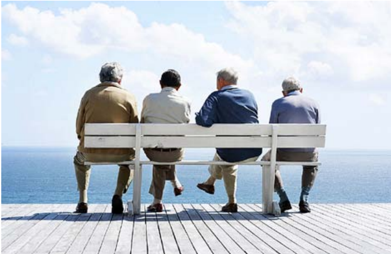
MÄN EMELLAN. Det är viktigt med grupper där män kan träffa andra män och samtala i lugn och ro.