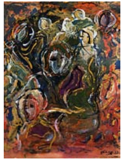
DE FÖRDRIVNA. Ständigt aktuellt