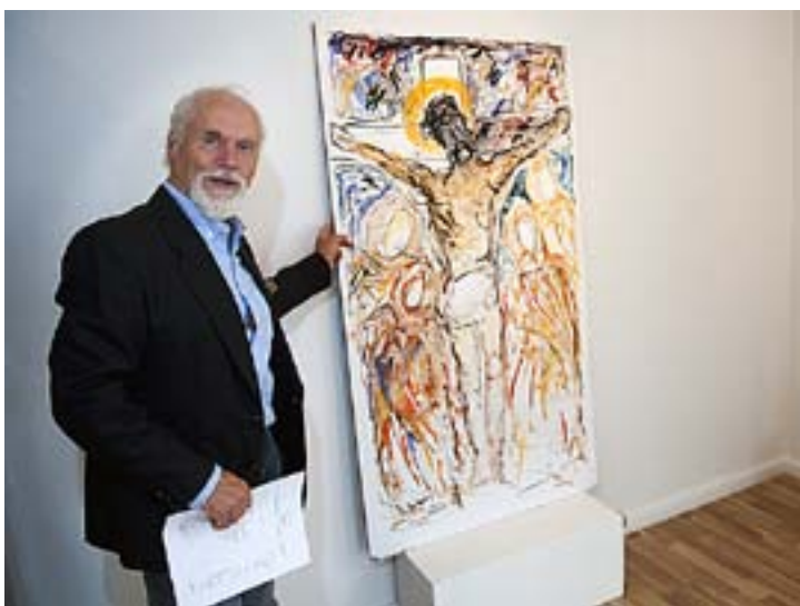
KOSTFÄSTELSEN ÄR en central berättelse som återkommer.