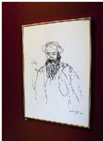
JAG HAR något att säga dig.