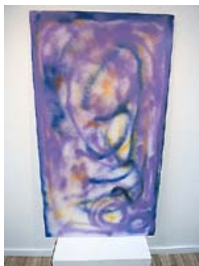
GUD SKAPAR människan.

– Nog ser jag en Guds ledning i mitt liv. Jag har fått leva ett liv jag trivts med och som jag fått njuta av.