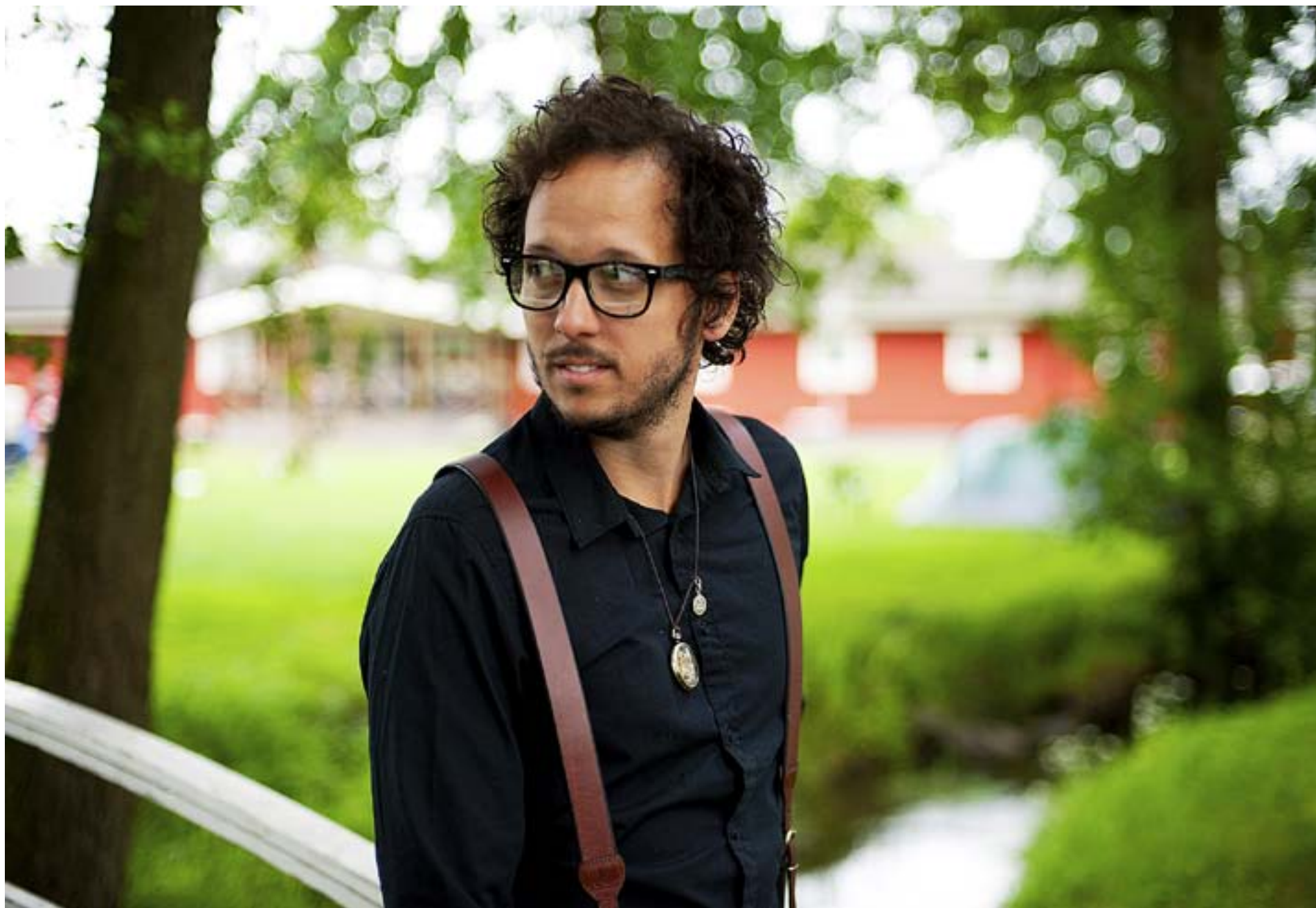
MICHAEL GUNGOR är aktuell med skivan A Creation Liturgy och boken The Crowd, The Critic and The Muse som publicerades i måndags.

KREATIVITET. Michael Gungor försöker att inte lyssna till musikindustrins önskemål när han skapar. Paradoxalt nog var det då han gjorde det hans band fick bäst kritik och blev populärt.