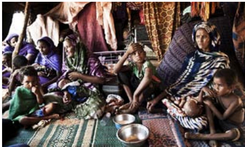
I MELLA Mint Mohameds kvarter i flyktinglägret har flera tillverkat sina egna tält.