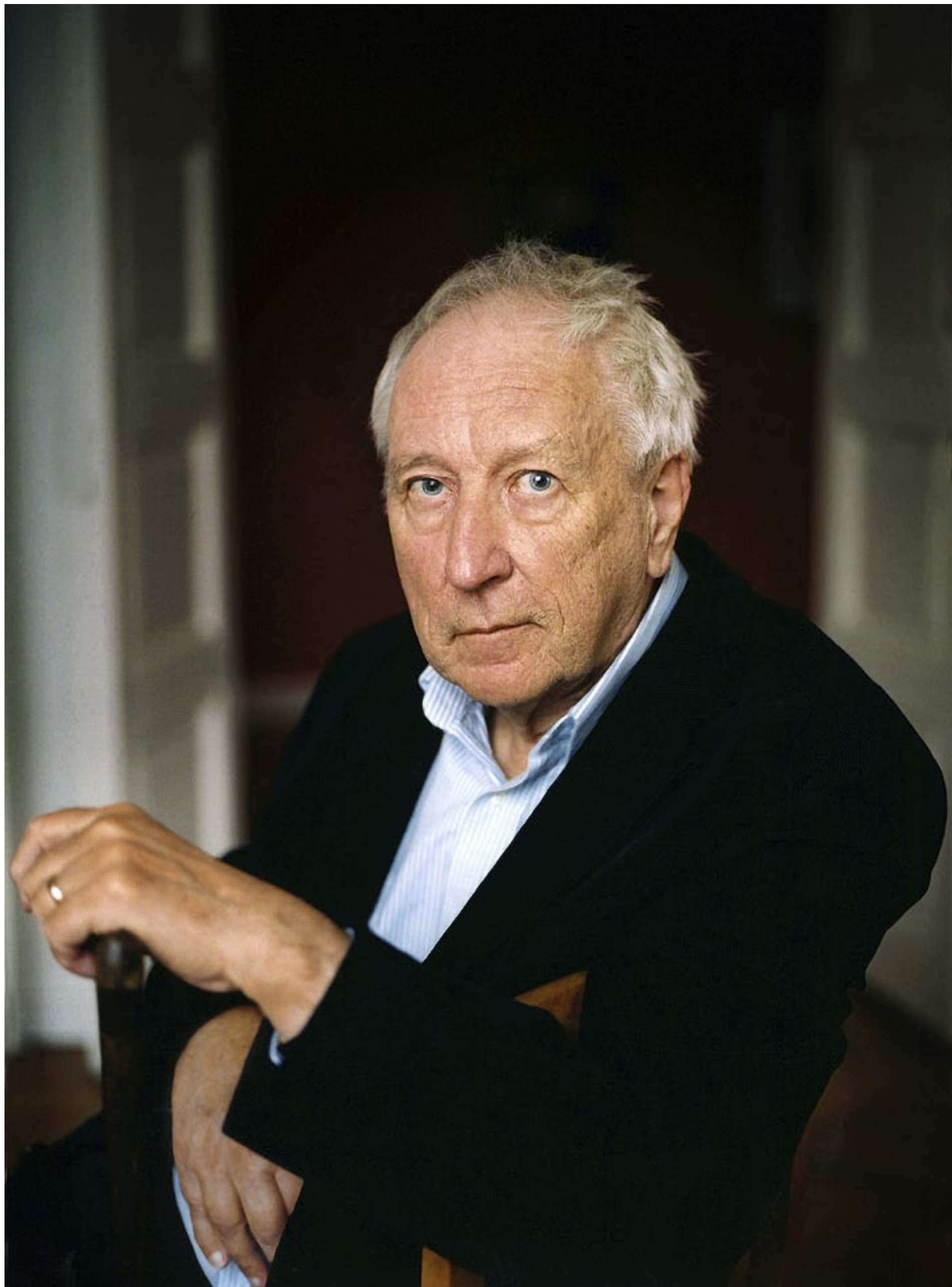
TRANSTRÖMER HAR bekräftat det läsaren kan se, att syftet med hans diktning är, ”att gestalta det andliga livet, att uppdaga mysteriet”.