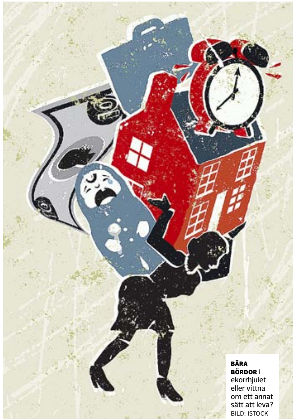
BÄRA BÖRDOR i ekorrhjulet eller vittna om ett annat sätt att leva?

Tolonen säger att kristen tro i modern tid ofta uppfattas som en privatsak, något som pågår inne i ens huvud. Tron har blivit något som vi intellektualiserar och verbaliserar.