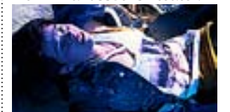
TONÅRSTJEJEN SANDRA (Susanne Marins) testar amfetamin och blir påkörd av en bil.

Hangö teaterträff. Priset vill lyfta fram konstnärligt mod inom finlandssvensk teater.