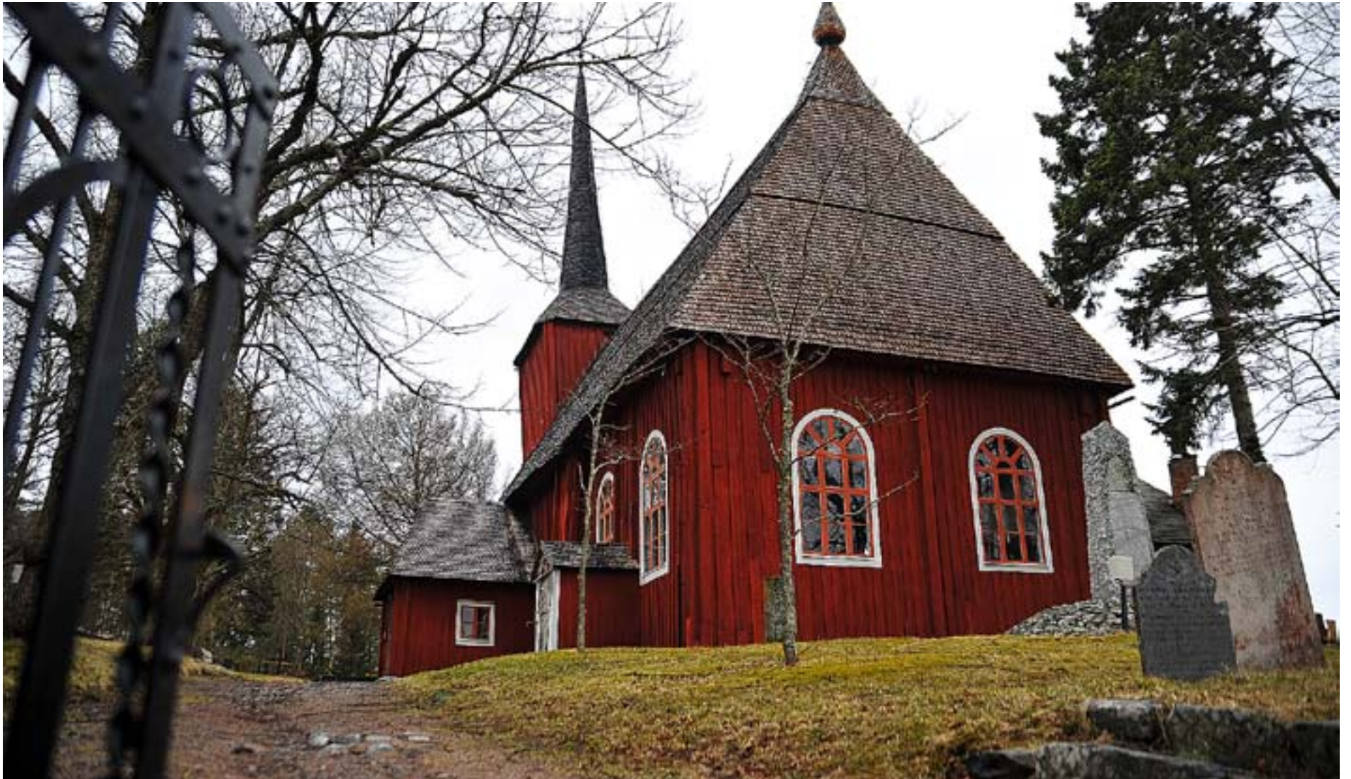
ULRICA ELEONORA kyrka i Kristinestad blir för dyr för samfälligheten att underhålla. Nu ska en arbetsgrupp försöka skaffa hjälp utifrån.