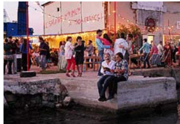
SNÖN PÅ Kilimanjaro inleds i Marseilles hamnkvarter där fackförbundets ordförande drar lott om vem som ska sägas upp.