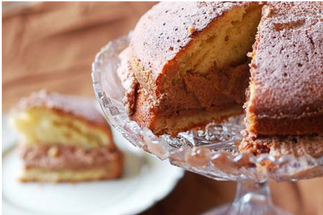
GAMMALDAGS SOCKERKAKA smakar bra till kyrkkaffet. Genom att ge kakan en fyllning blir bakverket extra festligt.