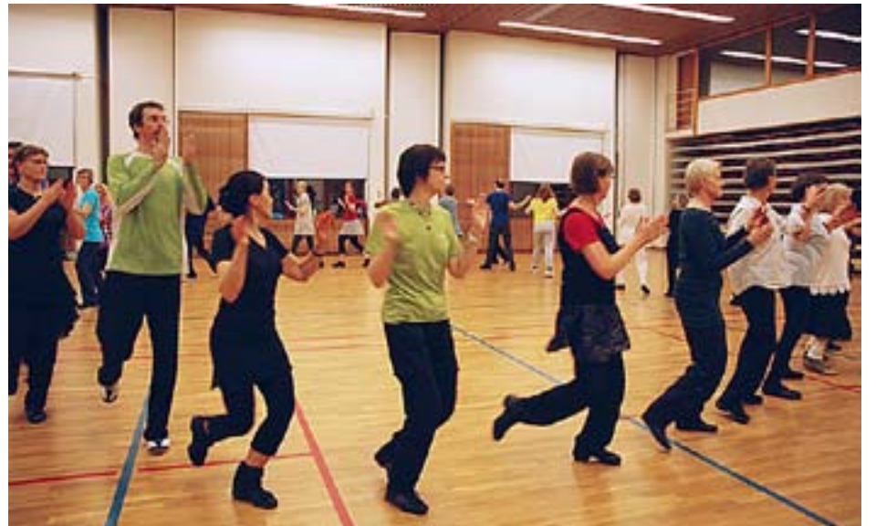
INGÅDANSARNA DELTOG i januari i en tre dagar lång kurs med deltagare från hela landet.

Folkdanserna är fortfarande enormt populära i Israel och populariteten bara ökar också utanför landet. Också i Finland har det de senaste åren uppkommit flera nya grupper som regelbundet dansar israelisk folkdans och vi har ett gott samarbete