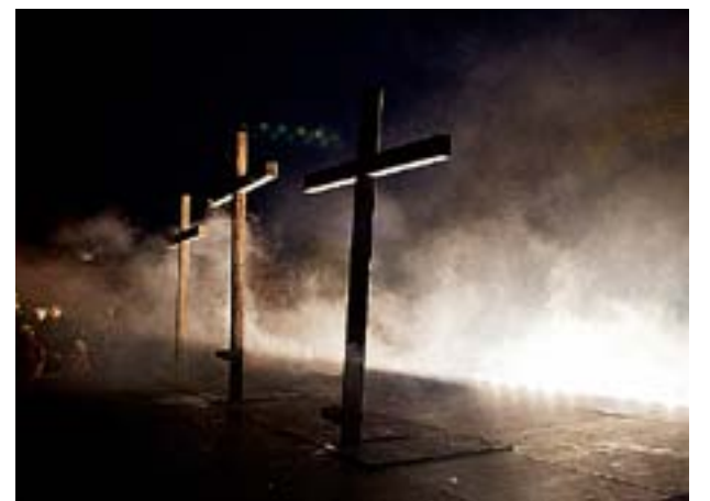
TOMMA KORS på kyrkbacken vid Borgå domkyrka i Via Crucis slutvinjett.