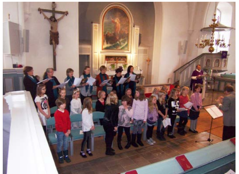
MÄSSAN ”BARN i Guds tid” framfördes i Jomala kyrka under ledning av Kaj-Gustav Sandholm.

Barnens sångglädje smittade av sig på alla som satt i bänkarna och på oss som