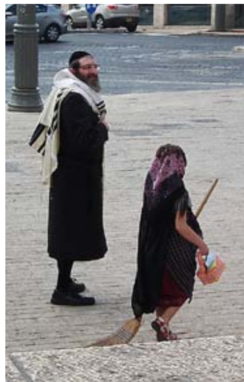
FINLANDSSVENSK PÅSKHÄXA möter en hassidisk jude.

För det vill vi ju. I fjol var stilla veckan och påsken härlig och jag hoppas