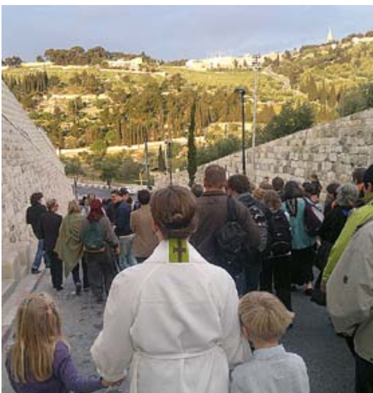
SKÄRTORSDAGENS LUTHERSKA procession från Gamla stan till Getsemane-trädgården vid foten av Oljeberget.