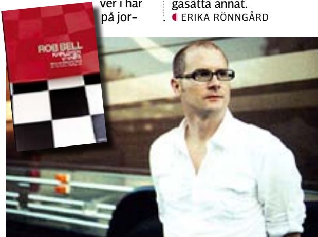
ROB BELL är grundare av Mars Hill Bible Church i Grand Rapids. Kärleken vinner är hans tredje bok på svenska.