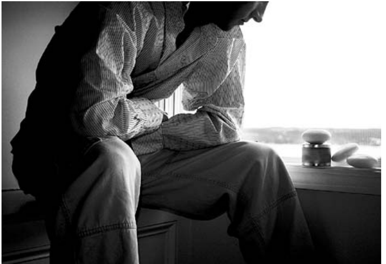
ATT BLI vräkt från sin bostad på en liten ort kan göra det nästan omöjligt att få ett nytt hyreskontrakt.

I går kväll samlades församlingsmedlemmar, förtroendevalda och medarbetare i församlingarna i Lillkyro och Vasa i Lillkyro kyrka för att bli informerade om och diskutera styrgruppens förslag.