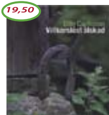
Olle Carlsson: Villkorlös älskad