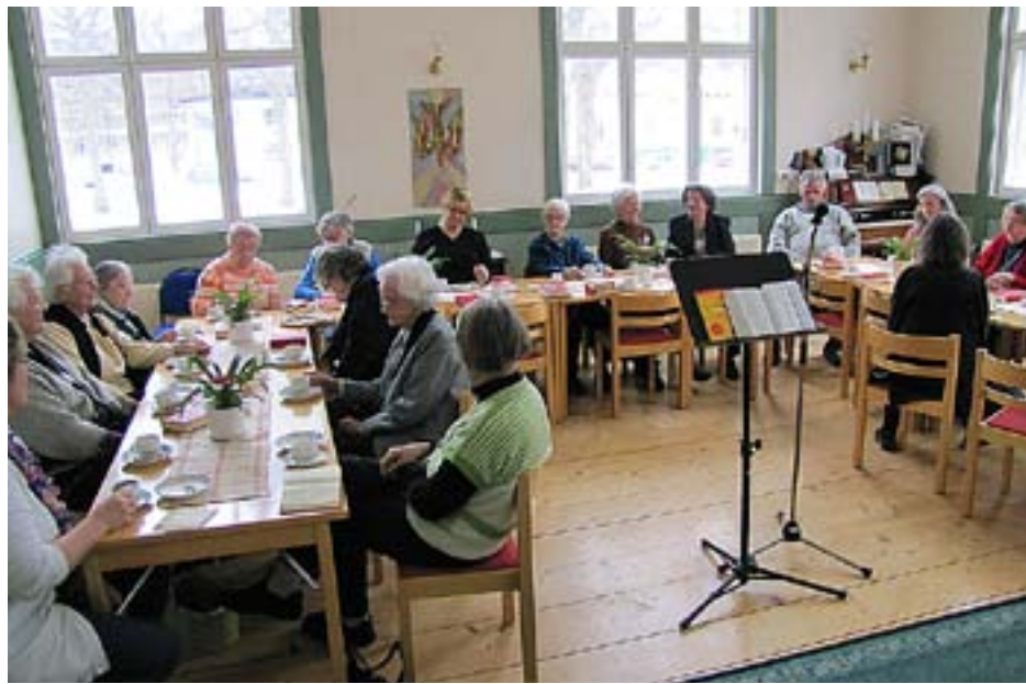
EKUMENISK GEMENSKAP kring kaffebordet i Missionskyrkan i Mariehamn.

2 rum+k, 44m² på Köpmansgatan i Åbo uthyres Tel. 050-1490, mail christoffer@moisk.com