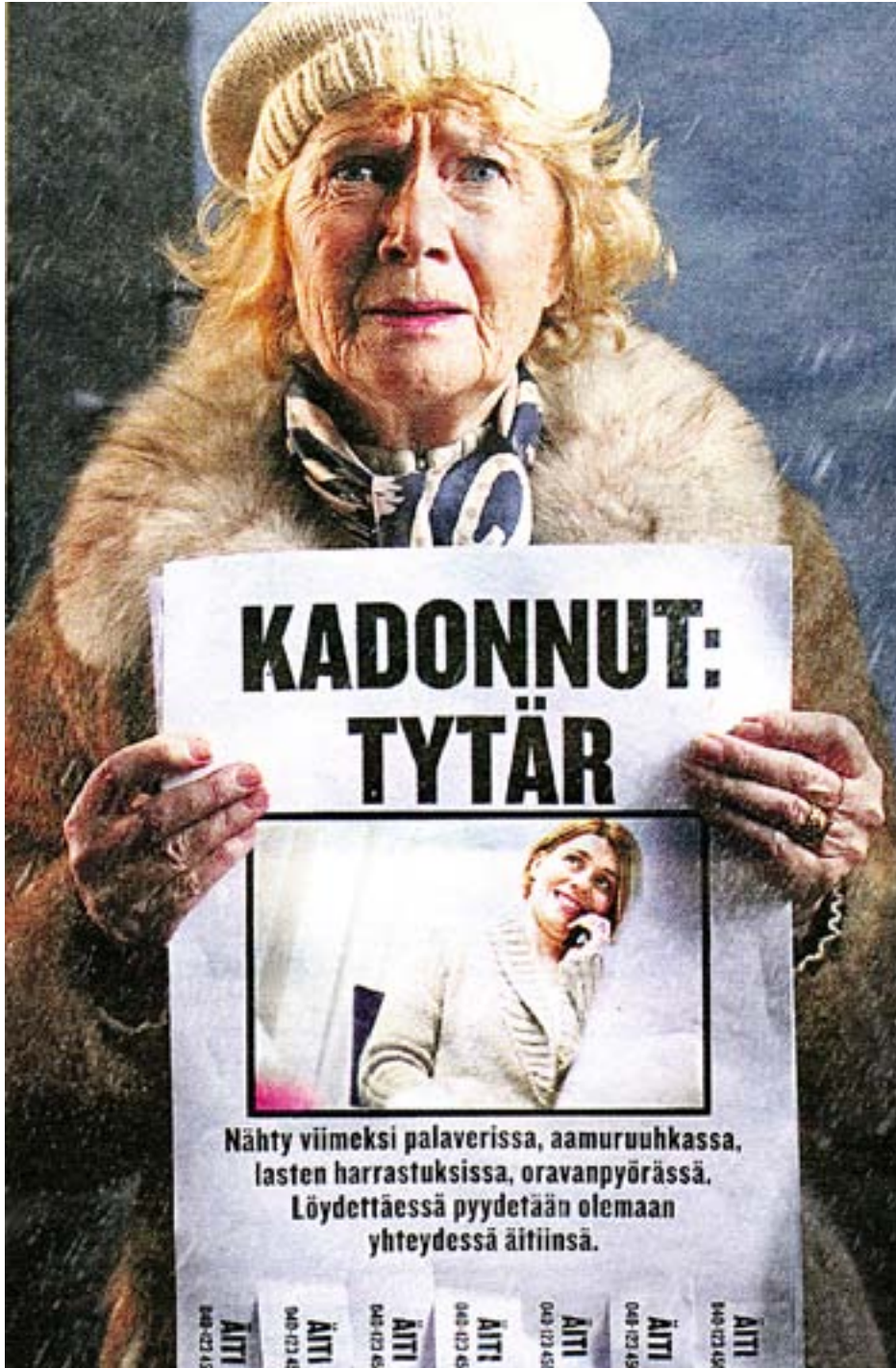
HELSINGFORSMISSIONS KAMPANJANNONS för besökstjänsten organisationen erbjuder tävlar som bäst i Helsingin Sanomats tävling ”Årets bästa annons”.

Det som är viktigt är den mänskliga närvaron. Att