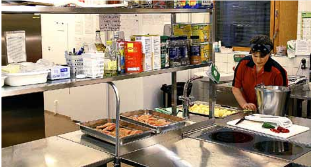
Män kan ha kvinnliga chefer och religion är en privatsak fast man jobbar inom kyrkan, exemplifierar handledningen för kyrkan som mångkulturell arbetsgivare. (Personen på bilden har inget med innehållet i artikeln att göra.)