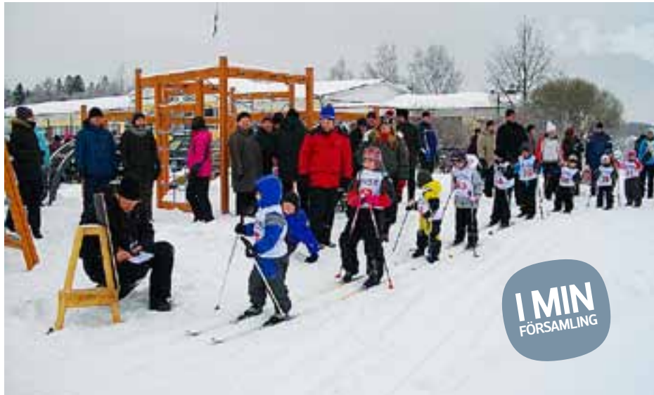
MÅNGA DELTOG i karamellskidningen där alla vann första priset

Evenemanget var välbesökt, (ca 200 personer), och vädrets makter stod på arrangörernas sida. Man kunde t.ex. åka brandbil och bekanta sig med brandkårens utrustning, åka pulka dragen av en fyrhjuling, åka hundspann dragna av härliga hundar från Borgå Bruks-hundar r.f., delta i karamellskidning i klasserna