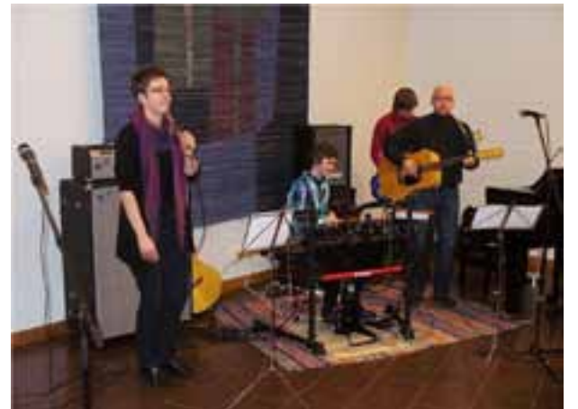
FAMILJEN BÖCKELMAN från Sundom bidrog med musik under K-mötet.