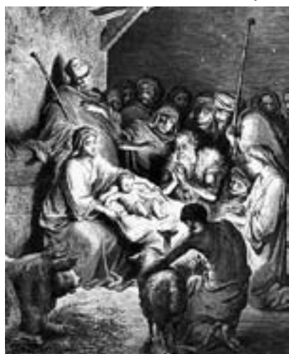
DEN FUNNA målningen är en kopia av Gustave Dorés Bibelillustration.