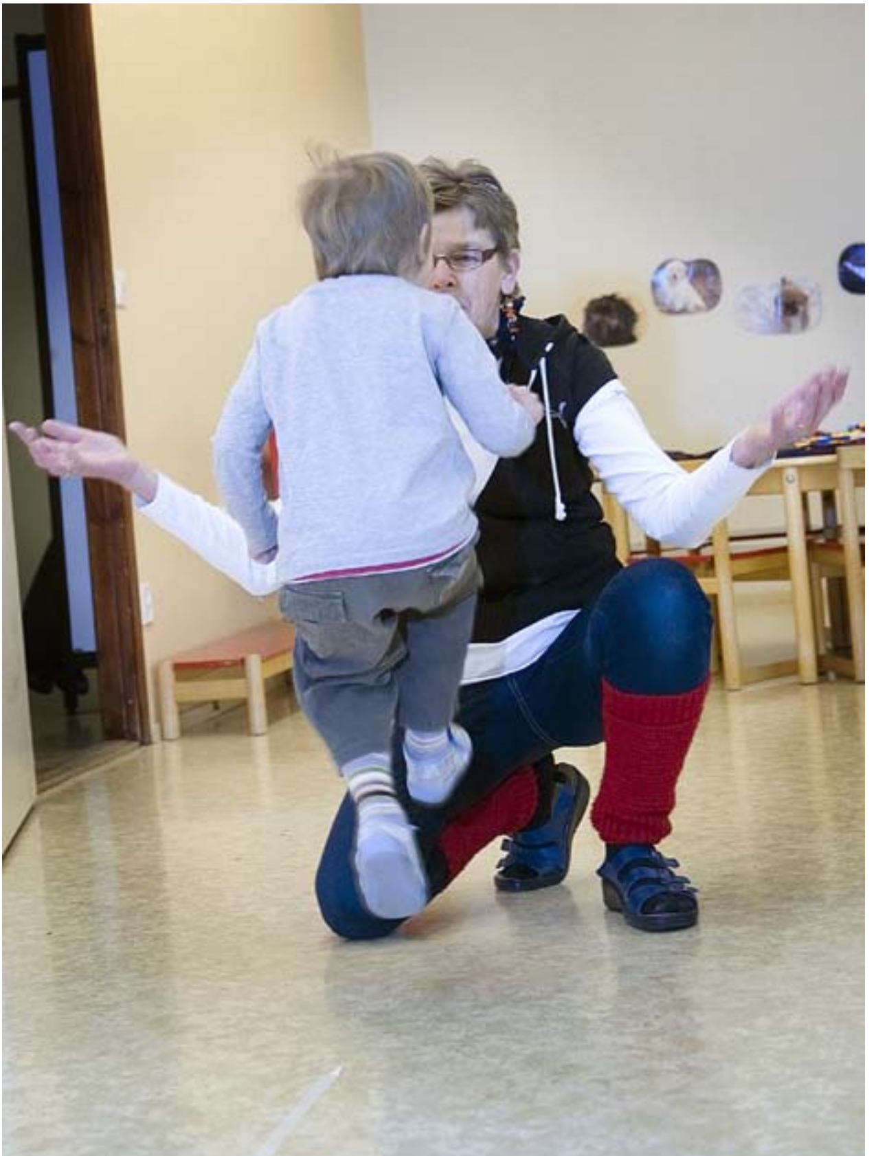
FÖRSAMLINGENS KLUBBSLEDARE i Pedersöre har utfört femårsgranskningen KEHU på barnen. Med den nya granskningsmetoden LENE är samarbetet mellan barnrådgivningen och församlingen ännu öppet.

Pedersöre församling har fyra anställda barnledare som jobbar parvis med fem dagklubbar. En dagklubb har tio till 18 barn per grupp och den samlas under tre timmar två gånger i veckan. Större delen