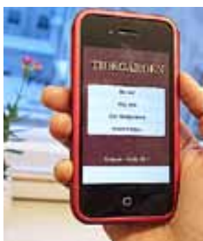
"FROMCOOLA" TIDEGÅRDEN kan laddas ner gratis.

Appen bygger på boken Tidegården – Kyrkans dagliga bön (Arcus förlag 1995). Sammanlagt finns det 119