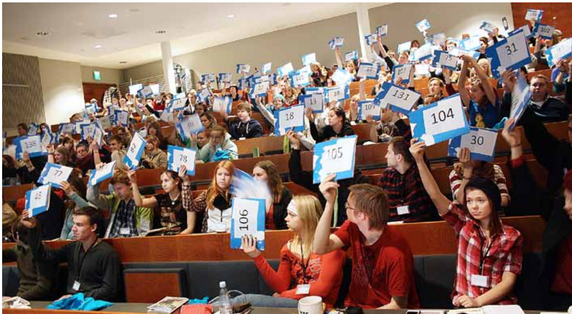
KYRKANS UNGDOMSPARLAMENT Ungdomens kyrkodagar (UK) samlades i helgen på Vasa universitet där också de finlandssvenska kyrkodagarna arrangerades.