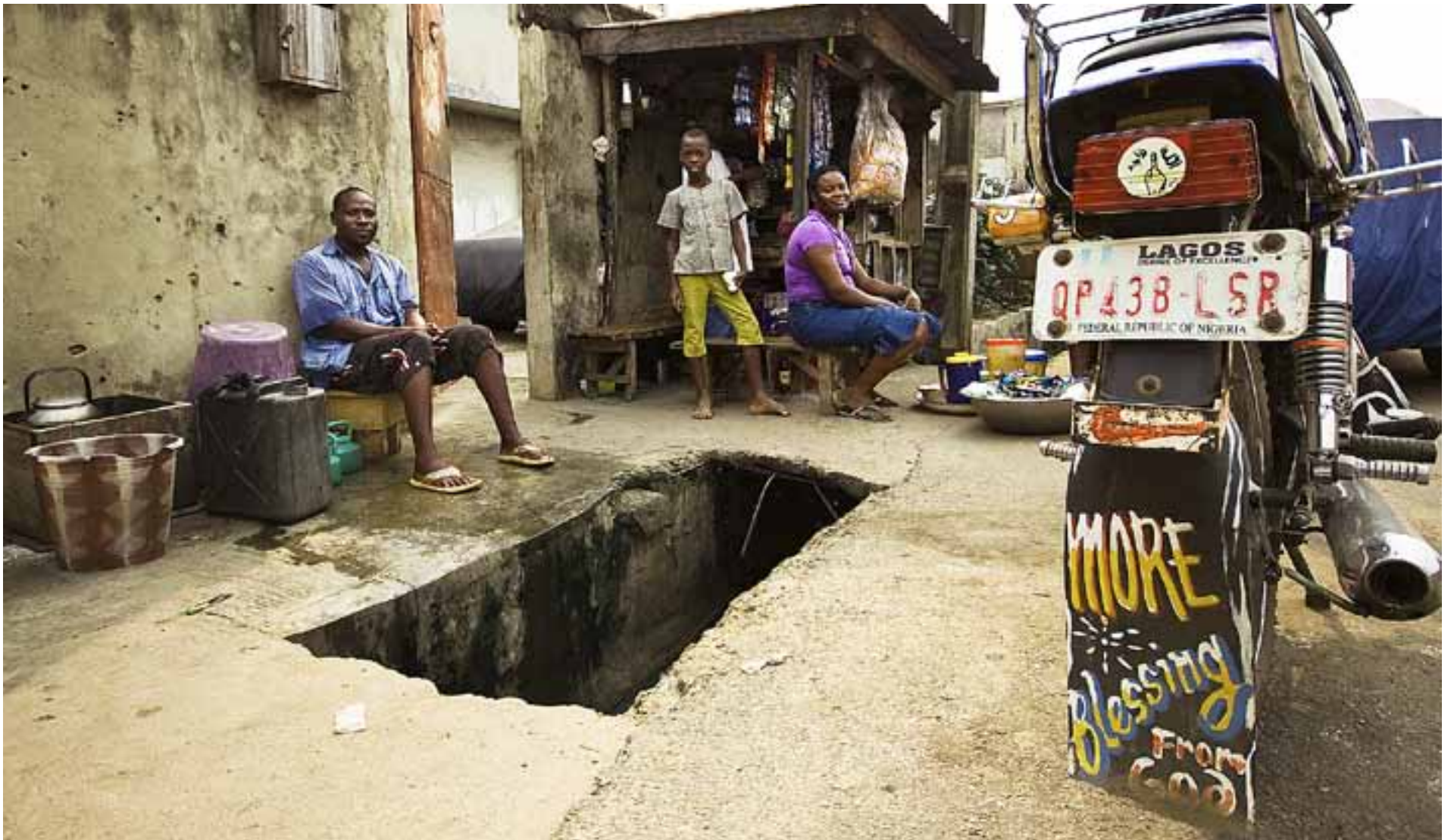
DELAT ITU. Nigeria är ett stort, rikt och brokigt land. I söder är befolkningen kristen, i norr huvudsakligen muslimsk.