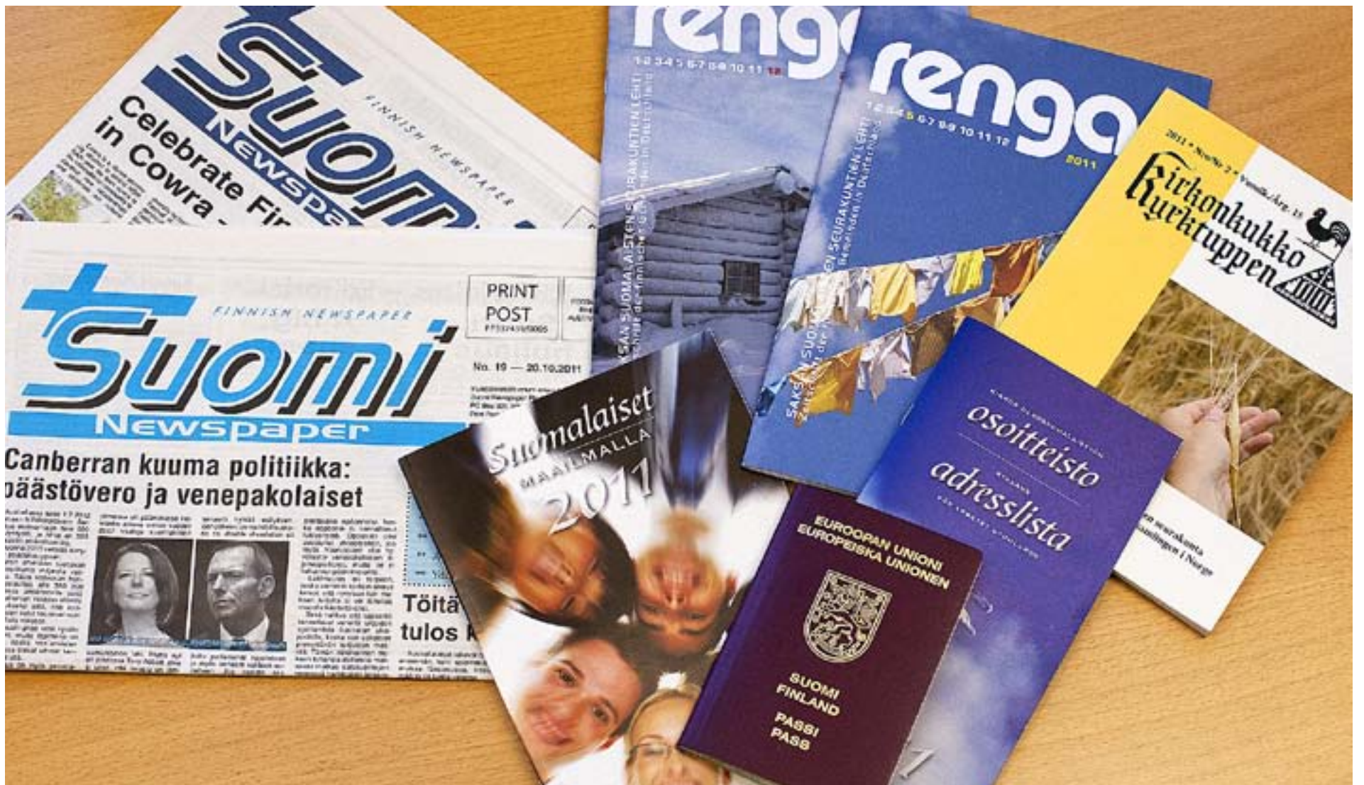
SPRÅKRÖR FÖRENDAR. I länder med större enklaver finländare finns det egna tidningar. De är ibland skrivna både på finska/svenska och det lokala språket.