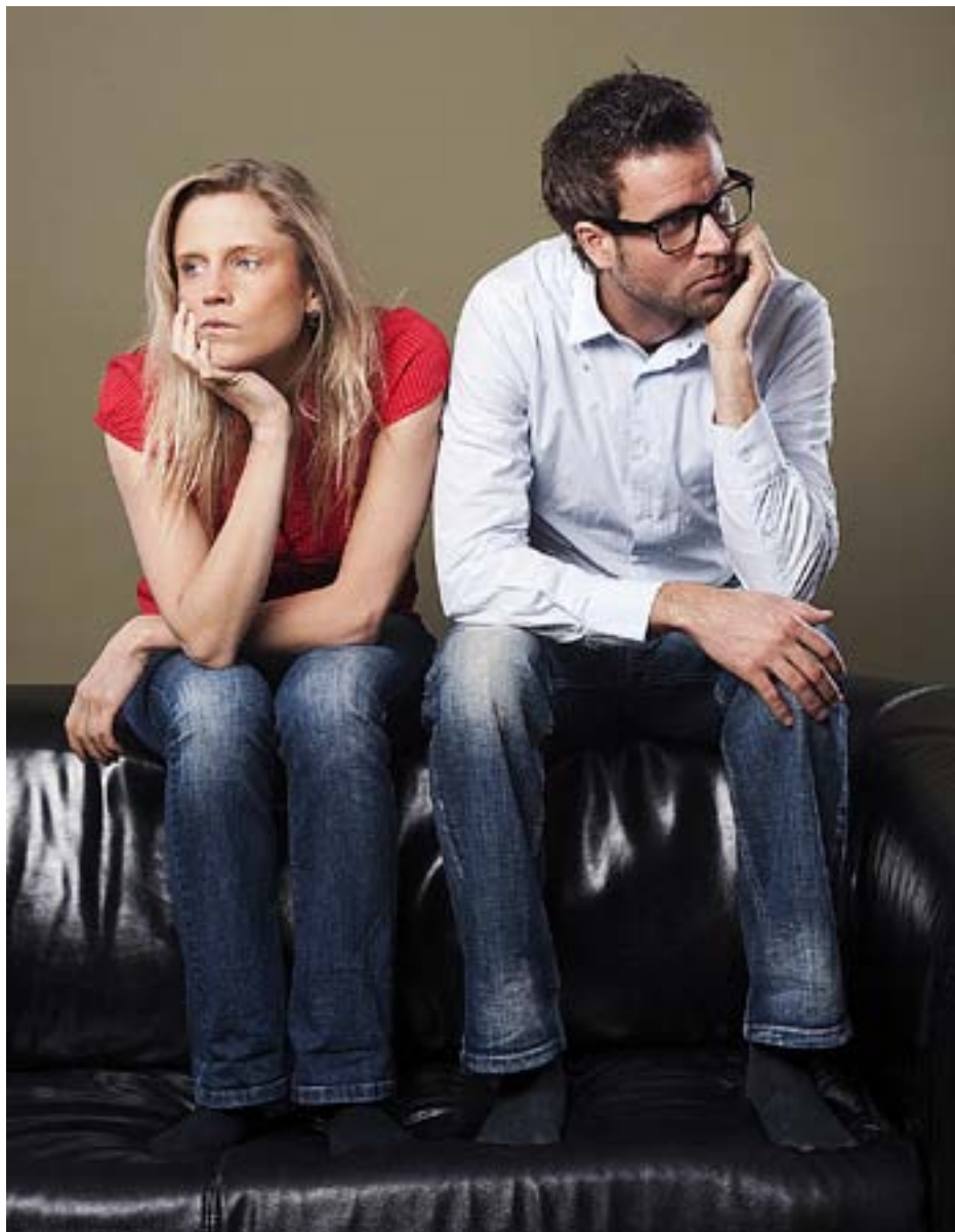
I EN jobbig vardag kan det vara svårt att bryta invanda mönster. En relationskurs kan ge behövlig tid att diskutera livet med sin partner.