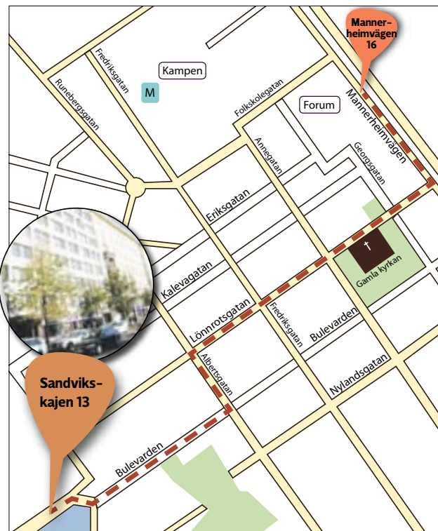
FONTANA MEDIA, Församlingsförbundet och Kyrkpressens redaktion flyttar till Sandvikskajen vid årsskiftet.