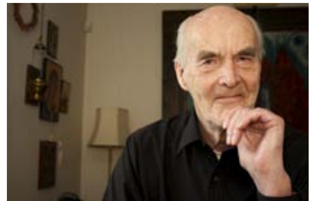
BISKOP EMERITUS Martin Lönnebo presenterar klassiska böner på ett nytt sätt i boken Bönens trädgård .

ras politiska åsikter är ofta splittrade, men alla älskar sitt land och är måna om att deras situation ska bli känd också hos oss.