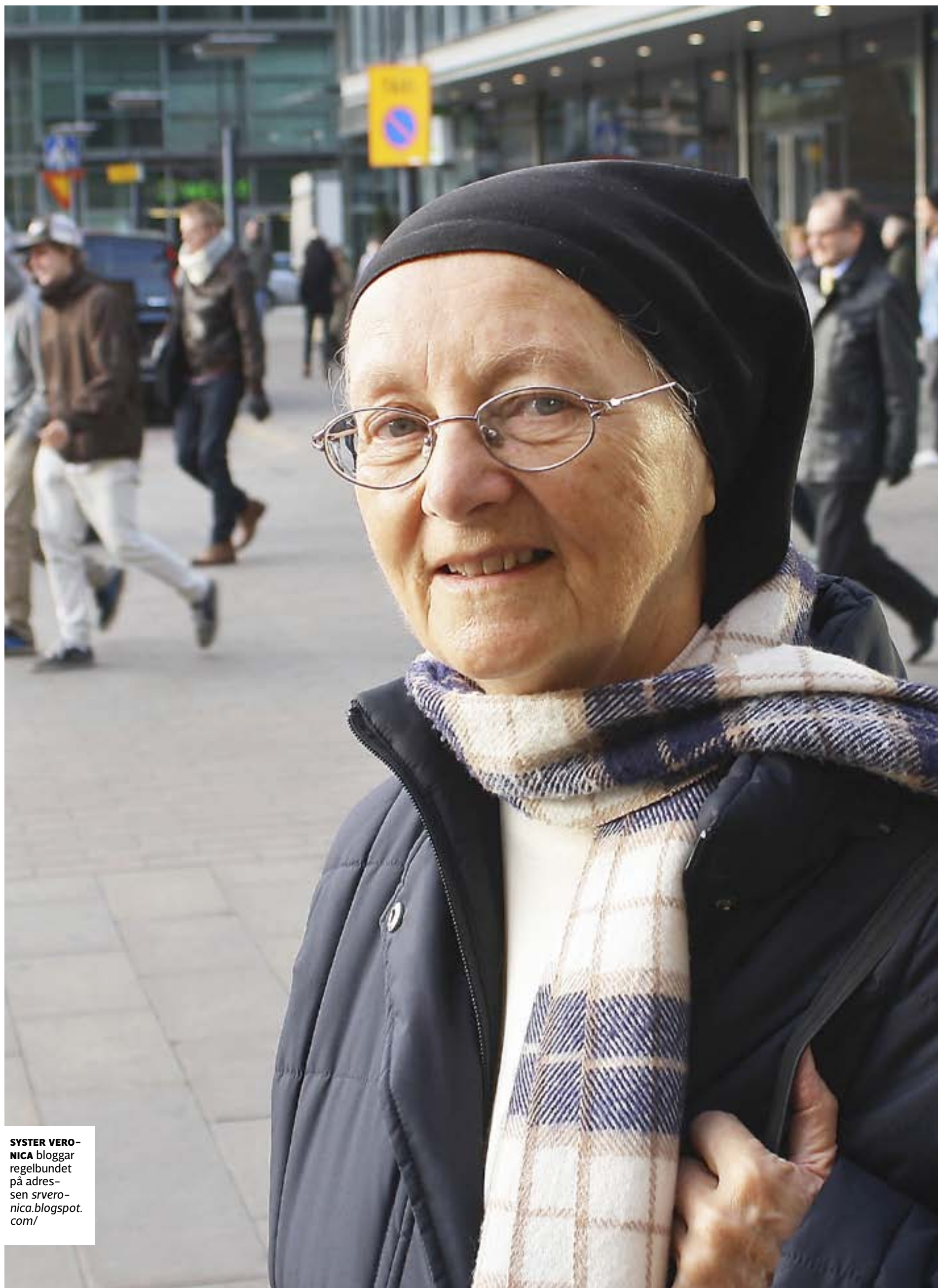
SYSTER VERONICA bloggar regelbundet på adressen sveronica.blogspot.com/