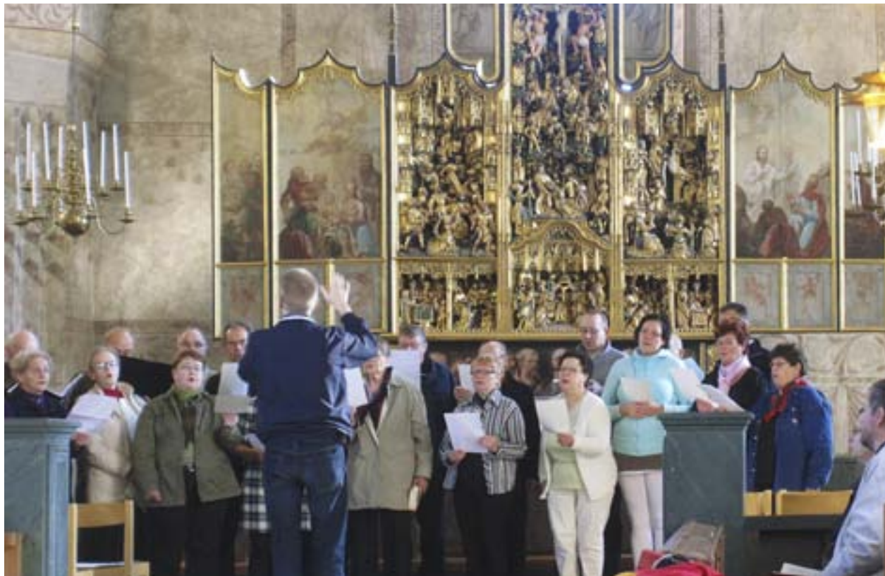
TERJÄRV KYRKOKÖR på församlingsresa till vänförsamlingen Bureå i Sverige. Här i Nederluleåkyrka.

Det berättas att år 1945 när kriget i Finland var över, kom grupper av nordfinska flyktingar till bygden. Prost-