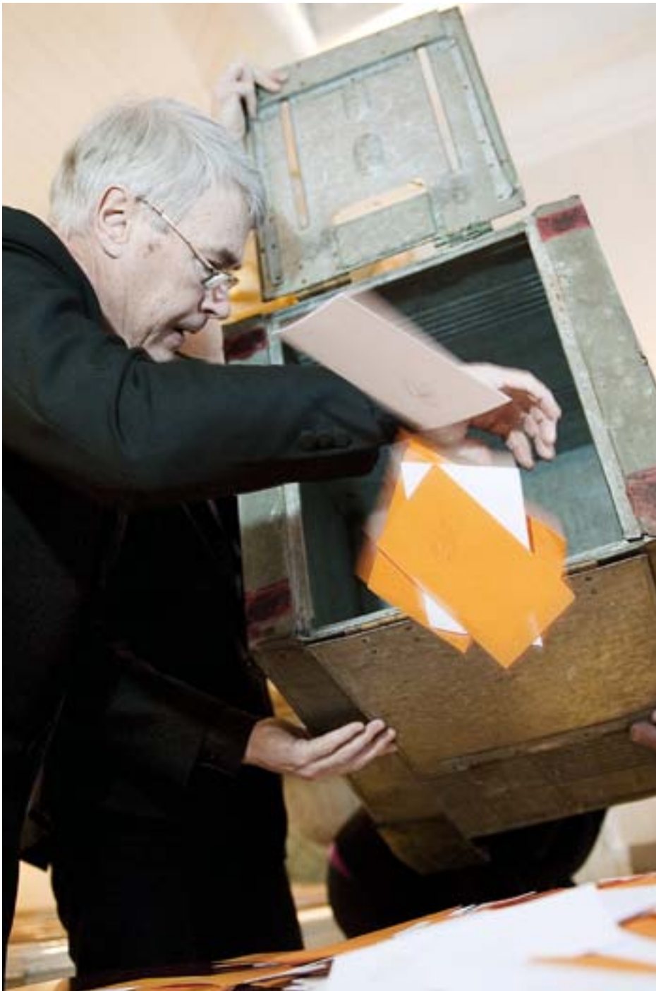
OM FÖRSAMLINGARNA väljer att gå in för indirekta kyrkoherdeval blir det färre turer till valurnan för de vanliga församlingsmedlemmarna.