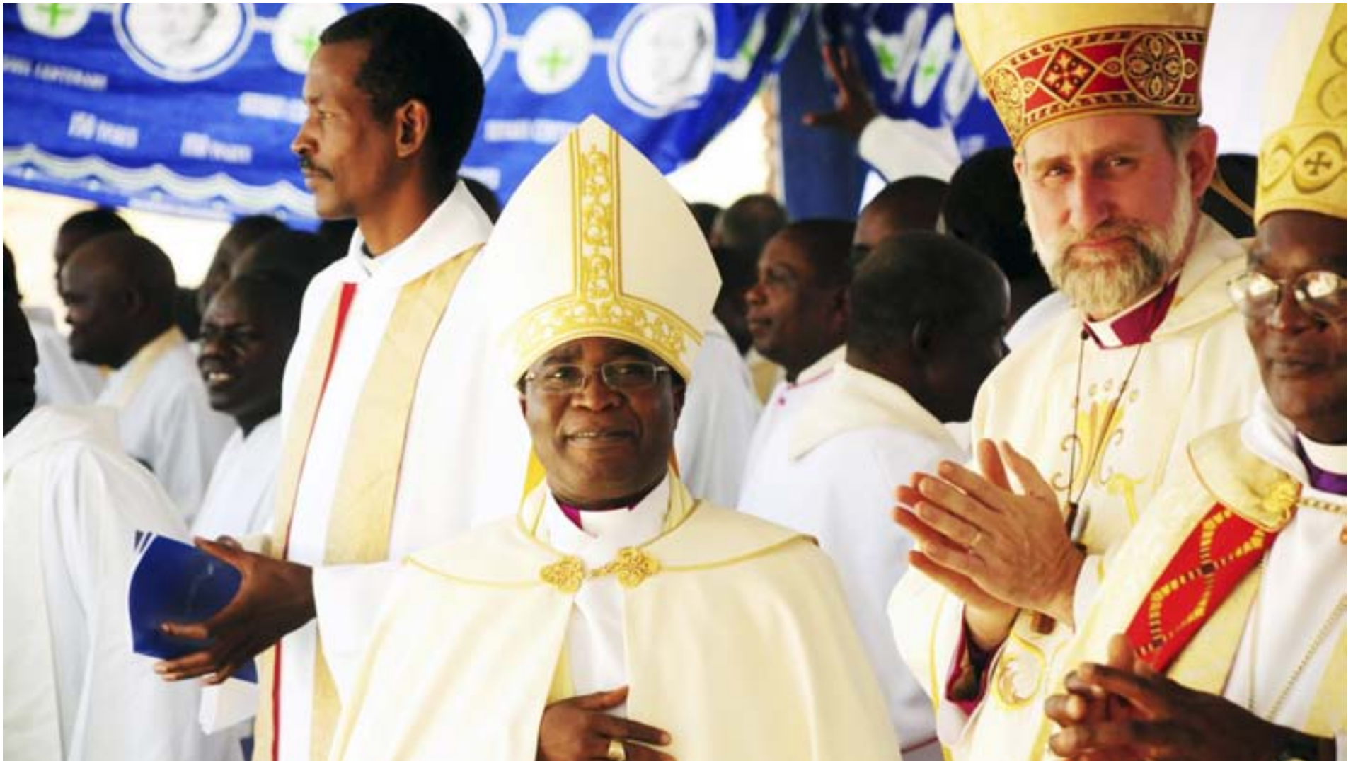
BISKOP JOSEPH Bvumbwe (i mitten) från Malawis evangelisk-lutherska kyrka deltar aktivt i påverkansarbete på regeringsnivå, bland annat i kampen mot korruption.