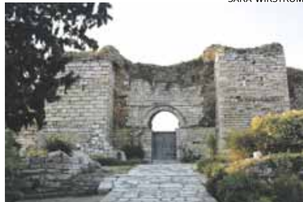
S:T JOHANNES kyrka är numera ett skal, plundrad på sten som byggnadsmaterial. På senare tid har fasaden restaurerats för att ge besökare en aning om dess forna glans.