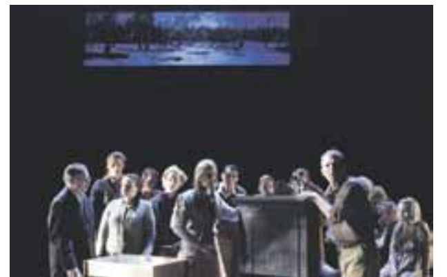
LIVET I Siklax förändras när de evakuerade karelarna anländer.