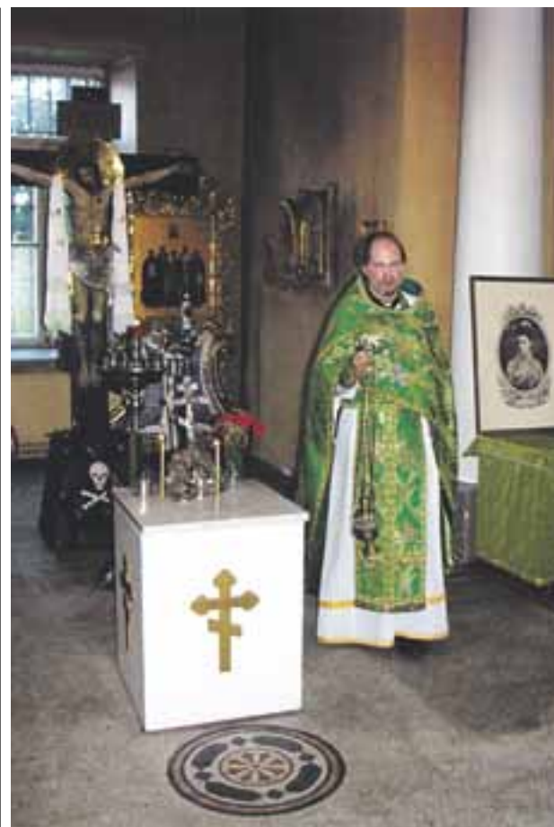
UNDER CEREMONIN var en bild av kejsarinnan uppställd i kyrkan.

Mera info: www.eaglepointevilla.com eller Leif Blomqvist 040-8289531