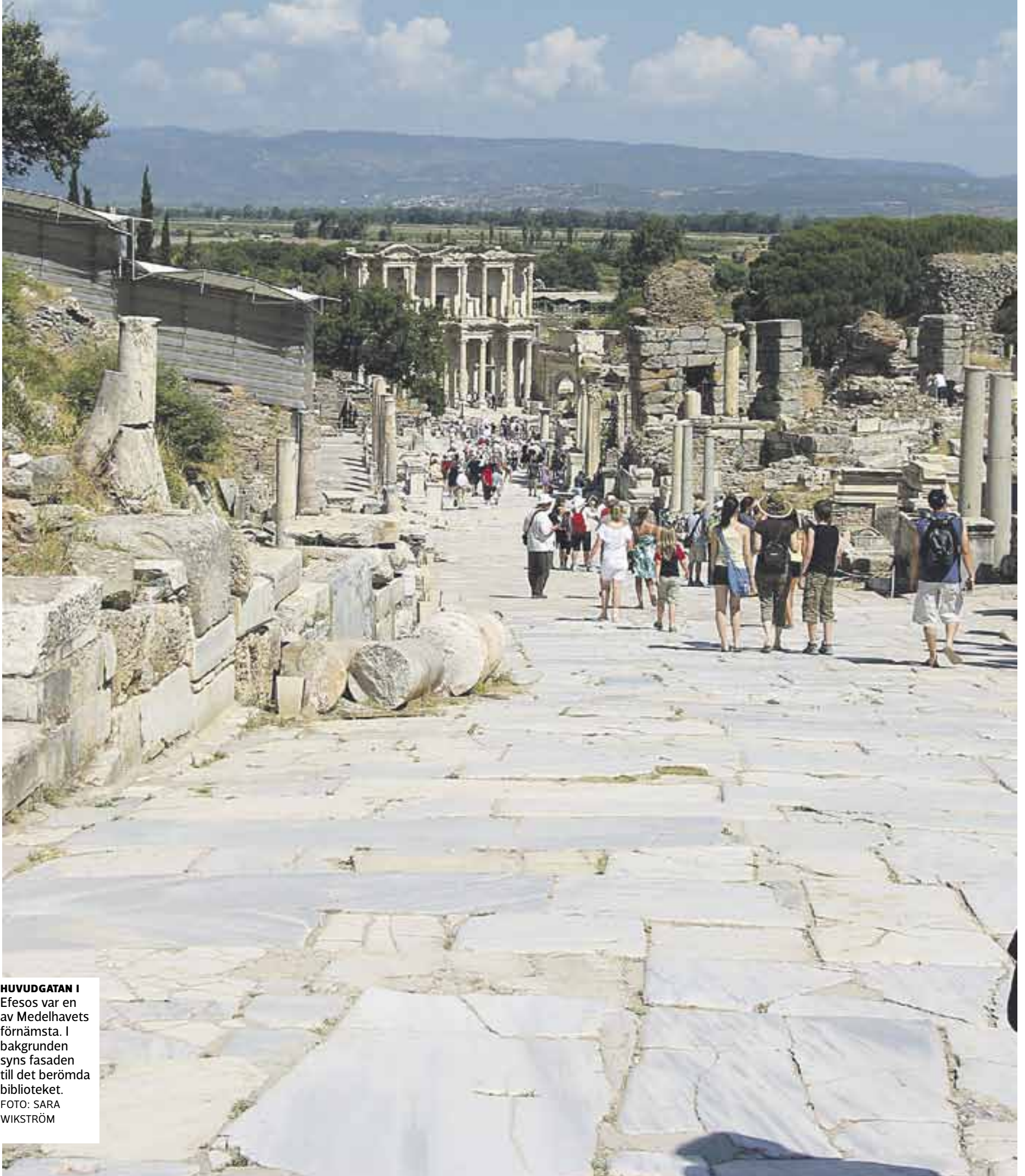
HUVUDGATAN I Efesos var en av Medelhavets förmästa. I bakgrunden syns fasaden till det berömda biblioteket.

SKYDDANDE SMÄLTDEGEL. Efesos år 60 var en pulserande, larmande, trångbodd storstad. Ett perfekt ställe för två högprofilerade kristna att försvinna i – och ett möjligt sista hem för en lärjunge och hans moster.