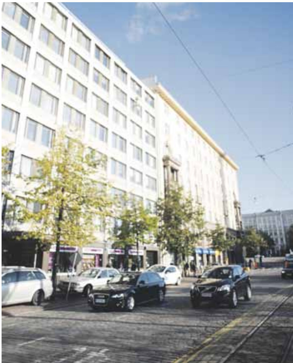
KIRKKO JA KAUPUNKI har svarat för 16 procent av Kotimaa-koncernens omsättning som också utgörs av bokförlaget Kirjapaja, tidningarna Kotimaa, Askel och Lastenmaa samt kundtidningar och nättjänster till församlingar.

inte som någon överraskning för Kirkko ja kaupunkis redaktion.