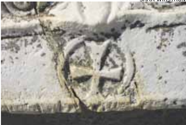
DEN KRISTNA närvaron är märkbar i Efesos. Monumenten bär otaliga korssymboler och till och med det antika klottret röjer att de som ristade in det var kristna efesier.