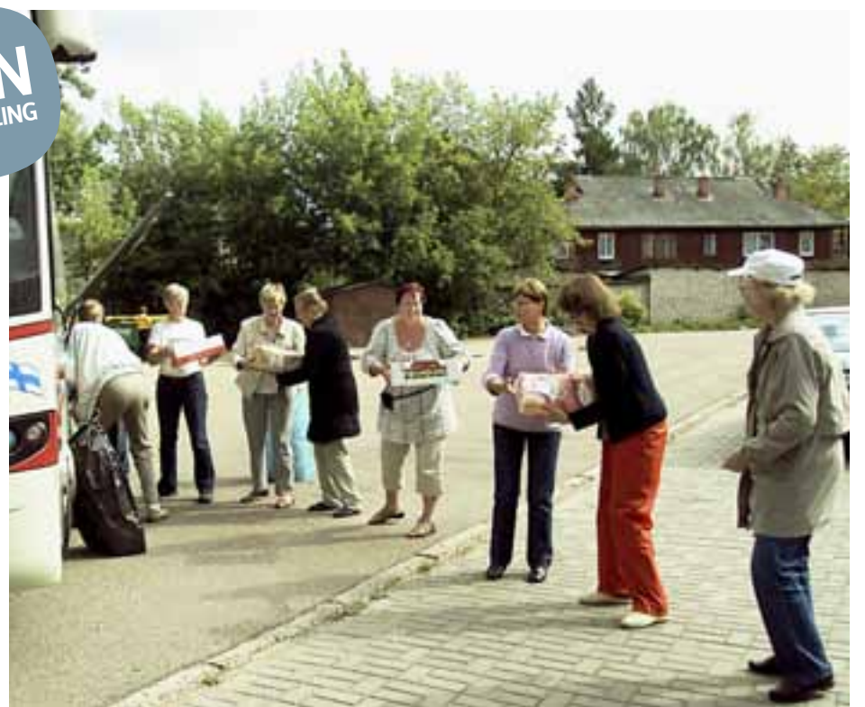
RESAN TILL LETTLAND, som blev en minnesvärd upplevelse för deltagarna, är ett trevligt exempel på vad man kan åstadkomma med frivilliga krafter.

Under årens lopp har Missionsboden med jämna mellanrum fört överblivna varor till Emmaus och ibland skickat dem vidare med Missionskyrkans sändning-