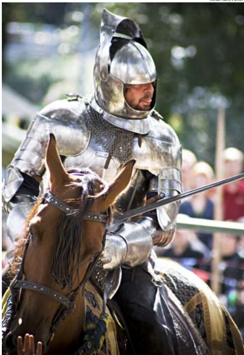
Tornerspel hörde till vid högtidliga tillställningar under medeltiden. En modern version ingår under medeltidsdagen på kyrkbacken i Karleby nästa lördag.

– Under medeltiden klädde folk sig i långa skjortor och särkar, vida kjolar och sjalar. Tygen hade färgats