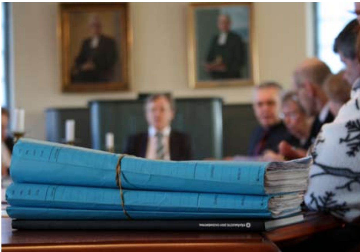
Det sittande stiftsfullmäktige samlas endast en gång till och det blir först i februari 2012 i Borgå.

– Det är fullt möjligt att sammankalla stiftsfullmäktige på mycket kort varsel vid behov. Senast 2009 måste vi lägga in ett extra möte på grund av ett brådskande utlåtande. Också i