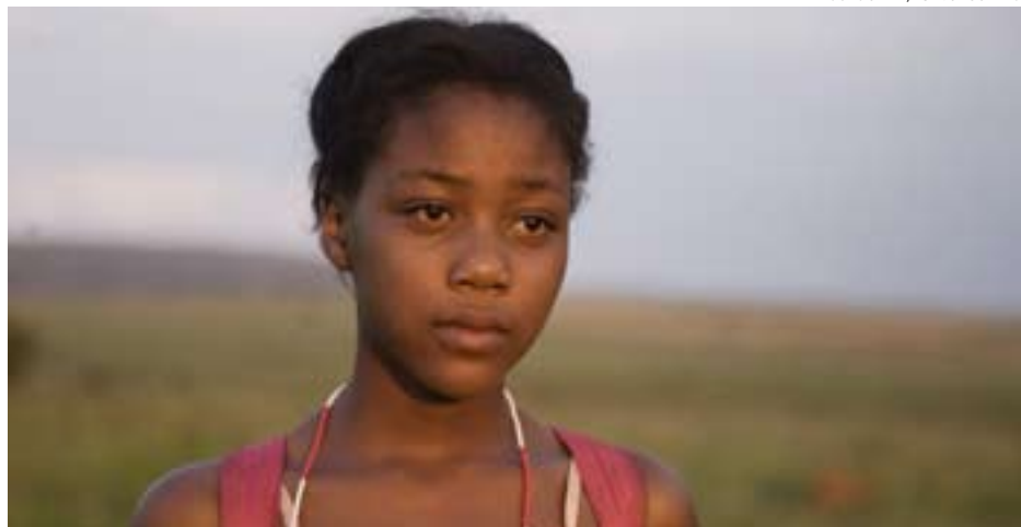
Atlantic film/ Oliver Schmitz

Det i sin tur leder till att man hellre vänder sig till kvacksalvare än till professionella hälsovårdare sam-