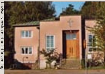
Lovisa svenska metodistförsamling

I mitten av augusti firades gudstjänst för sista gången i Metodistkyrkan i Lovisa. Fastigheten har sålts och blir bostäder.