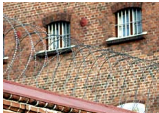
Bland annat i fängelset i Vasa finns fångar med svenska som första språk. De ska i framtiden kunna få hjälp av det nya diakoninätverket.

sat sig fungera bra ekumeniskt, liksom också arbete bland missbrukare.