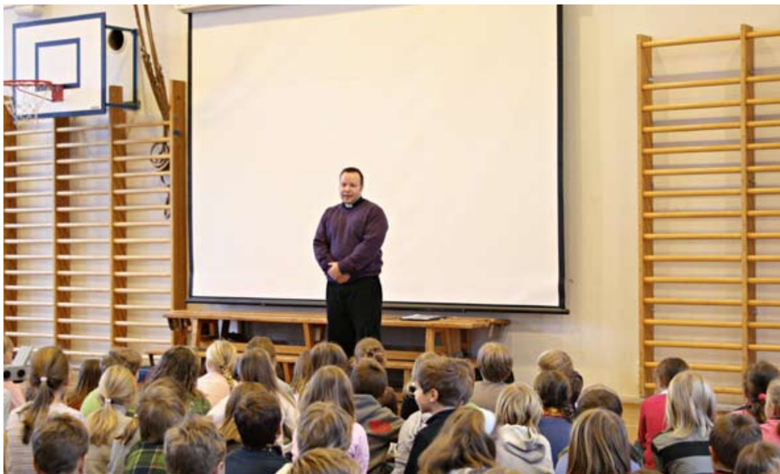
Prästen på bilden har ingen koppling till artikeIn.

Morgonsamling i skolan liknar ingen annan av prästens uppgifter. Språket får inte innehålla svåra ord eller religiös terminologi, innehållet måste vara konkret och hela samlingen tillräckligt kort.