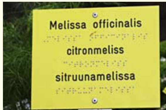
Blindskriften hjälper synskadade att inom ett begränsat område bekanta sig med många växter.