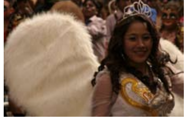
De religiösa inslagen påminner nästan om det västerländska halloweenfirandet.