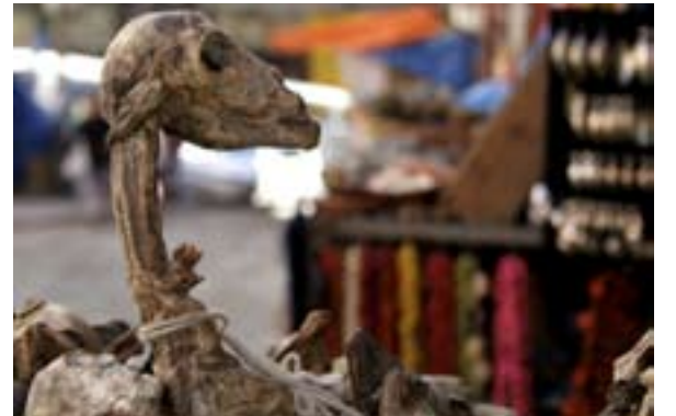
Ett torkat lamafoster begravs ofta vid ett nybygge, för att skydda byggnaden och invånarna.