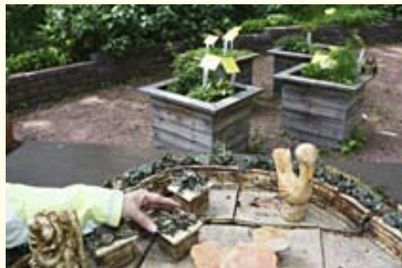
Med hjälp av en miniatyrmodell gjord i keramik kan den synskadade snabbt få en uppfattning om växternas placering i den ingärdade trädgården där allt är planerat för doft- och smakupplevelser.