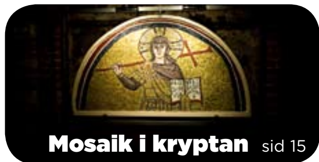
Mosaik i kryptan sid 15