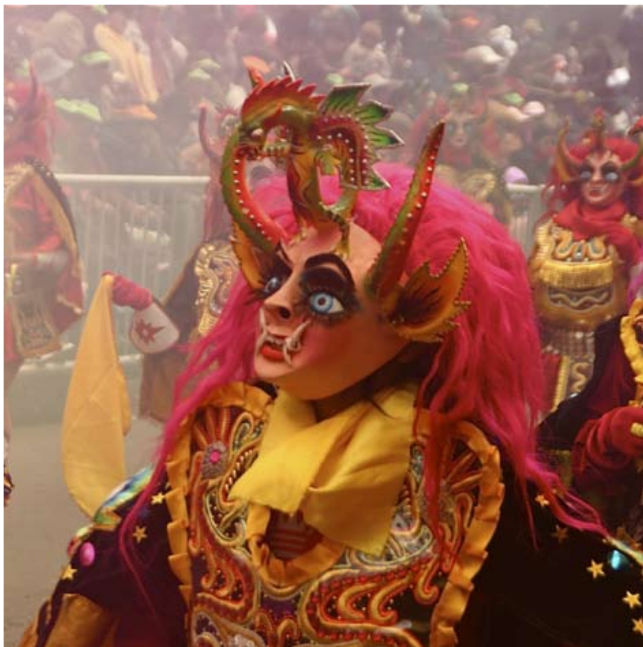
Festen Gran Poder firas varje juni till minne av Jesus som den andra personen i treenigheten. Festivalstågets figurer associerar inte precis till festens huvudperson. I Latinamerika är det inget problem att blanda religiöst och hedniskt.