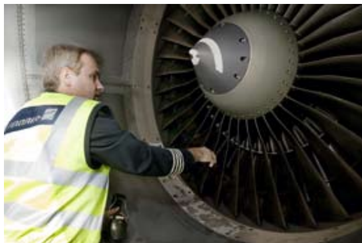
Motorn på Airbusen är i skick. Det händer ofta att piloterna upptäcker brister på planet som åtgärdas innan start.

– Jag är ganska rastlös, säger han. Det lämpar sig bra för pilotjobbet och jag får mitt behov av adrenalinkickar och spänning tillfredsställt. Jag har också en blandning av en viss sorts per-