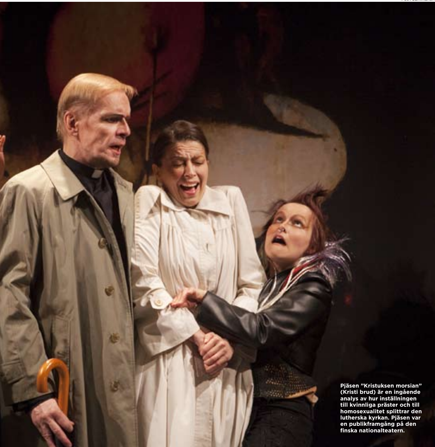
Pjäsen "Kristuksen morsian" (Kristi brud) är en ingående analys av hur inställningen till kvinnliga präster och till homosexualitet splittrar den lutherska kyrkan. Pjäsen var en publikframgång på den finska nationalteatern.