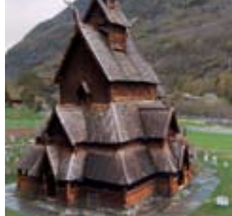
Borgund stavkyrka finns med på listan över de tio vackraste kyrkorna i världen, enligt Budget Travel.

Norge är det enda landet i norra Europa med intakta träkyrkor från medeltiden. Den vackraste enligt listskaparen är Borgund stavkyrka. Den isländska kyrka som finns med på listan ligger i Reykjavik och är stadens högsta byggnad. Den beskrivs likna ett rymdskepp och väckte många reaktioner när den färdigställdes på 1970-talet.