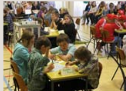
Tävlingssuppgifterna krävde koncentration.

grundskolorna. Bibelkuppen ordnas vartannat år. Ungefär 1 000 elever från drygt 50 klasser i drygt 40 skolor var med i år. (ST)