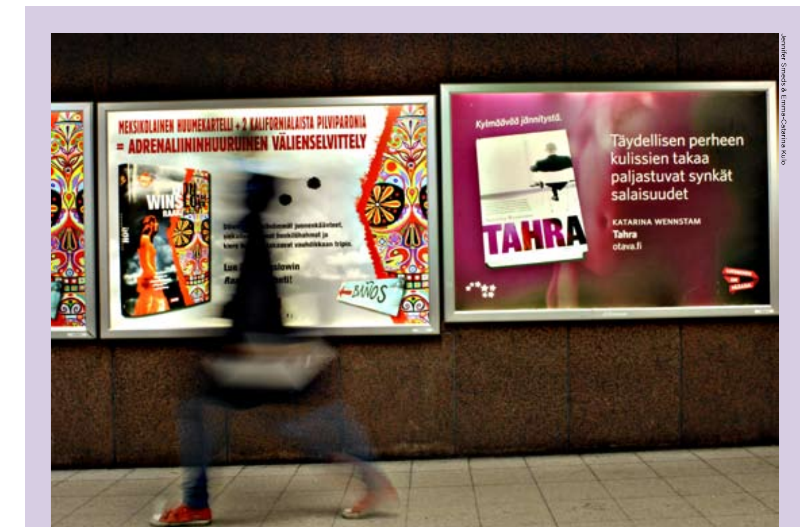
Reklamer får önskad effekt om de stärker gällande värderingar och attityder. Glada människor gör betraktaren positivt inställd till annonsören.

– Man får akta sig för att bli vag. Trots att man riktar