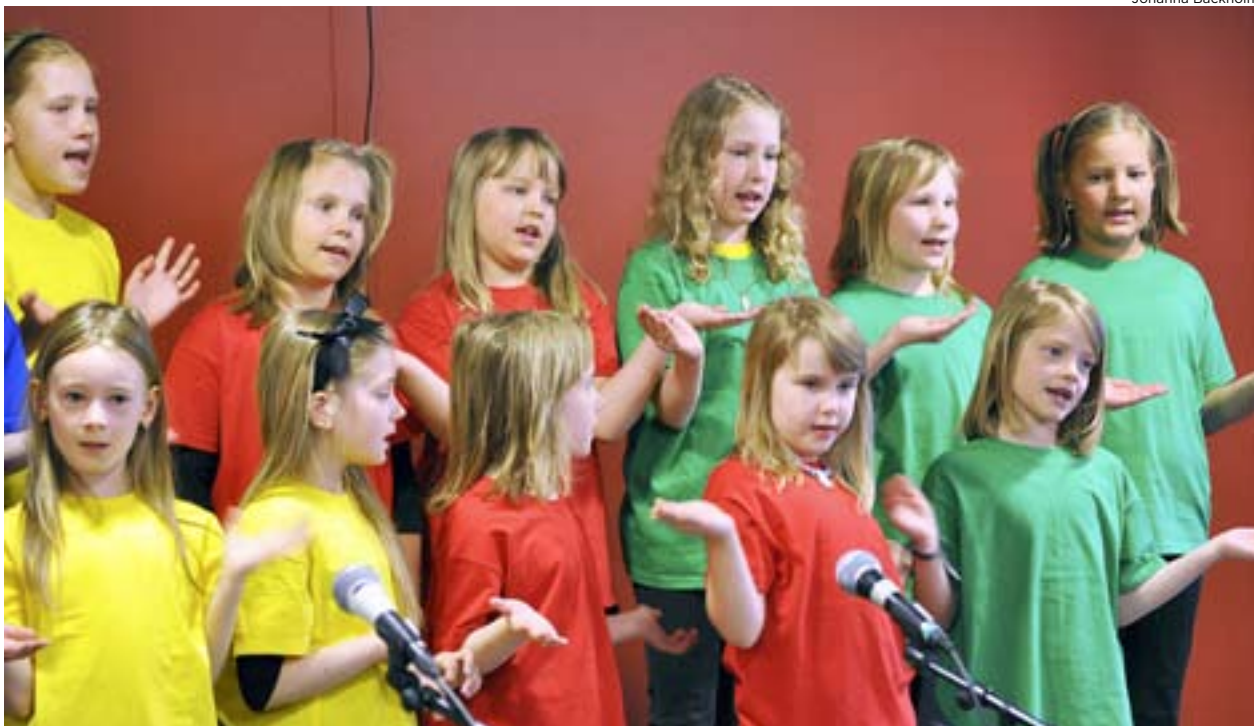
Glädjen är stor när Sundom skolkör uppträder för eleverna i Sundom skola.