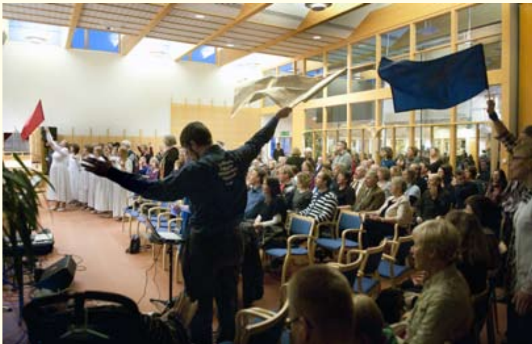
Lovsång och flaggor är de synligaste kännetecknen för Oasrörelsens sammankomster. Oasrörelsen samlades i Jakobstad under veckoslutet.

– Det är en samling för kristna från olika samfund där man tydligt lyfter upp Jesus som Herre, slår ett slag för Bibeln som Guds ord och för klassisk kristen tro. Det är andligt starkt när man ber tillsammans öppet och frimodigt på ett positivt sätt. Manifestationen föregås av evangeliserande möten på flera torg.