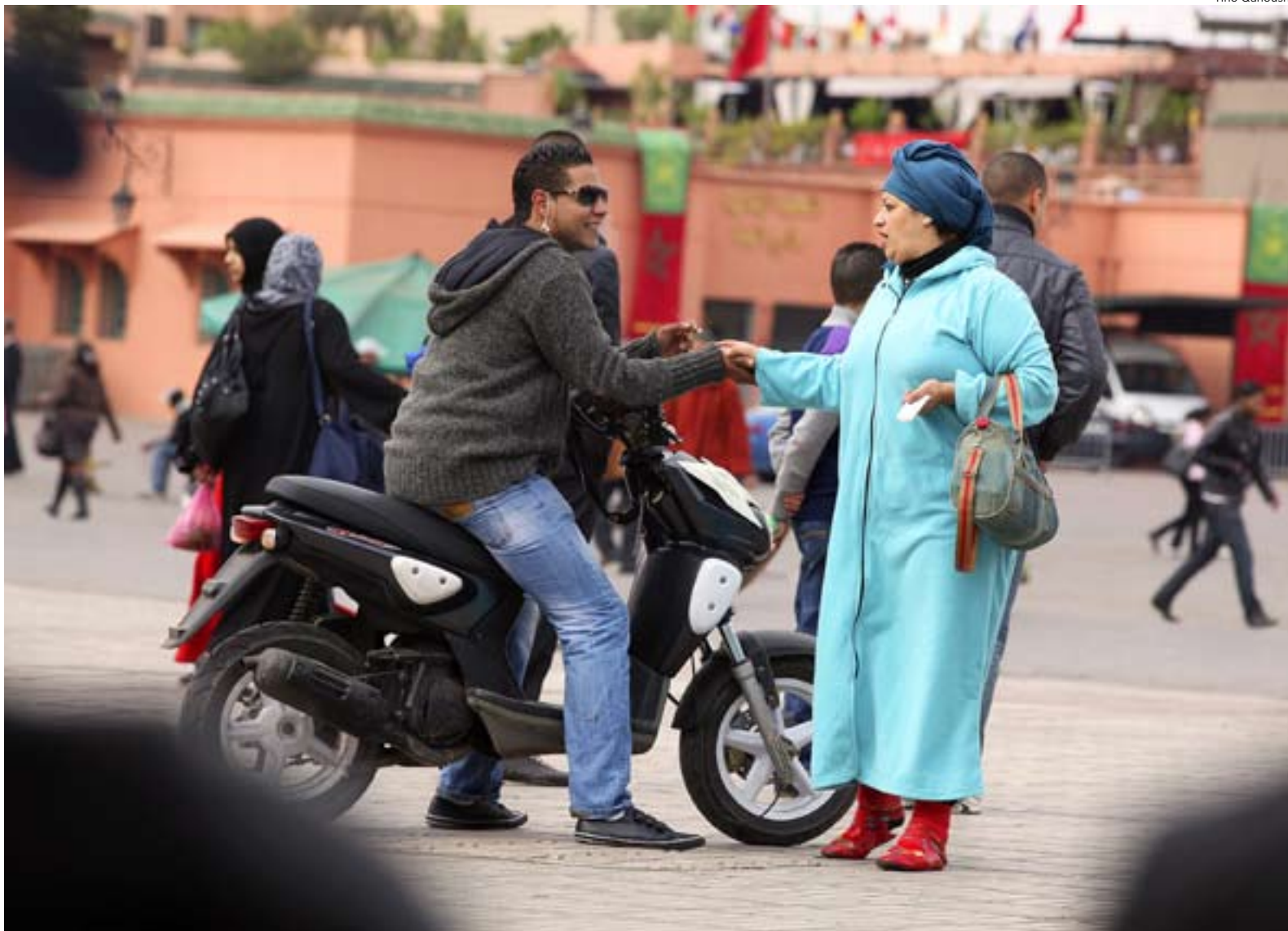
Vardag i Marrakesh. Kungen i Marocko har lovat författningsreformer och folkomröstning för att föregå revolter. Men också här växer protesterna.

Frihetstorget i Benghazi sjuder av libyernas förväntningar.