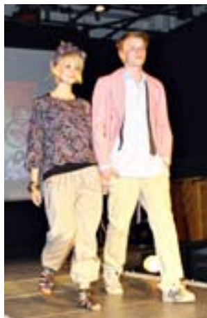
Så här såg det ut i fjol då Sibbo församling ordnade modevisning i samband med sitt Gemensamt Ansvar-jippo.

rande skötte sminkningen och två andra tjejer fixade frisyren. Den som tog kontakt med ungdomarna och såg till att catwalken byggdes och ljudet och lju-