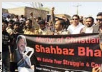
Både kristna och muslimen deltog i begravningen.

Trettio tusen kristna och muslimska sörjande samt demonstranter uppges ha deltagit i begravningen av minoritetsminister Shahbaz Bhatti i hans