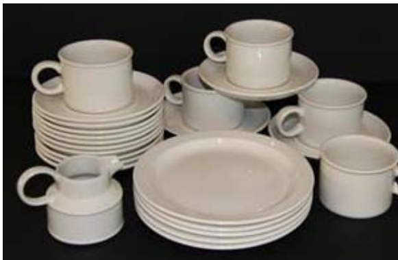
Ärkebiskopens teservis säljs till förmån för Svenska kyrkans fastekampanj.

Svenska ärkebiskopen Anders Wejryd säljer sin teservis från 1970-talet på en nätauktion. Inkomsterna går till Svenska kyrkans årliga fastekampanj. Temat för i år är "ALLT för att utrota hungern". Målet är att samla in 45 miljoner till arbetet att utrota hungern i världen, rapporterar Dagen. Fastekampanjen samarbetar med Traderas nätauktioner och en reklamfilm med Wejryd kommer att visas på tv. Vem som helst kan sälja eller köpa något på kampanjsidorna http://kampanjer.tradera.com/hunger . (MW)