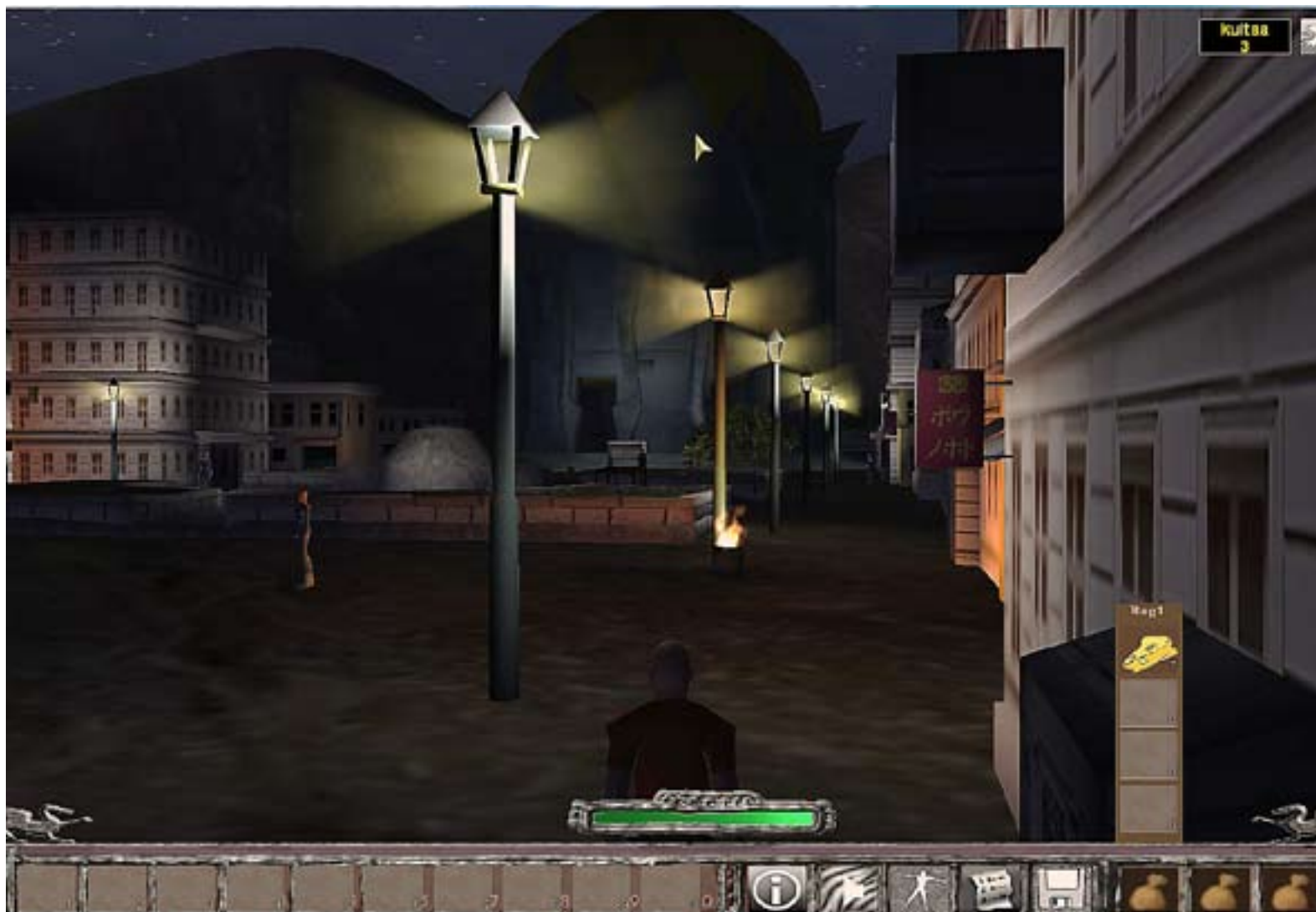
I datorspelet Khan ska spelaren försöka skapa fred mellan de olika folkgrupperna i Khans land.