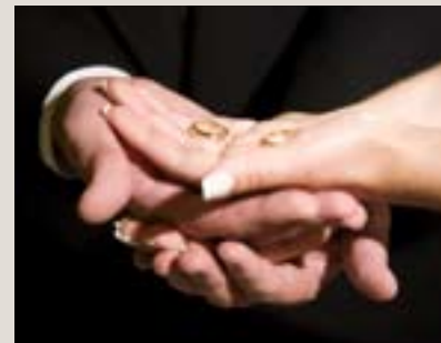
Antalet skilsmässor var fler bland ortodoxer än lutheraner åren 2007–2009.

Tidningen Analogi anser ändå att skilsmässosiffrorna bland de ortodoxa är alarmerande och undrar om de kan utgöra ett trovärdighetsproblem för kyrkan. ”Hur kan en kyrka som ser äktenskapet som ett sakrament tala trovärdigt för äktenskapet då skilsmässosiffrorna är så här höga?” frågar sig tidningen. (ST)