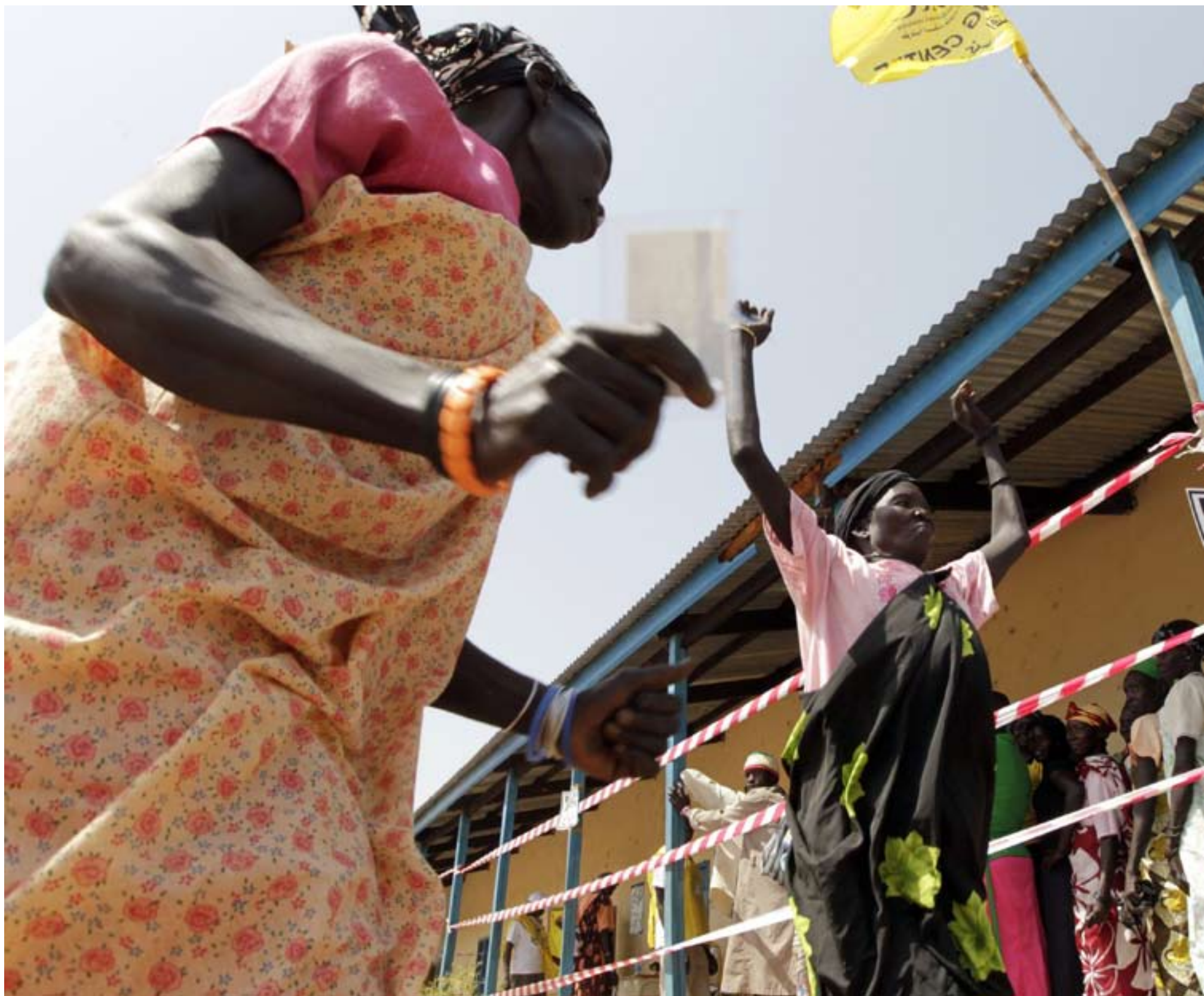
Sydsudanesiska kvinnor jublar efter folkomröstningen den 10 januari i byn Peiti nordväst om Juba. I juli skils södra Sudan från den norra, muslimska delen av landet och blir en egen stat.

Självständigheten kan ge kristna i södra Sudan större frihet