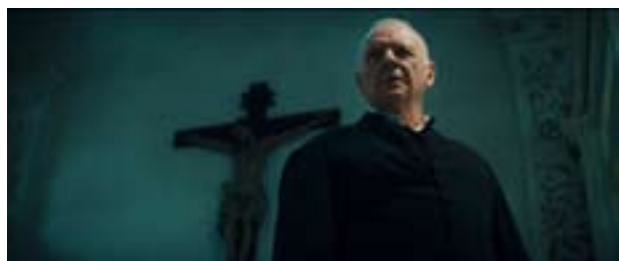
Anthony Hopkins gör en övertygande rollprestation som tvivlande exorcistmentor i filmen The Rite .